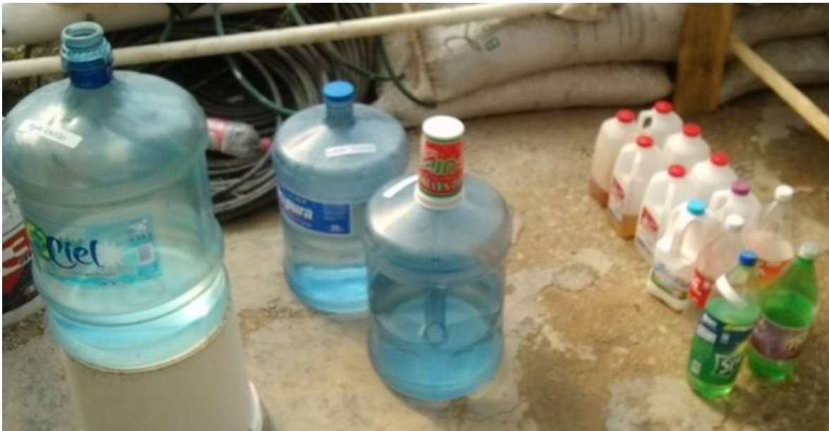
FIGURA.1 MATERIALES PARA EL RIEGO DEL EXPERIMENTO