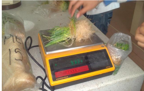
FIGURA. 7 PESAJES DE FORRAJE VERDE HIDROPÓNICO

Durante esta prueba se llevo acabo el proporcionar a cierto numero de conejos la cantidad de 50 grs de fvh de cada charola perteneciente al experimento esta cantidad se les proporciono por un tiempo de aproximadamente 5 minutos durante este tiempo se observo si era consumido al final se retiro y se evaluó la cantidad de fvh consumido.