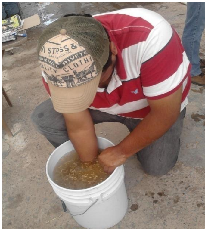
FIGURA. 2 LIMPIEZA Y DESINFECCIÓN DE SEMILLA DE TRIGO

Se llevaron acabo tres lavados para su perfecta desinfección, el primer lavado se realiza con 15 litros de agua potable en una cubeta de 20 litros se coloco (fig. 2) 1kg de semilla previamente seleccionada se comenzó a mover manualmente la semilla para que se lavara completamente, después se retira todo lo que se encuentra flotando como semillas y basura. Después se realiza el segundo lavado ahora con 15 litros de agua potable y 5 ml de cloro por un tiempo no menor a 30 segundos ni mayor a 3 minutos ya que si se deja por más tiempo esto puede ocasionar que no ocurra la germinación Ya por ultimo se enjuago la semilla por 3 veces más. Después se dejo remojando la semilla por un tiempo de 24 horas para que absorba agua y comience la etapa de germinación.