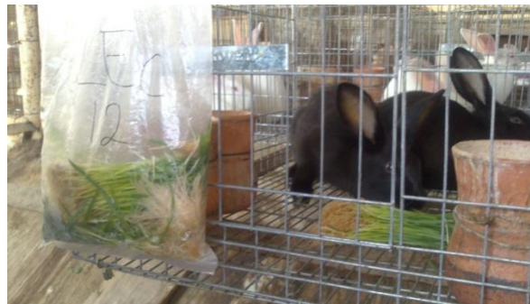
FIGURA. 8 CONEJOS EN PRUEBA DE PALATABILIDAD