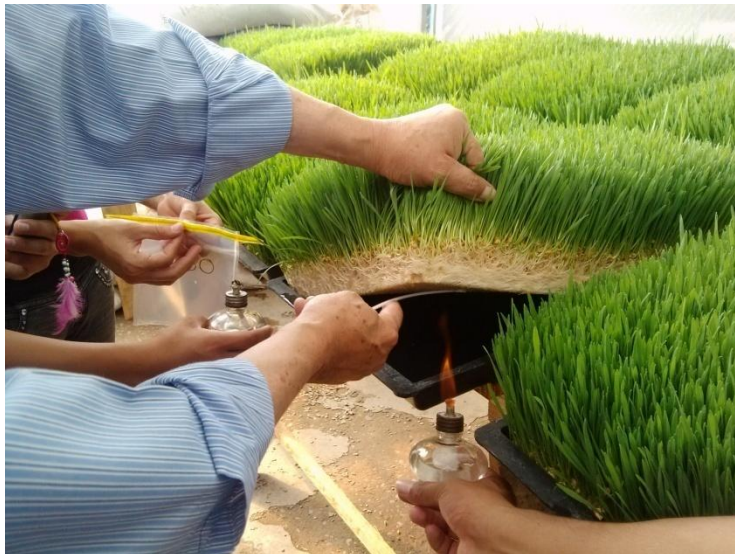
FIGURA. 4 TOMA DE MUESTRA CON HISOPO

En el laboratorio se sembró en una caja petri con agar simple para crecimiento de hongo y se incubó por 48 hrs. Al término de las 48 hrs, se evaluó el crecimiento del hongo y se tomó una muestra con un asa para hacer un cultivo controlado y determinar que tipo de hongo se encontró en la muestra. A las 48 hrs posteriores se tiñeron las muestras de crecimiento de los hongos y se identificaron.