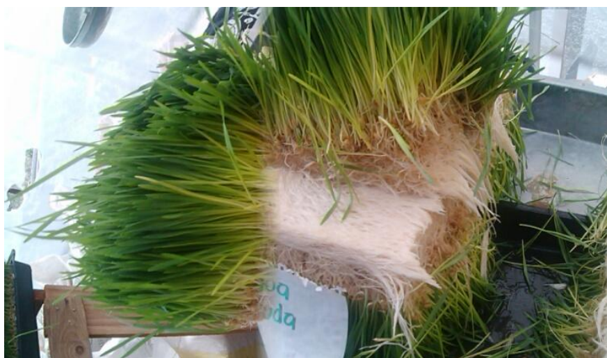
FIGURA. 6 CARACTERÍSTICAS FÍSICAS DEL FORRAJE VERDE HIDROPÓNICO

Se llevo acabo el análisis del FVH donde se tomaron distintas características físicas como son el tamaño, el color, la raíz y el olor