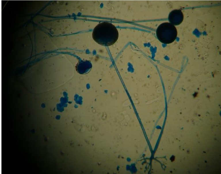
FIGURA. 10 HONGO Rhizopus spp