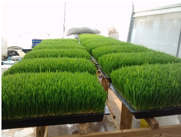
FIGURA. 5 FORRAJE LISTO PARA COSECHA

Este proceso se realizó a los 12 días y por cada charola cosechada se obtuvieron aproximadamente 9 kg de forraje (fig.9)