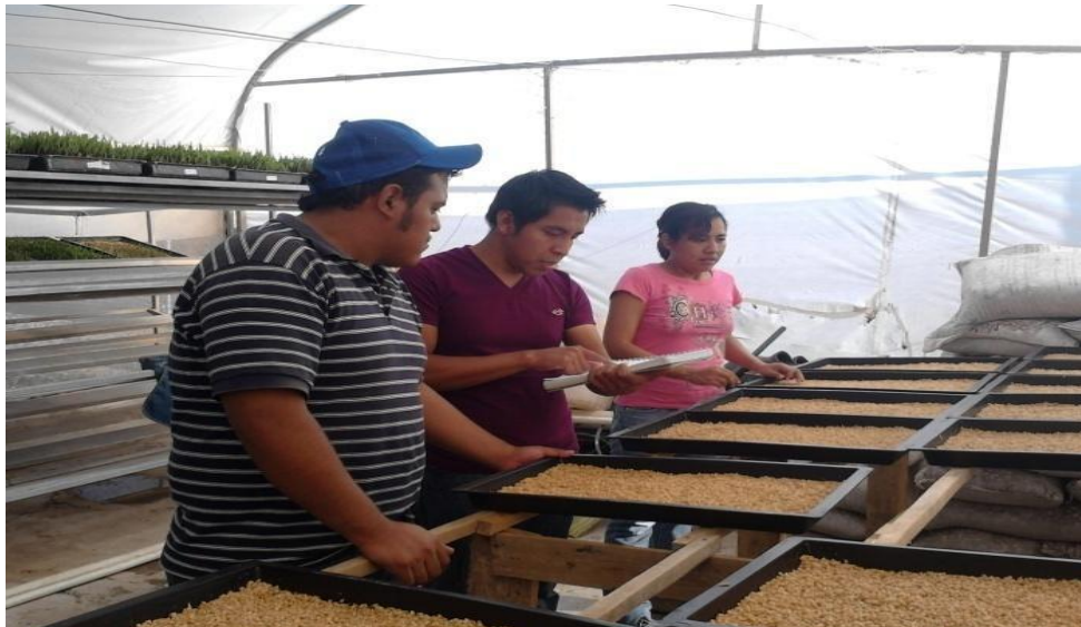
FIGURA. 3 IDENTIFICACIÓN DE CHAROLAS

(fig. 3), después se colocaron todas las charolas en un estante previamente adaptado dentro del invernadero y que contaba con una pendiente de 10° para que el agua de riego fluya a lo largo de la bandeja y salga por los orificios. Se taparon las charolas por un periodo de 48 horas esto para proteger a la semilla de la luz solar y así lograr una germinación más rápida y uniforme. Pasado el tiempo fue retirada las tapas y se alcanzó una germinación de un 90-95 %.