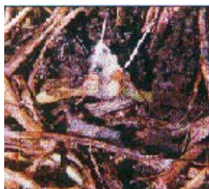
Figura 6. Ataque masivo de ninfas en una sola planta