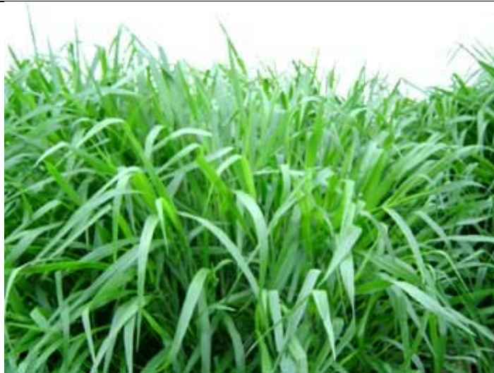
Figura 1. Ilustración de la especie Brachiaria brizantha

Esta planta (Fig. 1) es conocida comúnmente como pasto insurgente o palisade (Enríquez et al., 1999), cuyo centro de origen se ubica en el este de Africa tropical. Hochst (2000) la describe como una hierba basta, perenne, de hoja ancha, hasta de 2 m de altura. Rizomatosa o estolonífera. Muy variable en cuanto a porte, hojiosidad, pubescencia y rendimiento. Crece en la mayoría de los suelos, en terrenos abrigados, con más de 750 mm de lluvia. Resiste sequías moderadas y está sujeta a los suelos sueltos. Los tipos de porte postrado tienen hojas y tallos de elevado contenido proteico, y forman pasturas valiosas. En seco sólo da uno o dos cortes. Se propaga por semilla. Se puede cultivar junto con Centrosema pubescens o Pueraria phaseoloides .