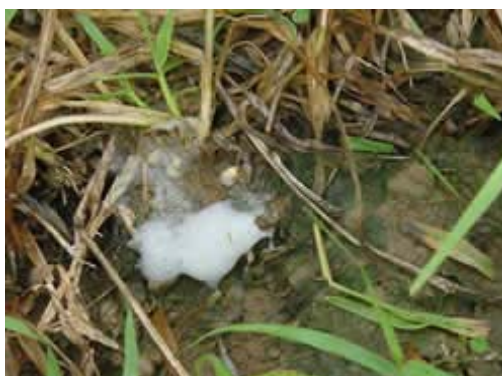
Figura 3. Espuma similar a la saliva por exudado de las larvas de mosca pinta.

La característica principal de esta plaga es la gran cantidad de espuma (Fig. 3) similar a la saliva, de ahí su nombre de salivazo. Esta espuma, es lo que protege al insecto en su etapa de ninfa, y esta constituida por residuos de jugos nutritivos de la planta y exudaciones del insecto (Bernal, 1991)