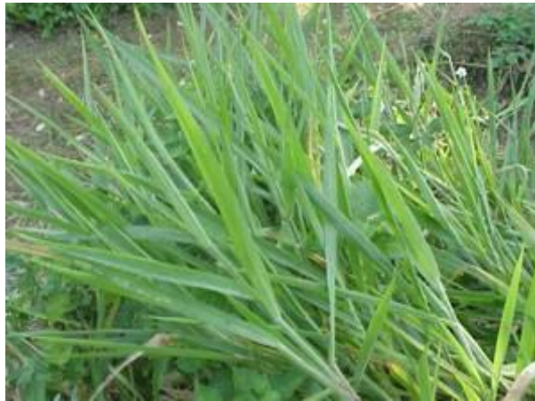
Figura 2. Ilustración del pasto Brachiaria decumbens

Es una gramínea perenne del este de África, comúnmente conocida como chontalpo, señal o signal (Fig. 2). También se dice que es un pasto nativo de los pastizales abiertos de Uganda. Tallos hasta de 60 cm, rastreros. Adecuada para zonas húmedas donde crece en suelos arenosos bien drenados. Resiste la sequía pero no el anegamiento. Es un valioso elemento de las sabanas de África oriental. Se pasta fácilmente, pero, según informes, causa diarrea si es consumido continuamente por el ganado durante largo tiempo. Su rendimiento es bastante elevado, buen productor de forraje pero también buen productor de semillas (Flores, 1980). Su introducción a Australia y el Caribe ha sido exitosa (McIlroy, 1979). Corrientemente se propaga por estaquillas o mechones separados.