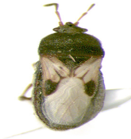
Figura 10. Blissus sp.

y hojas de las pasturas que puede matar a las plantas en cuestión de pocos días. Este insecto no vuela y se traslada masivamente de las plantas muy afectadas a nuevas áreas. Esta plaga al igual que el salivazo, tiene mayor incidencia en las regiones tropicales donde se confunde con los efectos causados por esta última quema. Para diagnosticar la presencia del insecto se debe escarbar el área de la raíz, donde se encuentran miles de insectos de varios tamaños o estados de desarrollo, los más jóvenes son de color rojo y los más avanzados, de color negro con alas transparentes cerca de la cola. (Valenciaga, 1999)