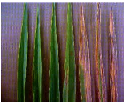
Figura 5. Evolución del daño por alimentación del adulto de salivazo