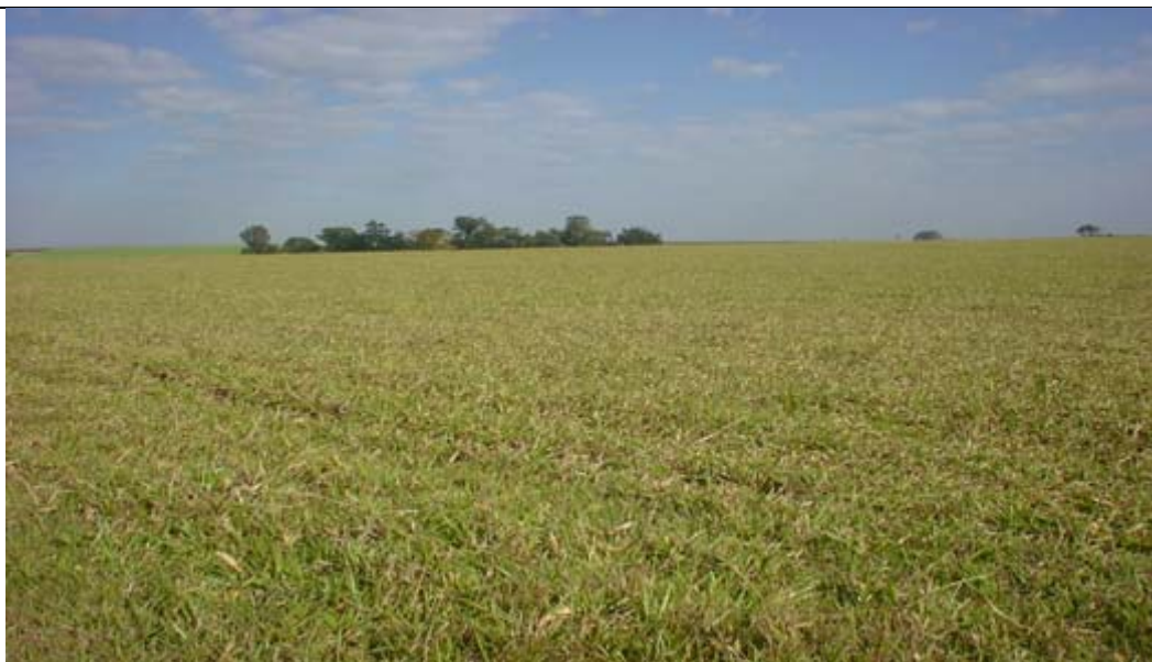
Figura 9. Pastoreo Rotacional de Potreros

De todas estas practicas culturales para el control del salivazo de los pastos, el pastoreo rotacional es talvez uno de los mas eficaces y económico con el cual el productor puede contrarrestar los efectos causados por esta plaga. (figura 9)