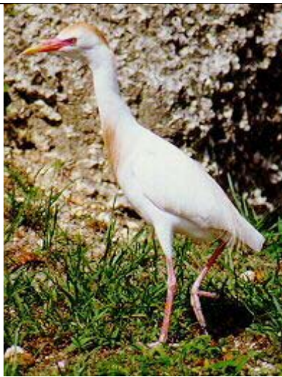
Figura 8. Bubulcus ibis