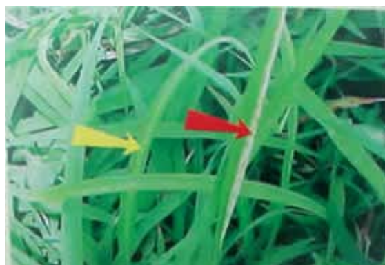
Figura 4. Daño inicial por alimentación de adultos de salivazo

espuma en forma de saliva (Anónimo, 2007)