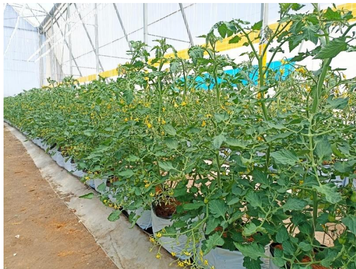
Figura 13. Tutoreo de tomate grape.

El tutoreo es considerado una de las actividades de mayor importancia en el manejo del cultivo ya que de este depende la integridad de las plantas y evita que se doble la guía principal, de acuerdo a los datos de fenología se sabe que una planta sana de tomate grape crece en promedio entre 25 y 30 centímetros a la semana por lo cual, se tomó en cuenta que la actividad de tutoreo se debía realizar por lo menos una vez a la semana para mantener al día dicha actividad evitando así tener atrasos, el dato que se determinó para el mantenimiento de dicha labor de acuerdo a mi experiencia debía ser la asignación de dos personas por hectárea para el mantenimiento, los cuales tenían que laborar 5 días a la semana y cumplir con un rendimiento de 10 surcos de 50 m dichos surcos tenían una densidad de 512 tallos dando un total de 5,120 tallos que tenían que enredar a diario, en esta actividad se supervisaba que estuviera realizada correctamente ya que los puntos más relevantes a considera era evitar que el colaborador descabezara tallos y disminuyera la densidad de planta por hectárea (Figura 13).