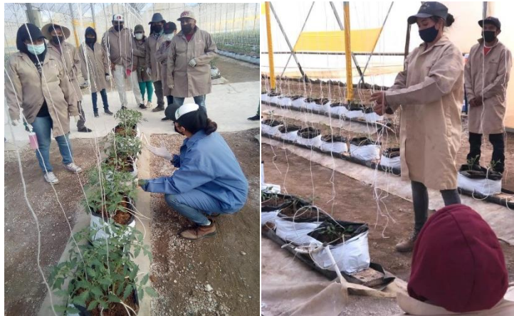
Figura 9. Capacitación al personal sobre diversas labores culturales.