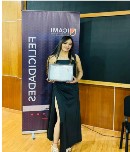
Figura 7. Diplomado de ICAMI.

producción. Las herramientas adquiridas en el diplomado no solo se pueden aplicar en el ámbito laboral, sino que también son de utilidad en la vida cotidiana.