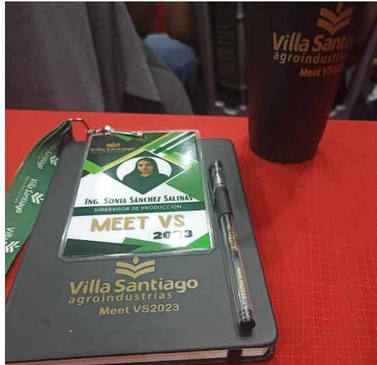
Figura 4. Evento de presentación de metas 2023.