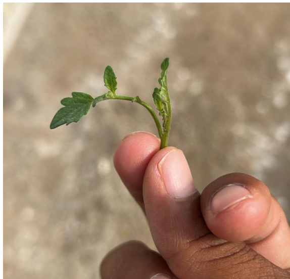
Figura 14. Brote axilar no mayor a 7.0 cm.

La poda es una actividad complementaria de gran importancia la cual consiste en quitar los brotes axilares que les salen a la planta en cada entrenudo con el fin de evitar que estas pierdan energía en el crecimiento de brotes y estos nutrientes sean aprovechados en el tallo principal y los frutos, de acuerdo a la experiencia que tengo en la realización de esta actividad debe de llevarse a cabo con una frecuencia de dos veces a la semana para mantener un estándar normal manteniendo dicha actividad al día y evitando así tener atrasos, para lo cual se recomienda quitar los brotes antes de que estos sobrepasen una medida de 7.0 cm, esto para disminuir el tamaño de las heridas generadas en la planta y reducir la probabilidad de infestación de patógenos que puedan dañar el cultivo, cabe mencionar que a inicio del cultivo en la semana 3 aproximadamente después del trasplante la presión de brotes es un poco más fuerte en comparación al resto del ciclo ya que después de la semana 6 del trasplante la actividad se normaliza pues la energía producida por la planta se concentra en el llenado de frutos y disminuye el crecimiento en el área foliar (Figura 14).