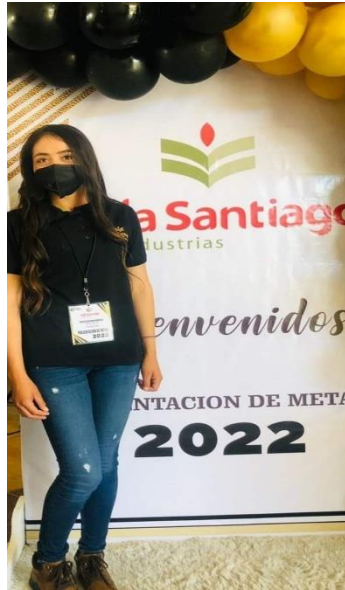
Figura 3. Evento de presentación de metas de producción 2023.