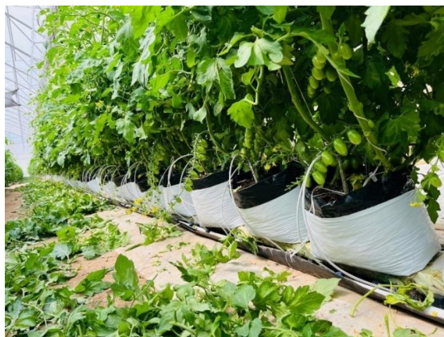
Figura 15. Primer deshoje 30 después del trasplante.

El deshoje juega un papel muy importante durante todo el ciclo del cultivo primeramente se debe considerar el número de hojas a dejar en la planta, ya que el realizar deshojes muy agresivos las plantas tienden abortar flores o bien el tamaño de la fruta disminuye considerablemente, por otro lado si la cantidad de hojas que posee la planta es excesiva se corre el riesgo, de que la acumulación de hojas en la parte inferior de la planta generen un microclima que dé lugar al desarrollo de patógenos que puedan afectar el cultivo, ya que disminuye la aireación, aumenta la humedad y dificulta la entrada de luz dando las condiciones adecuadas para el desarrollo de hongos y/o bacterias, con la experiencia que tengo en la actividad, se determinó que el óptimo requerido es de 14 hojas este dato se obtuvo a través de una serie de pruebas en el transcurso de los años, se comprobó que esta cantidad de hojas son suficientes para que las plantas realicen sus funciones fisiológicas adecuadamente, manteniendo un buen calibre del fruto, facilitando las labores de cosecha, de igual forma la maduración del fruto es más uniforme, la actividad de deshoje se llevaba a cabo con la utilización de tijeras realizando cortes limpios a ras del tallo principal evitando dejar picos o lesiones en la planta las cuales podían dar lugar a puntos de infección tanto de hongos y bacterias (Figura 15).