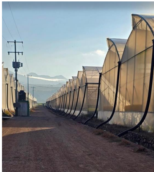
Figura 1. Agroindustrias Villa Santiago.

El presente informe detalla la experiencia profesional adquirida en la empresa Agroindustrias Villa Santiago, que se encuentra ubicada en el municipio de Compostela, Nayarit. Esta empresa se dedica a la producción de tomate grape de las variedades 'Amái' y 'Dorma', principalmente, las cuales se trabajan en hidroponía con fibra de coco, bajo condiciones de invernadero, la producción de la empresa consta de 27 ha. El producto obtenido va dirigido al mercado de exportación, para los países de Estados Unidos y Canadá (Figura 1).