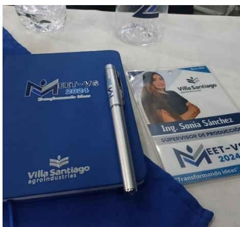
Figura 6. Evento de presentación de metas de producción 2024.