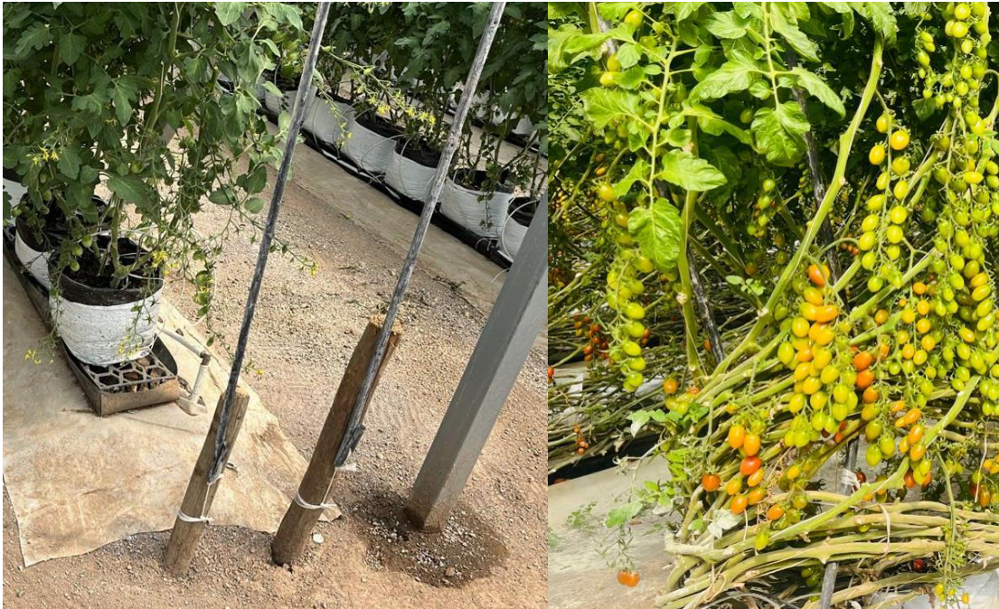
Figura 18. Estrategia de mejora para conservar la densidad de tallos.

Para su instalación se amarraron en las cabeceras desde los alambres utilizados para el tutoreo de las plantas hasta el ras del suelo (soportadas por una pequeña estaca), estas mangueras fueron sustituto de estacas de madera brindando soporte a las plantas al momento de darles la vuelta y el acomodo a los tallos. Esta estrategia también soluciono el problema de la muerte de tallos por quebradura al momento del bajado de las plantas, debido a que la manguera es más flexible y las estaca son más rígidas, con los resultados obtenidos se optó por realizar el cambio a la mayor parte de invernaderos para solucionar el segundo problema (quebradura de tallos por estación rívido; Figura 18).