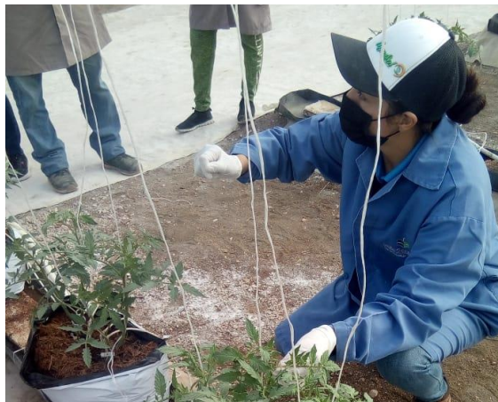
Figura 10. Retroalimentación de capacitación a personal.

El tema de liderazgo era importante para guiar y motivar a los colaboradores, esto permitía el compromiso de cada uno de ellos durante su jornada laboral, al igual mejoraba el rendimiento y la buena organización de las actividades. Para tener buena comunicación con los colaboradores era necesario explicar las actividades o retroalimentaciones de una manera clara e igual explicarles cuál era el objetivo principal de la actividad o de la responsabilidad que se le asignaba al colaborador, de tal manera que se tenía que explicar de una manera sencilla (Figura 10).