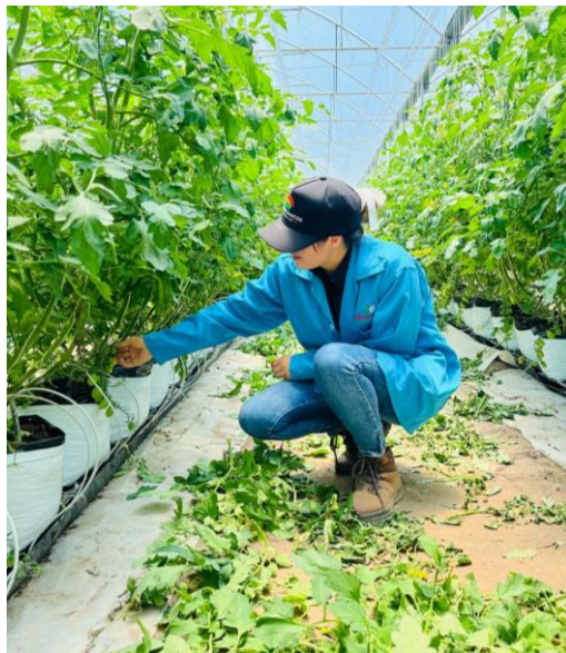
Figura 12. Supervisión de la actividad del deshoje.

Las labores culturales son un conjunto de actividades necesaria para el desarrollo adecuado de los cultivo en este caso al tratarse de un cultivo de tomates inderminado bajo invernadero se debe realizar un manejo intensivo, era necesario considerar que al hacer alguna modificación de cualquier labor influía directamente en la productividad del cultivo, por lo que se debía tener un estricto equilibrio en el balance de las plantas, con la finalidad de tener buenos resultados en el producto final, buscando un alto estándar de calidad que logrará satisfacer la necesidad del mercado. Algunas de las principales actividades que se realizan dentro del invernadero son el tutoreo, poda, deshoje, bajada de planta, poda de yema terminal, por mencionar algunas, más sin embargo se realizaban actividades secundarias como el amarre de tallos, limpieza de residuos, resultantes de actividades antes mencionadas como el deshoje y la poda (Figura 12).