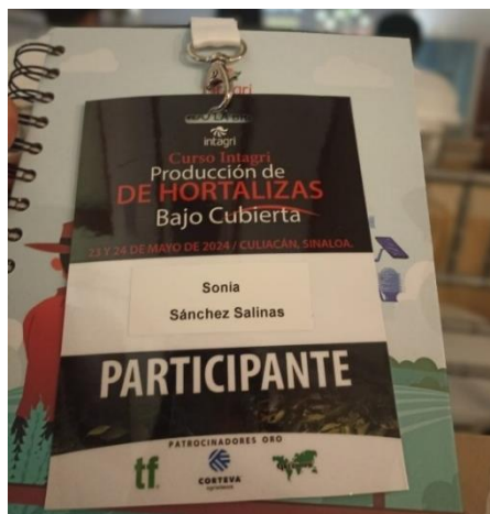
Figura 5. Capacitación de Intagri: denominado producción de hortalizas bajo cubierta.