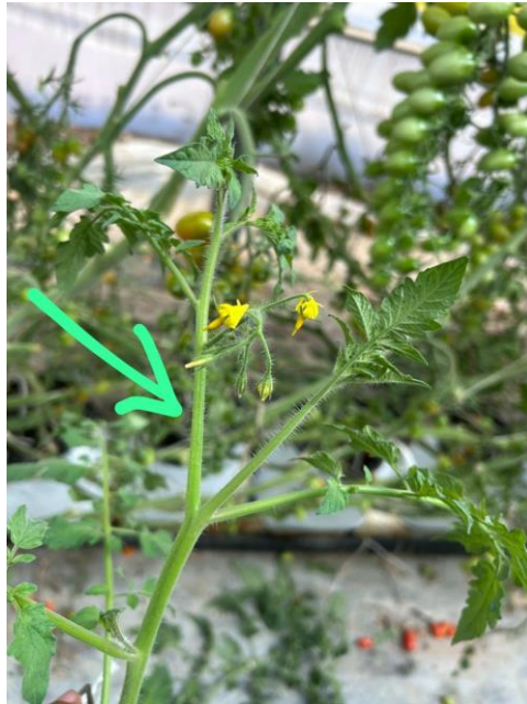
Figura 17. Poda de yema terminal.

porque seguía creciendo. Para que fuera un capado definitivo también se debía desbrotar (poda de brotes axilares), esto con el objetivo de evitar que la energía se concentrara en los brotes y por el contrario que se concentrará en los frutos. Esta actividad tenía como objetivo el determinar la planta para asegurar la calidad de los frutos que ya estaban cuajados (Figura 17).