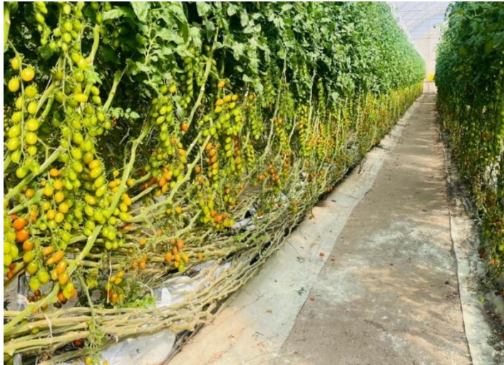
Figura 19. Deshoje de planta a 14 hojas.

acciones, se tuvo que determinar un óptimo de 14 hojas necesarias para que las plantas pudieran seguir realizando funciones fisiológicas adecuadamente, por otro lado el realizar los desojos tiene muchos beneficios para el cultivo en cuestión de sanidad y de igual manera el realizar un buen deshoje facilita significativamente la actividad de cosecha y maduración más uniforme del fruto (Figura 19).