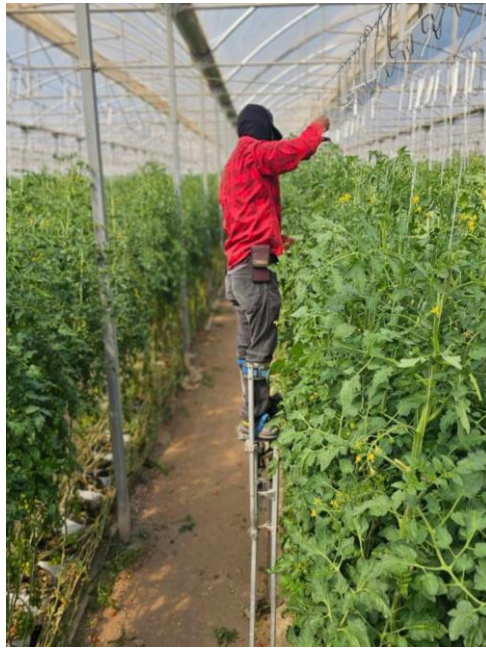
Figura 16. Bajado de planta.

Al tratarse de agricultura protegida, el sistema de manejo con tutores requiere que se realice la actividad de bajado de planta, la cual como su nombre lo indica consiste en ir bajando las plantas, para evitar que la fruta madura este demasiado alta para su cosecha, además que conforme la planta va creciendo, esta misma requiere espacio disponible, por este motivo la bajada es necesaria, dicha actividad se realiza con zancos ya que la altura de los tutores es de 2.5 m, cada planta se tutorea con un gancho de alambre el cual se embobina con rafia con una longitud de 12.0 m (Figura 16).