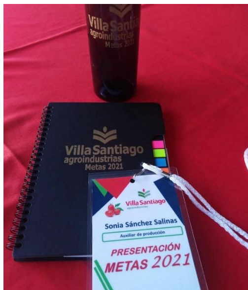
Figura 2. Evento de metas de producción 2022.