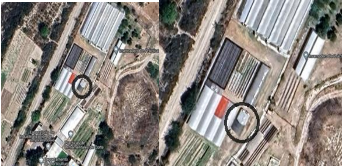
Figura 2: Instalaciones donde se implementó el experimento. UAAN-Salttillo.