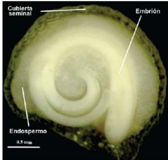
Figura 1: Anatomía de la semilla de chiltepín (Blasiak et al. , 2006)

El chiltepín presenta un bajo porcentaje de germinación aun cuando sus semillas están completamente maduras y las condiciones ambientales son óptimas, debido a un fenómeno conocido como dormancia fisiológica. Esta característica representa una de las principales limitantes para su aprovechamiento comercial, ya que la latencia de la semilla provoca que, en condiciones naturales, la germinación sea extremadamente baja, generalmente menor al 5% (Brondo et al. , 2020; Rodríguez et al. , 2003).