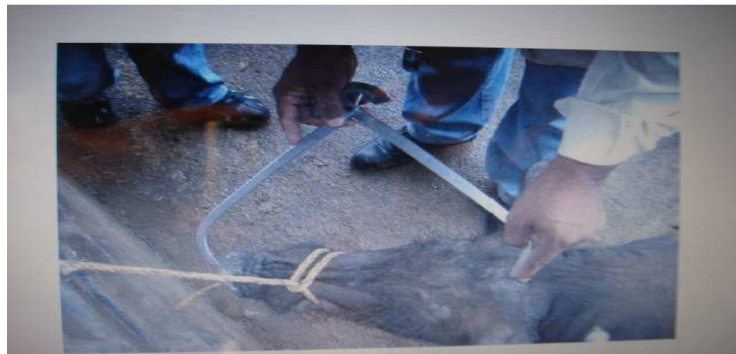
Figura 8. Medición de longitud de la cabeza

Longitud de la cabeza (LCZ): desde la protuberancia occipital extrema hasta la Punta del hocico. (fig. 8).