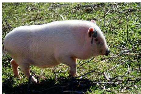
Figura 5. Cerdo Cuino Mexicano

Se asume que este cerdo (figura 5) también fue traído por los españoles o que venía en la Nao China que llegaba a los puertos de Acapulco, Guerrero y San Blas, Nayarit; lo que si es cierto y ha sido confirmado a través del ADN mitocondrial es que desciende del cerdo asiático (Huerta et al. , 1999).