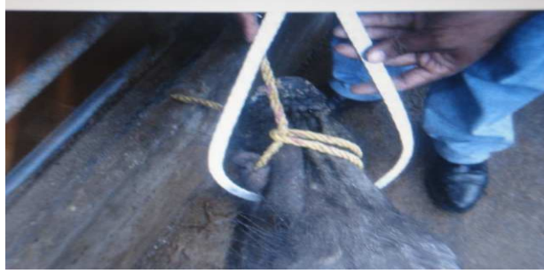
Figura 11. Medición de anchura del hocico

Longitud de la grupa (LGR): desde la tuberosidad iliaca externa (punta del anca) hasta la punta de la nalga. (fig.12)