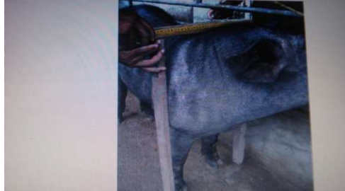
Figura 19. Medición Del diámetro bicostal

Diámetro bicostal (DBC): distancia entre ambos planos costales, tomando como referencia los límites de la región costal con los del miembro anterior. (fig.19)