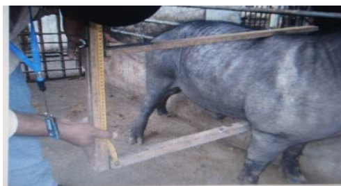
Figura 18. Medición dl diámetro dorsoesternal

Diámetro dorso esternal (DDE): distancia existente entre el punto de mayor declive de la cruz y el punto de mayor curvatura del esternón. (fig.18)