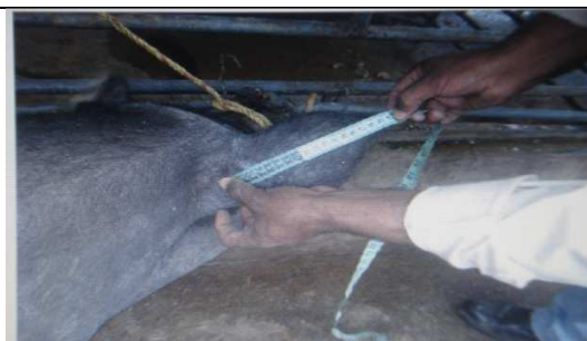
Figura 22. Medición de longitud de la oreja (Fuente: Hurtado et al. , 2007)

Longitud de la oreja (LO): tomada desde la punta extrema de la oreja hasta la base de inserción con la cabeza (fig.22)