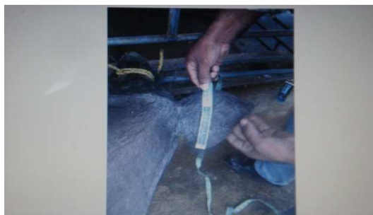
Figura 23. Medición de anchura de la oreja.

Anchura de la oreja (AO): tomada desde el borde superior hasta el borde inferior, pasando por el centro de la oreja.(23)