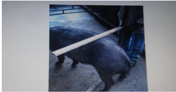
Figura 15. Medición de la alzada de la grupa

Alzada al nacimiento de la cola (ANC): distancia vertical existente entre el suelo y la base de implantación de la cola (fig.16)