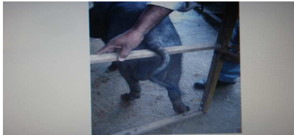
Figura 16. Medición del nacimiento de la cola

Alzada al nacimiento de la cola (ANC): distancia vertical existente entre el suelo y la base de implantación de la cola (fig.16)