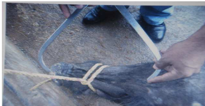
Figura 10. Medición de longitud de hocico

Longitud del hocico (cara, LH): medido desde la sutura frontonasal hasta la punta del hocico. (fig. .10)