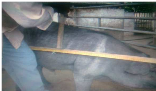
Figura 17. Medición Del diámetro longitudinal

Diámetro longitudinal (DL): distancia existente desde la articulación escápula humeral (región del encuentro) hasta la punta de la nalga (Fig. 17)