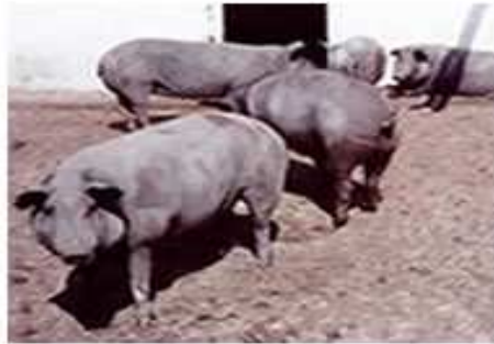
Figura 3. Cerdo Criollo Mexicano

El cerdo Criollo Mexicano (Figura 3) descende de los cerdos traídos por los españoles durante la colonización, provenientes de las Islas de Cuba, Jamaica, Santo Domingo y Puerto Rico; este ganado porcino se multiplicó con mucha rapidez de manera natural debido a que requería poco espacio y la disposición de maíz para su alimentación era barato (Mateyzanz, 1965).