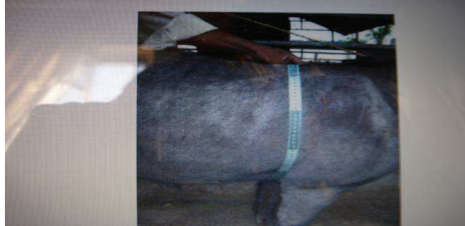
Figura 7. Medida del peso del cerdo usando cinta métrica

Longitud de la cabeza (LCZ): desde la protuberancia occipital extrema hasta la Punta del hocico. (fig. 8).