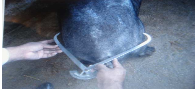
Figura 13. Medición de longitud de la grupa

Alzada a la cruz (ALC): distancia vertical medida desde el suelo hasta el punto más culminante de la cruz (fig.14)