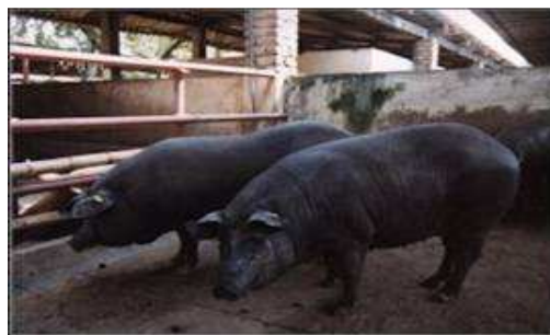
Figura 2. Cerdo Zungo colombiano

Se encuentra distribuido en la costa Norte Colombiana, se halla principalmente en el alto Sinú y Valle del Río Sinú, en el departamento de Córdoba (Cabezas, 1976),