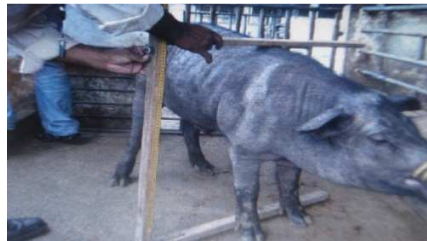
Figura 14. Medición alzada de la cruz

Alzada a la cruz (ALC): distancia vertical medida desde el suelo hasta el punto más culminante de la cruz (fig.14)