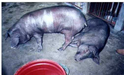
Figura 6. Cerdo casco de mula

Este tipo de cerdo (figura 6) tiene la característica de casco fundido; es un animal de tamaño mediano, piel negra, pelaje rojo, anca caída, patas fuertes y cortas, es un cerdo rústico y prolífico con gran capacidad de adaptarse a toda clase de climas, principalmente a los cálidos y húmedos (Moreno, 2002; Sabogal, 1982; Sabogal, 1989).