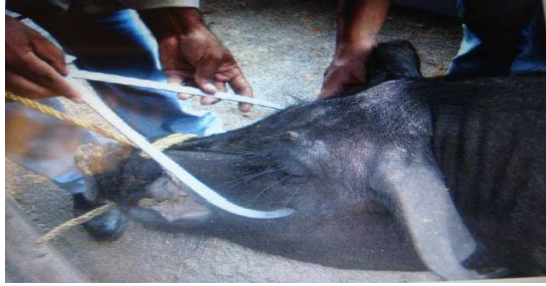
Figura 9. Medida de anchura de la cabeza

Longitud del hocico (cara, LH): medido desde la sutura frontonasal hasta la punta del hocico. (fig. .10)