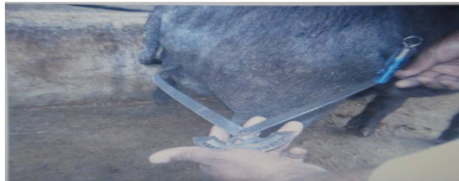
Figura 12. Medición de longitud de la grupa

Longitud de la grupa (LGR): desde la tuberosidad iliaca externa (punta del anca) hasta la punta de la nalga. (fig.12)