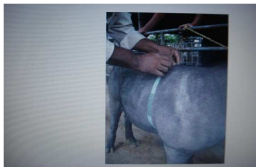
Figura 20. Medición del perímetro torácico

Perímetro torácico (PTO): es la medida del contorno del tórax, desde la parte más declive de la base de la cruz, pasando por la base ventral del esternón y volviendo a la base de la cruz, formando un círculo recto alrededor de los planos costales. (fig.20)