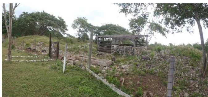
Figura 1. Chiquero rustico para el manejo de cerdos criollos en América Latina

El cerdo criollo de América Latina, pertenece a una población muy heterogénea que ha subsistido, de manera natural, a variadas condiciones ecológicas (figura 1), limitaciones nutricionales y factores infecciosos. Condiciones que lo hacen un animal rústico y resistente y que permiten considerarlo un reservorio genético capaz de enriquecer y refrescar (en un futuro) el germoplasma comercial del cerdo (Hurtado, s/f).