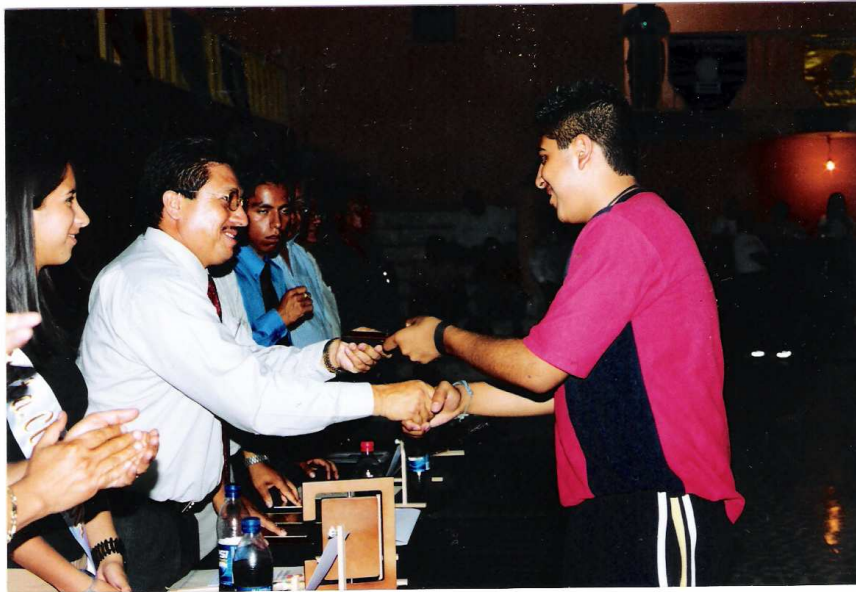
FIG. NO. 8 DISCURSO OFICIAL DE ENTREGA DE DOCUMENTOS DE LA XIX GENERACIÓN DE ALUMNOS.