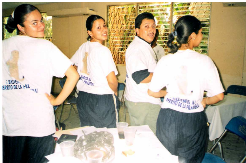
FIG. NO. 4 PROCESO DE CAPTACIÓN DE ALUMNOS “EXPORIENTA 2005”