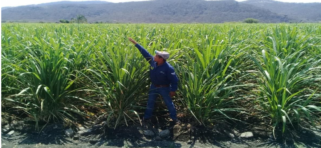
Figura 2.2 Cultivo de la caña en ciclo de plantilla, Chinameca Morelos.

México es el sexto productor mundial de caña de azúcar, con más de 55 millones de toneladas anuales. Los estados de Veracruz, Jalisco y San Luis Potosí son los principales productores de esta planta, a la que se destinan más de 826 mil hectáreas para su cultivo en territorio mexicano, (figura 2.2). SAGARPA, (2013)