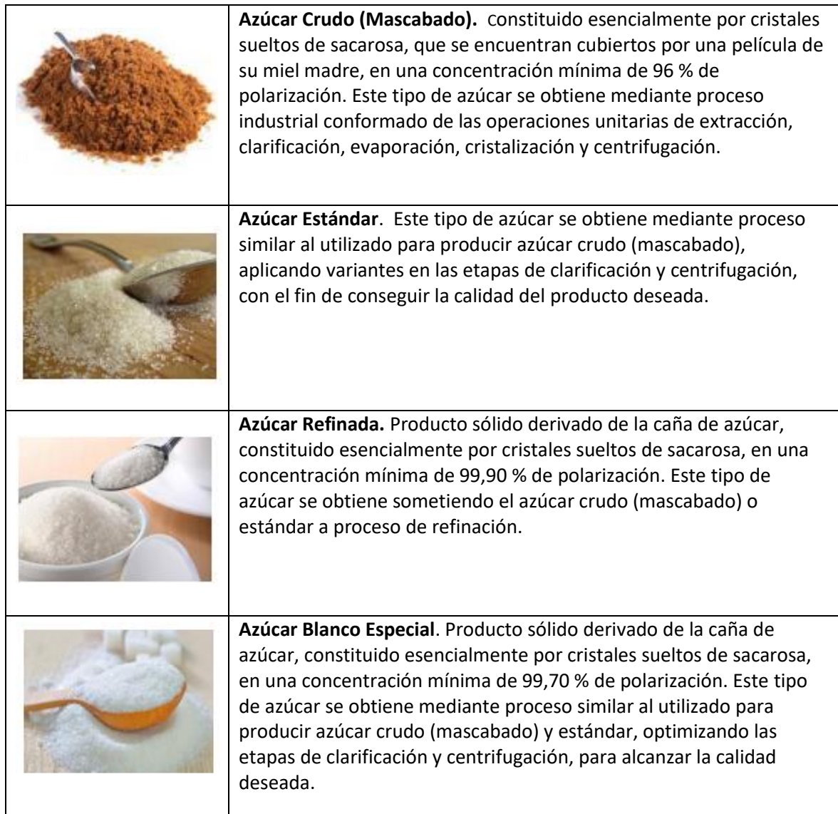
Cuadro 3.1 Tipos de azúcar en el mercado