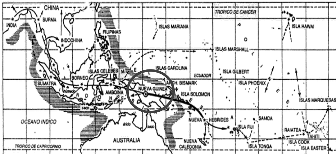
Figura 2.1 Origen de la Caña de Azúcar

Desde entonces, el cultivo de la caña de azúcar se extendió a casi todas las regiones tropicales y subtropicales. En los viajes de Cristóbal Colón a América la trasladaron a las islas del Caribe y de ahí pasó a la parte continental americana, particularmente a la zona tropical.