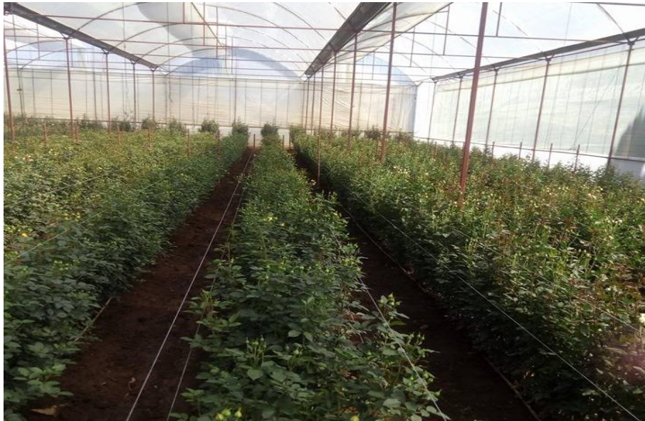
Imagen 4. Cultivo de mini rosa bajo condiciones de invernadero.

Los pasillos laterales deberán ser de aproximadamente 80 cm a 1m, en este pasillo es donde el personal pasa con su cosechador a recoger la flor y se aplica la fumigación, es importante considerar una buen espacio para que la recolección de la flor se haga de la mejor manera, de lo contrario se vería afectado el producto (flor cortada), al no tener un buen espacio para su recolección.