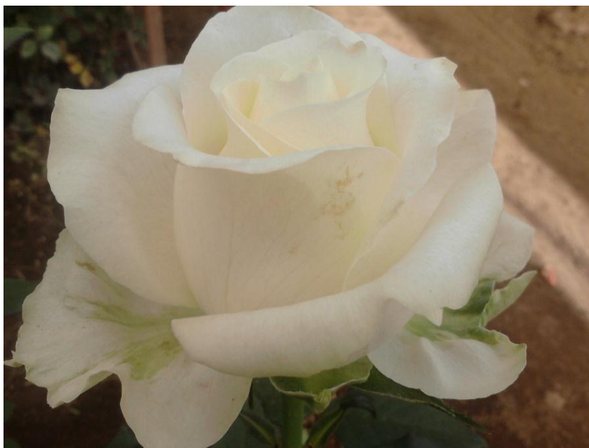
Imagen 11. Botón de rosa variedad Avelance con daño en pétalo por trips.

Las picaduras por posturas, donde la hembra al realizar su ovoposición causa lesiones (agallas, punteaduras o abultamientos) en el tejido vegetal en donde incrusta el huevo. Si el órgano en el que realiza la postura se encuentra en fase de crecimiento se produce una pequeña concavidad o verruga prominente que hace reaccionar al tejido adyacente, observándose un manchado blanquecino. Si la postura ocurre sobre la flor, se produce una alteración en el proceso de fecundación.