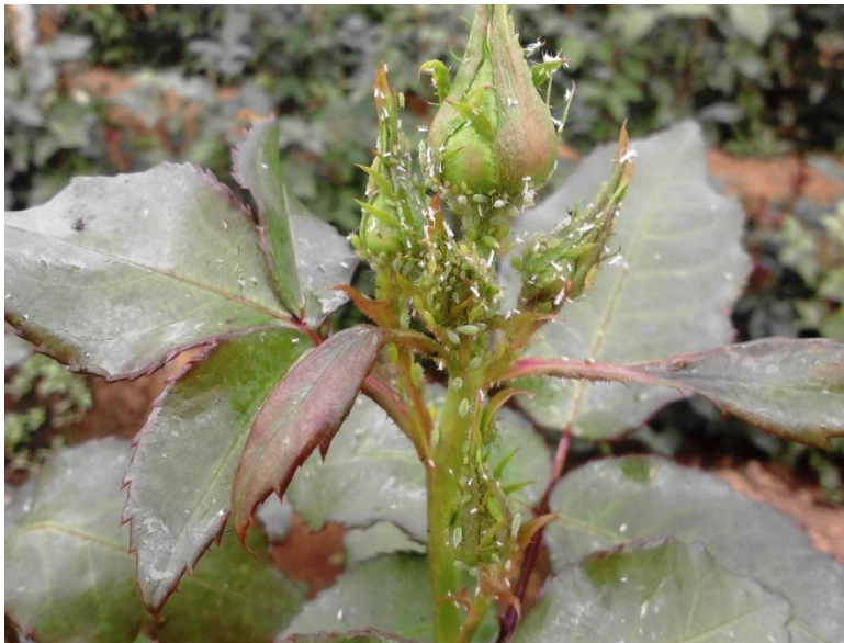
Imagen 13. Planta de estadio temprano de rosa atacada por pulgón.

La melaza segregada por esta plaga favorece el ataque del hongo que ocasiona la fumagina, que reduce la capacidad fotosintética de la planta, así como la respiración de ésta, pudiendo además depreciar la calidad de la cosecha y dificultar la penetración de los productos fitosanitarios.