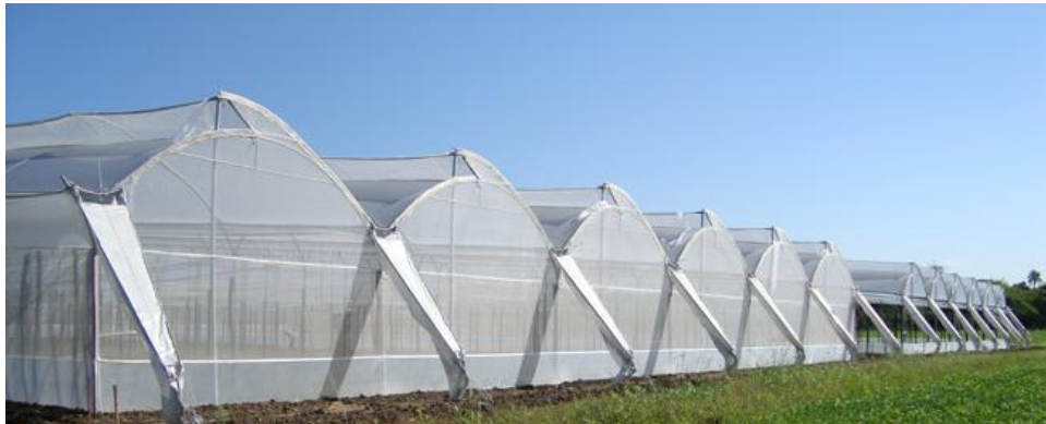
Imagen 1. Invernadero tipo capilla.

También se utiliza el tipo asimétrico, este a diferencia de los invernaderos tipo capilla y góticos, su geometría es asimétrica, siendo unos de los lados de la cubierta más inclinado que el otro.