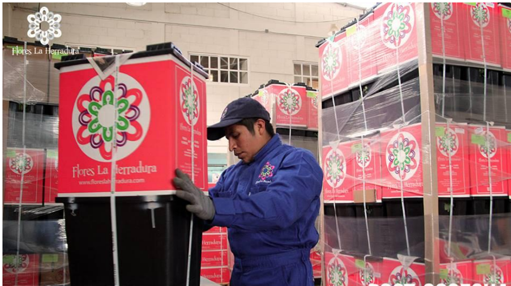
Imagen 24. Proceso de embalaje de la rosa.

Ya terminados y revisados por calidad se colocan en proconas hidratándolas con soluciones nutritivas y se meten en las cámaras de enfriamiento donde permanecerán hasta que se lleve a cabo el embarque.