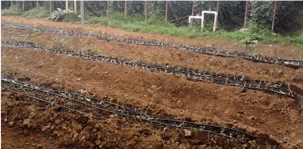
Imagen 5. Plantación nueva de portainjerto para rosal a una hilera.

ser los suficientemente amplio para poder ejecutar todas las actividades antes mencionadas, con aproximadamente de 2 a 3 metros de ancho.