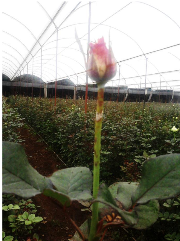
Imagen 16. Botón de rosal dañado por peronospora ( Peronospora sparsa ).

marrón claro con abundante producción de esporangioforos y esporangios, lo cual genera la apariencia vellosa característica de la enfermedad. Estas estructuras solo se producen bajo condiciones de alta humedad, llegando a ser escasas y difíciles de detectar en situaciones desfavorables para el desarrollo del patógeno. El hongo puede permanecer en dormancia en plantas infectadas o en restos de rastrojos., en el cultivo de rosa una vez que las condiciones se vuelven cálidas y secas, la enfermedad se guarda hasta el siguiente periodo frío y húmedo.