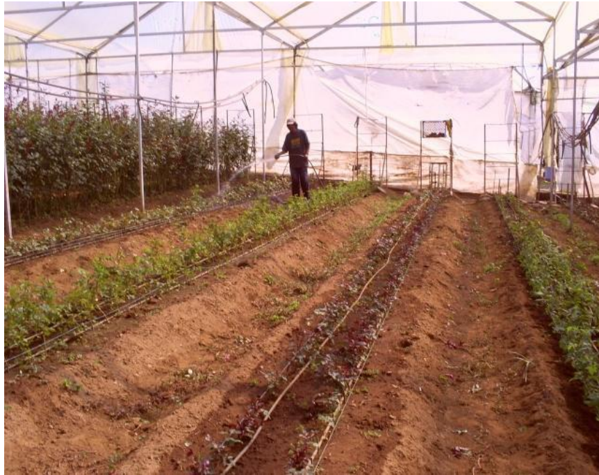
Imagen 7. Riego de tipo manual en plantación nueva de rosal.

A medida que se plante se debe hacer un riego con manguera, para evitar la deshidratación y poder dar mayor estabilidad a las capas de suelo que fueron removidas durante el manejo de la plantación. Así mismo, se debe mantener una humedad alta y aumentar los niveles de temperatura, para así provocar el crecimiento y brotación de manera uniforme y lo más rápido posible.