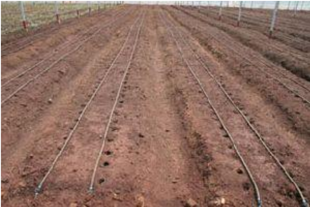
Imagen 6. Preparación de terreno para plantación de rosal a doble hilera.

Se ha demostrado que para obtener cantidad y calidad de flores cortadas, no es tan importante el sistema de plantación, si no la cantidad de plantas por m 2 . Con siete plantas por metro cuadrado de invernadero se obtiene la mejor relación entre cantidad, calidad y costos (Plantador, 1999).