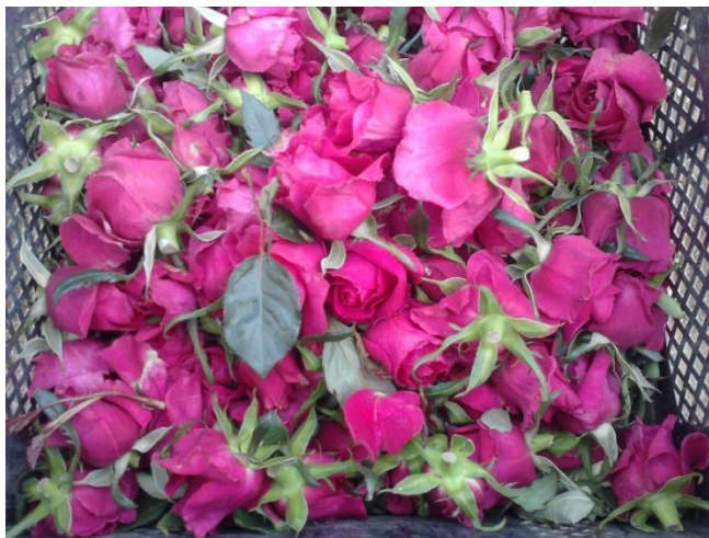
Imagen 10. Desbotonado de rosa por ataque de trips ( Frankliniella occidentalis ).

Los trips ocasionan cicatrices plateadas en hojas, tallos y flores, así como clorosis en el follaje. El crecimiento de las plantas se detiene y las flores tienden a deformarse, cuando una infestación es severa la planta puede morir.