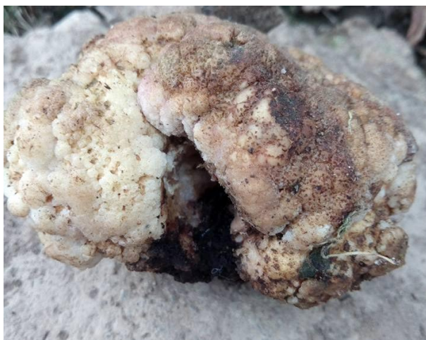
Imagen 19. Desarrollo de la enfermedad Agrobacterium tumefaciens .