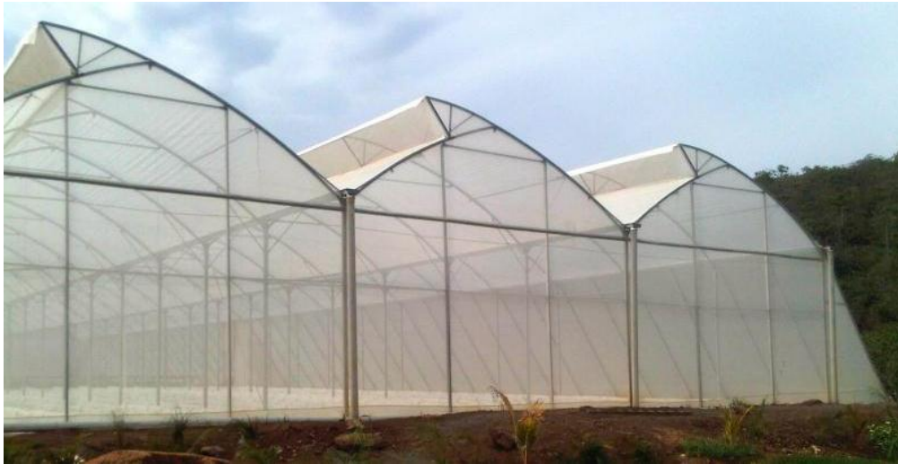
Imagen 2. Invernadero tipo asimétrico.

centro de cada uno de los arcos estructurales que corren a lo largo de todo el techo. Las aperturas permiten ventilación natural y salida del aire caliente.