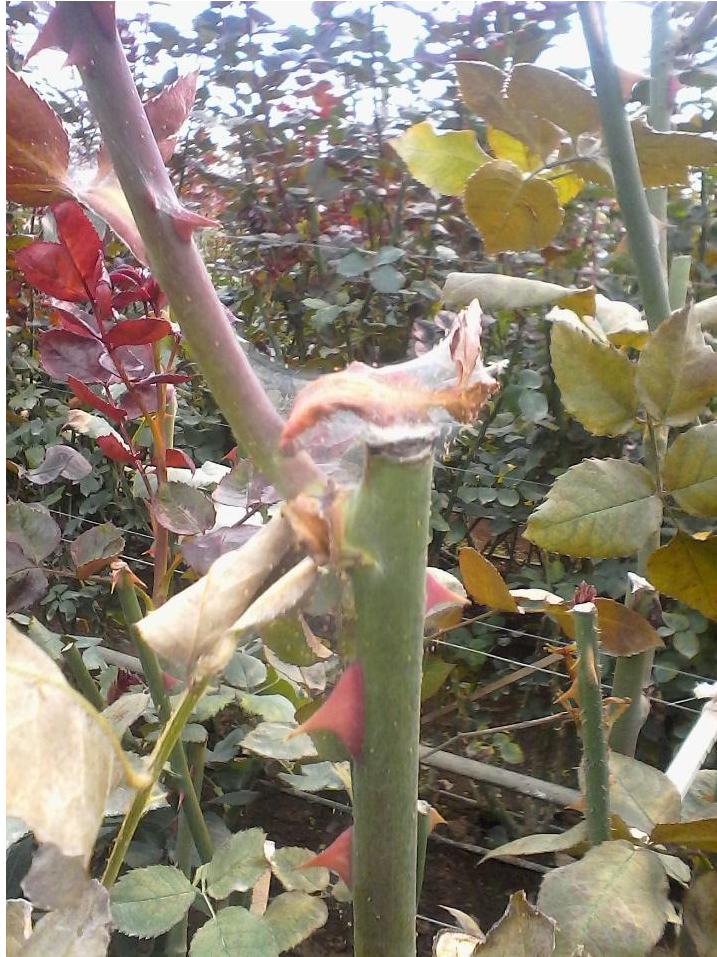
Imagen 9. Planta de rosal atacada por araña roja ( Tetranychus urticae ).

Succiona la savia de la planta, produciendo un punteado decolorado en las hojas, al principio se localiza alrededor del nervio central, para luego extenderse a toda la hoja, dando un aspecto característico amarillo-grisáceo, estos se encuentran preferentemente en el envés. Las hojas amarillean, llegando a secarse y producir una defoliación, con el consiguiente debilitamiento de la planta.