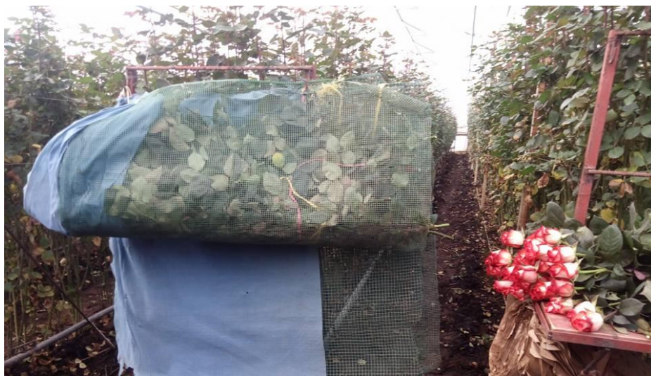
Imagen 21. Mallas contenedoras de rosa, en campo durante el corte.

El corte de flor se inicia en la mañana, y sin excepción alguna todos los días, esto se hace de manera general para todas las variedades, se da un recorrido en cada uno de los pasillos de cada cama para ejecutar el corte de las flores justo en su punto adecuado. Esto se hace con unas tijeras y un cosechador que es donde se colocara la flor ya cortada y un recipiente donde se coloca el desecho de la cosecha. Inmediatamente después del corte, se colocan 50 tallos en una maya, la cual es colocada en un recipiente o directamente en la pileta que contengan agua de hidratación.