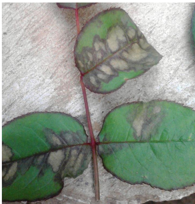
Imagen 17. Foliolo de rosa dañado por peronospora.

pueden inducir a la muerte de las ramas y a la momificación de los botones florales, o propiciando la invasión secundaria de los tejidos afectados por otros patógenos, como Botrytis spp.