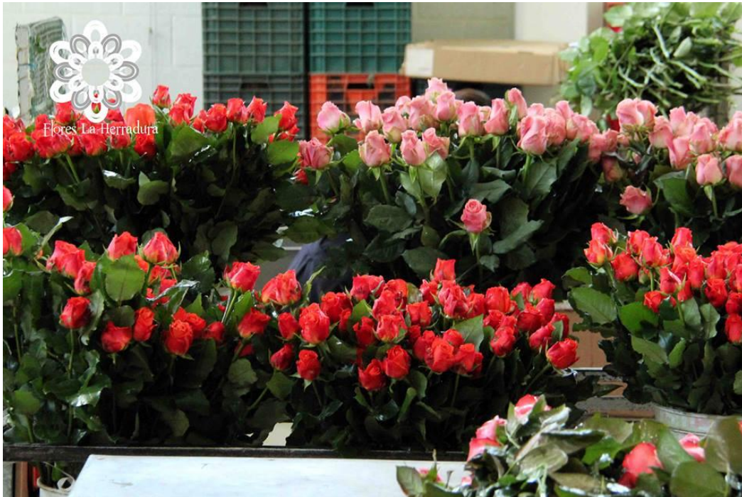
Imagen 22. Rosas en el área de empaque en hidratación.

Una vez cortadas las flores, los factores que pueden actuar en su marchites son dificultad de absorción, desplazamiento del agua por los vasos conductores, incapacidad del tejido floral para retener agua y variación de la concentración osmótica intracelular. Después de la cosecha y de estar un corto tiempo en campo se trasladan al empaque.