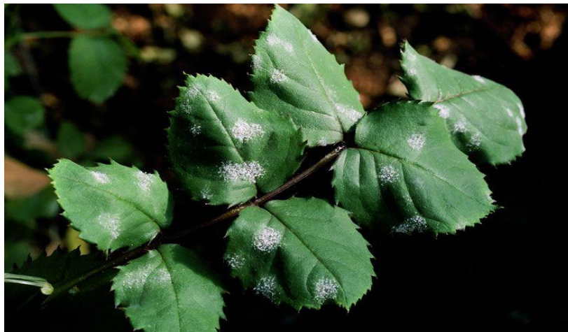
Imagen 15. Foliolo de rosal atacado por cenicilla.

El daño severo de la cenicilla reduce el crecimiento de hojas, valor estético de la plantas y causa deficiencia fotosintética, de modo que limita el desarrollo de la planta y comercialización de las flores cortadas.