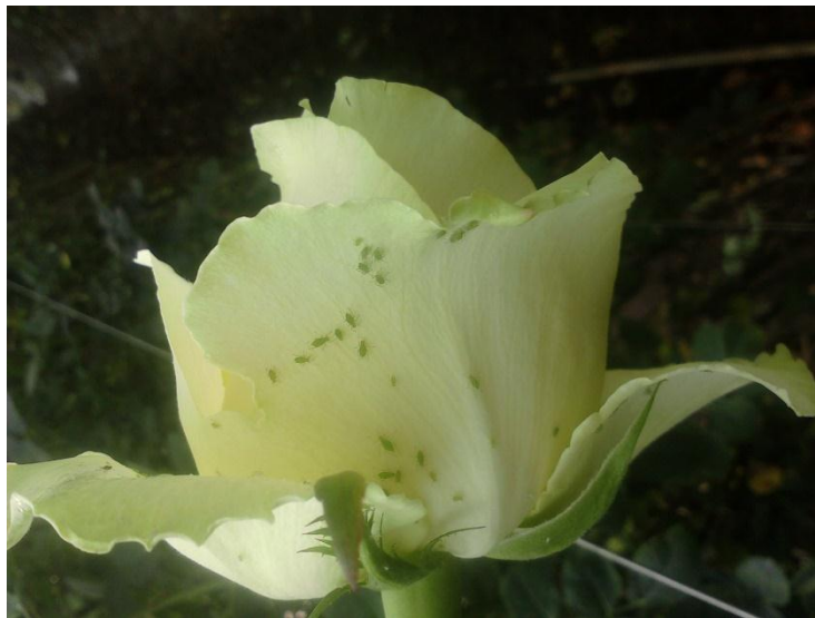
Imagen 12. Botón de rosa variedad Avelance, atacada por pulgón ( Myzus persicae ).

Al absorber la savia de las plantas provocan debilitamiento generalizado, que se manifiesta en un retraso en el crecimiento y clorosis de la planta, lo cual está en relación con la población de pulgones existente. Produce enrollamiento de hojas y brotes afectando las flores.