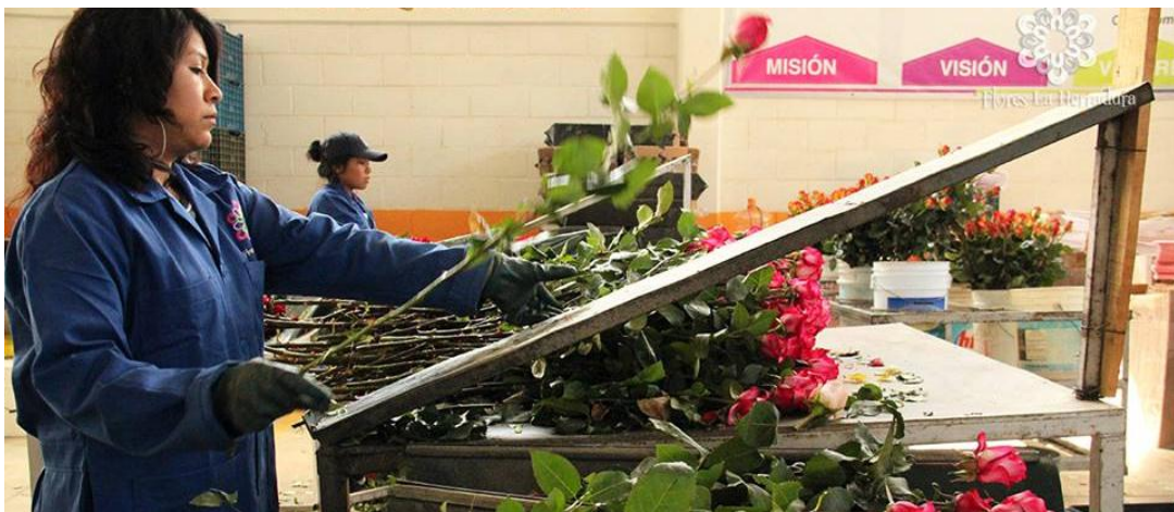
Imagen 23. Proceso de calibración de rosa en área de empaque.