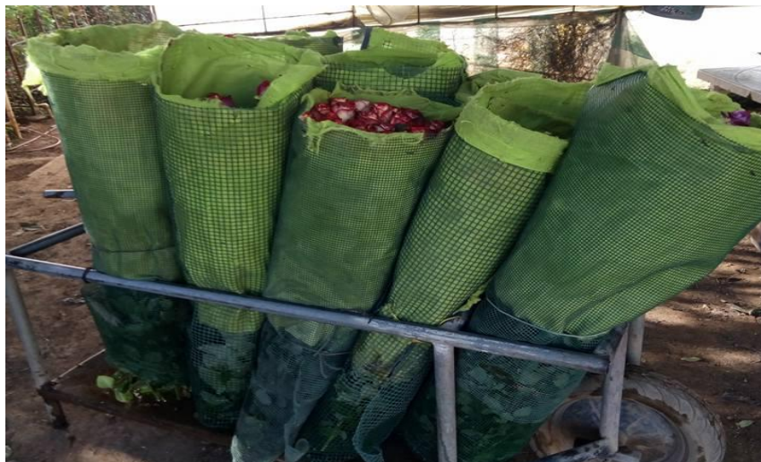
Imagen 20. Mallas de rosa transportándose al área de empaque.

Generalmente el corte de las flores se lleva a cabo en distintos estadios, dependiendo de la época de recolección. Así, en condiciones de alta luminosidad durante el verano, la mayoría de las variedades se cortan cuando los pétalos aún no se han desplegado. Sin embargo, el corte de las flores durante el invierno se realiza cuando los pétalos están más desprendidos, de lo contrario si se cortan demasiado inmaduras, las cabezas pueden marchitarse y la flor no florece, ya que los vasos conductores del pedicelo aún no están suficientemente lignificados. En todo caso, siempre se deben dejar después del corte, el tallo con dos o tres yemas que correspondan a hojas completas, si se cosecha cuando no están en su punto de corte, pueden aparecer problemas de cuello doblado, como consecuencia de una insuficiente lignificación de los tejidos vasculares del pedúnculo floral.