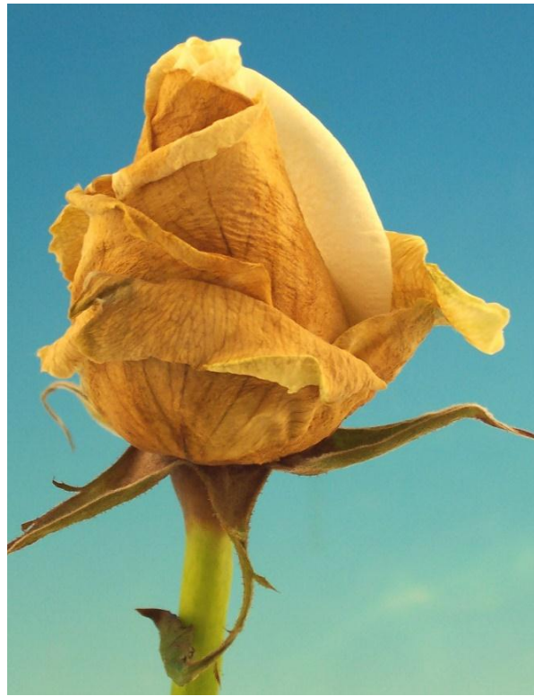
Imagen 18. Botón de rosal variedad Titanic dañado por botrytis ( Botrytis cinerea ).

En postcosecha es una de las causas más frecuentes de pérdidas de las flores cortadas, pues puede manifestarse en cualquier tipo de flor, aunque el origen de las infecciones de este hongo está en la etapa de producción, es esencial reducir las posibilidades de que se manifieste después del corte manejando ciertos parámetros en la cosecha, la enfermedad parece presentarse más en variedades de color claro.