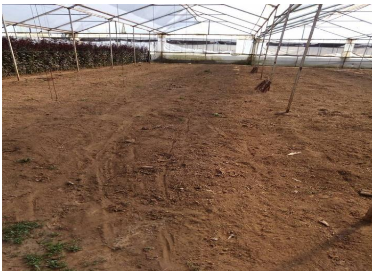
Imagen 3. Preparación de terreno para plantación de rosal.