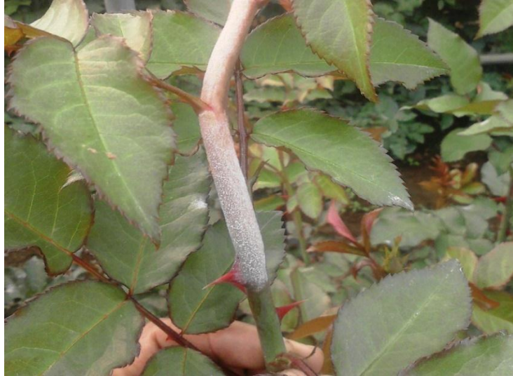
Imagen 14. Tallo tierno de rosal atacado por cenicilla ( Sphaerotheca pannosa ).

infección estos ápices se arquean o encorvan; si no se controla a tiempo la infección avanza hasta los verticilos florales, los cuales se decoloran, atrofian y finalmente mueren.