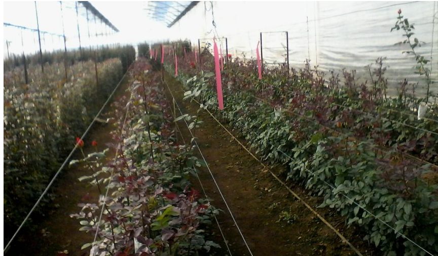
Imagen 8. Cultivo de rosal con soportes de alambre.