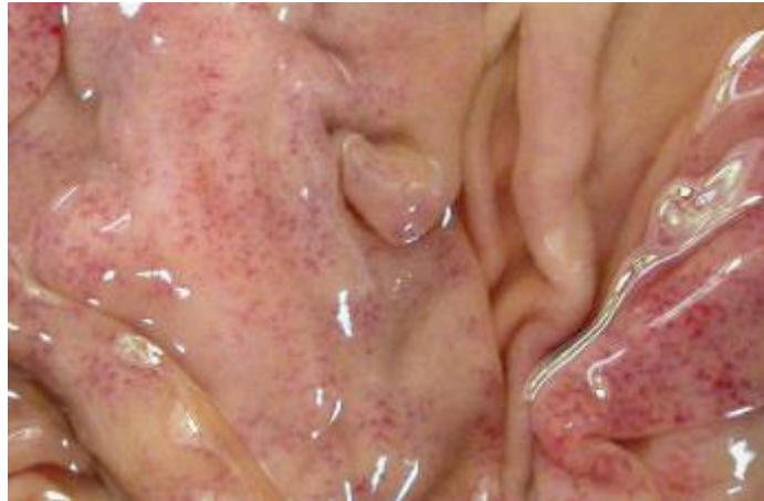
Figura 7. Mucosa gástrica de un ovino dañada por la presencia de H. contortus (Caracostantogolo, 2000).