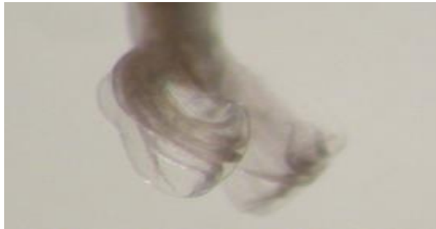
Figura 3. Haemonchus contortus macho. La bolsa copulatrix tiene lóbulos laterales alargados sustentados por radios largos y finos (Caracostantogolo, 2000).