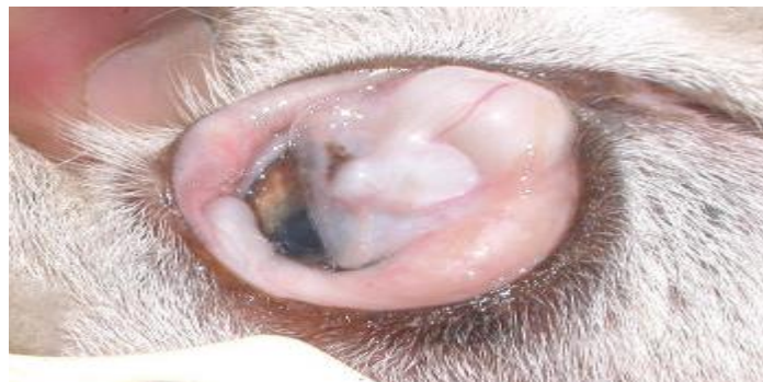
Figura 8. Anemia. Mucosa conjuntival pálida de un ovino infectado con H. contortus (Caracostantogolo, 2000).

El abomaso contiene ingesta pardo rojiza, y un gran número de gusanos que se mueven activamente si el cadáver está todavía caliente. La mucosa aparece hinchada y cubierta de pequeñas marcas rojizas, producto de las mordeduras de los parásitos. En ocasiones, se observa úlceras superficiales de bordes irregulares en las que se encuentran fijados por su extremo anterior gran número de gusanos. El intestino puede contener algunos gusanos que iban a abandonar al hospedador (Soulsby, 1987).