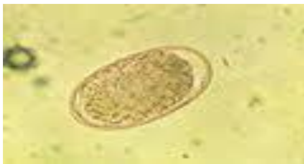
Figura 5. Huevecillo de Haemonchus contortus (Caracostantogolo, 2000).