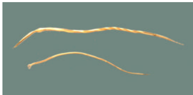
Figura 1. Haemonchus contortus Las hembras miden de 25 a 34 mm de longitud (arriba), y los machos de 19 a 22 mm (abajo), (Caracostantogolo, 2000)

Debido a sus hábitos hematófagos éste nematodo es considerado como altamente patógeno, ya que se ha observado que un parásito adulto es capaz de generar una pérdida de 0.05 ml diarios de sangre en los animales, produciéndoles anemia, hipoproteinemia e hipoalbuminemia y finalmente, en el caso de una infección aguda, la muerte (Vázquez, 2000).