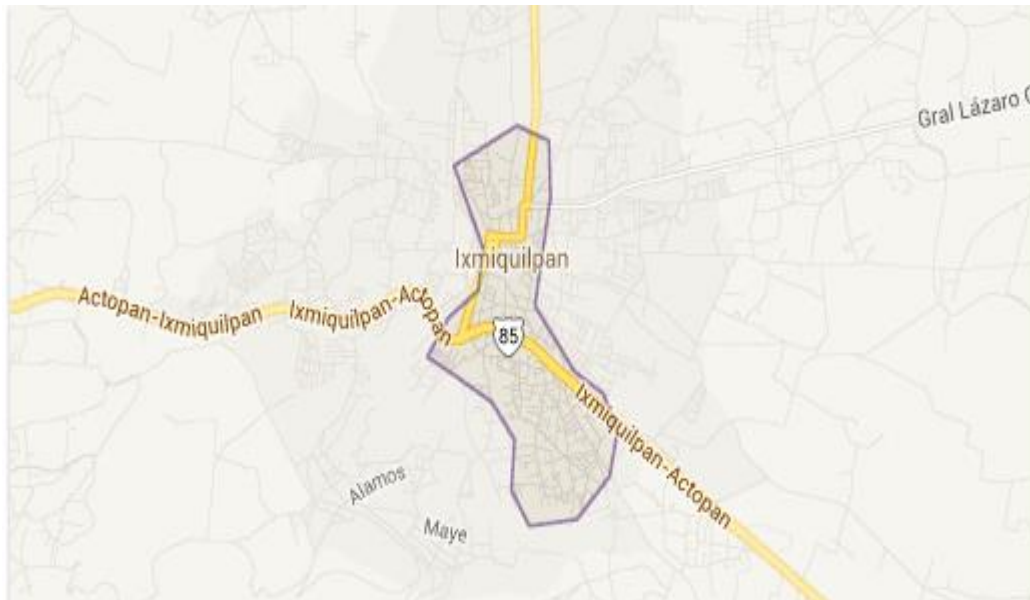
Figura 9. Mapa del Municipio de Ixmiquilpan Hidalgo (INEGI 2014)

Tiene una temperatura media de 18.5 °c, con una precipitación pluvial de 363.8 mm siendo los meses de Junio y Septiembre los de mayor precipitación y los de Febrero y Diciembre los de menor (INEGI, 2013,2014).