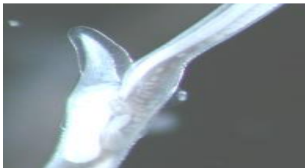
Figura 4. Haemonchus contortus hembra. La vulva está cubierta normalmente por un proceso lingüiforme (solapa vulvar), (Caracostantogolo, 2000).