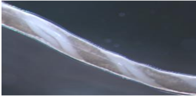
Figura 2. Haemonchus contortus hembra. Los ovarios blancos enrollados en espiral alrededor del intestino rojo le dan un aspecto rayado (Caracostantogolo, 2000)