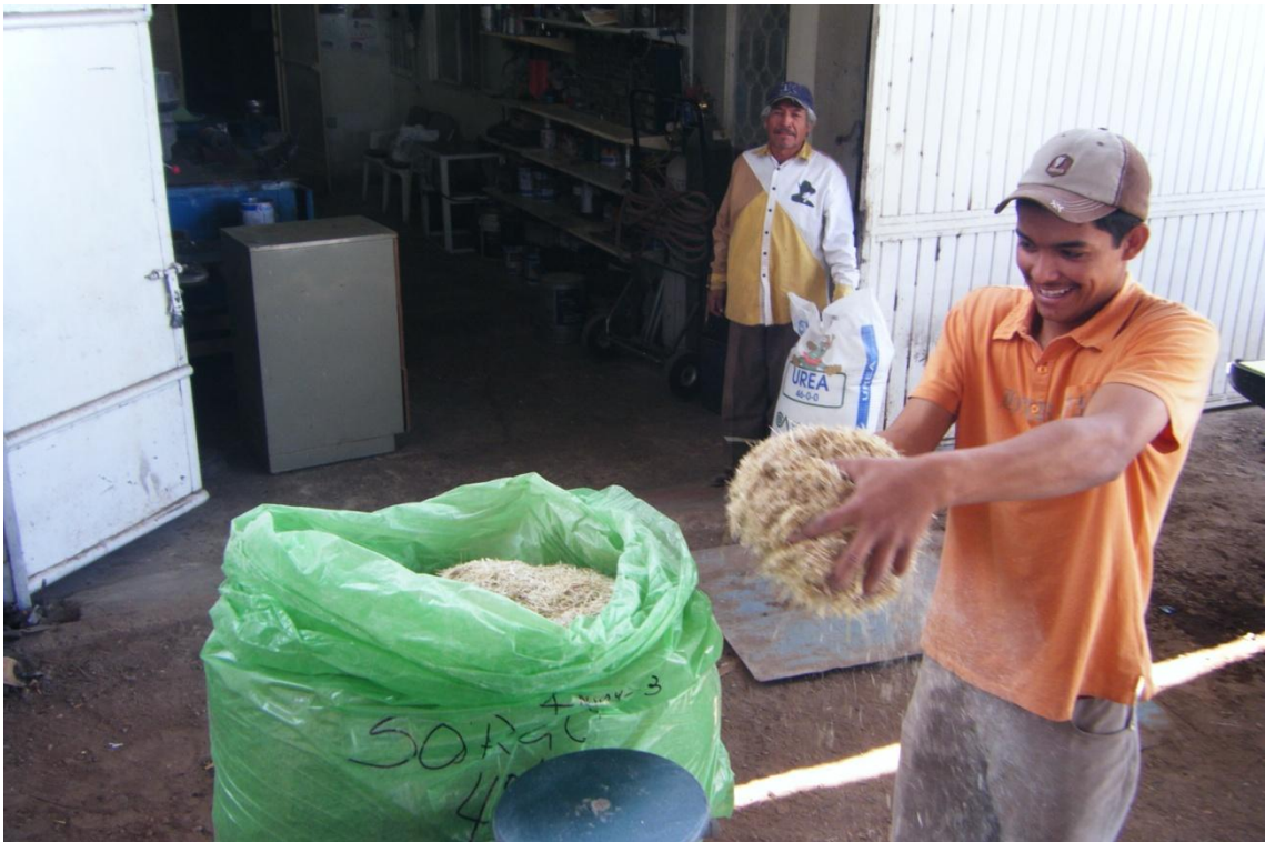
Figura: 3 pesaje del heno.