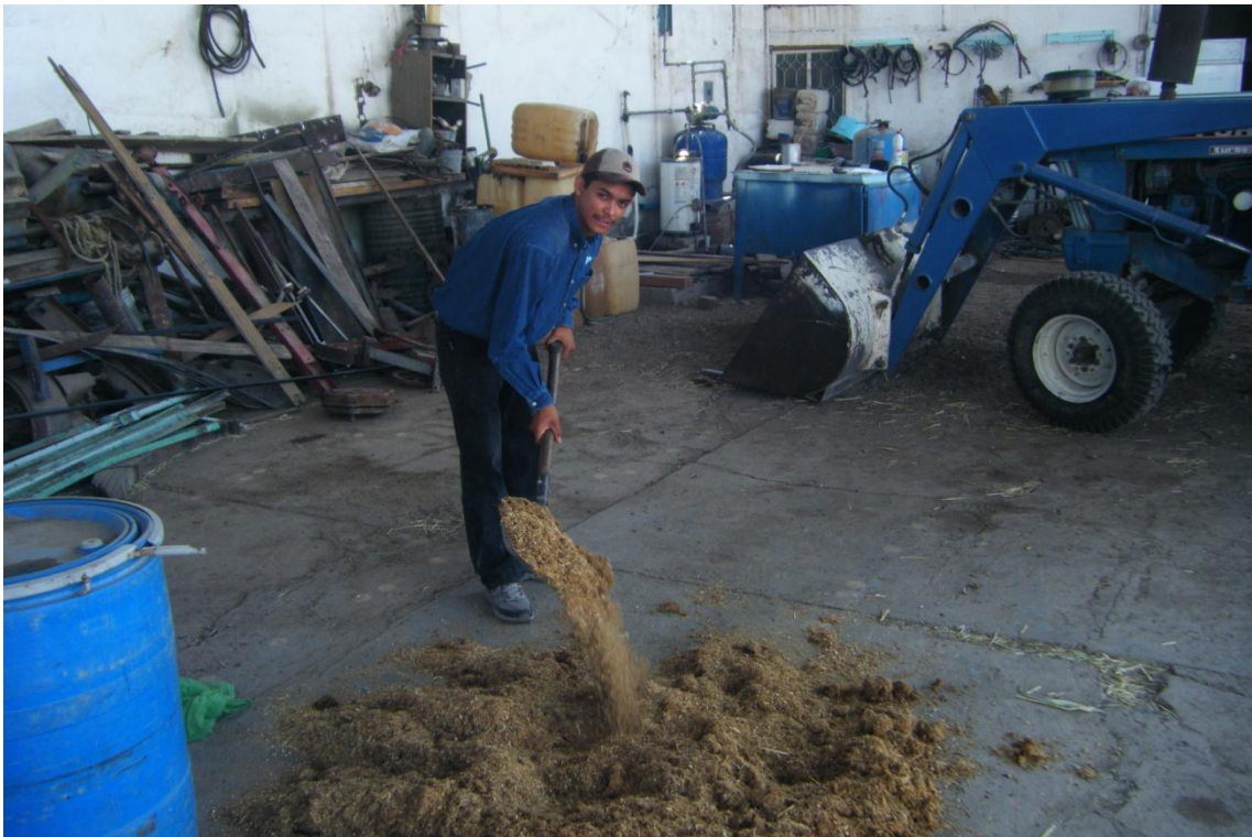
Figura: 7 Extendiendo y aireando el heno para que salga el amoniaco producido por la urea.