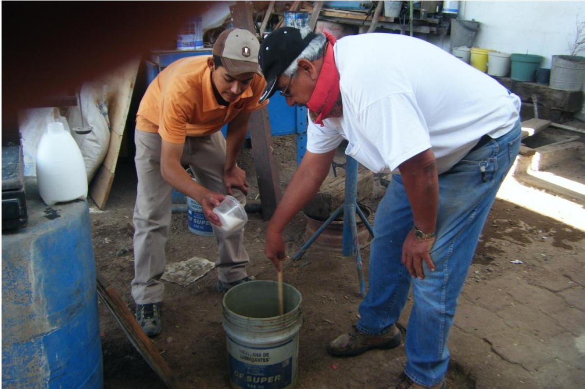
Figura: 2 disolución de la urea en agua.