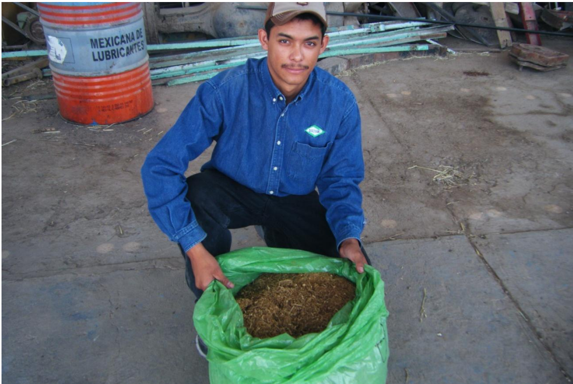
Figura: 6 apertura de las bolsas después de 3 semanas.