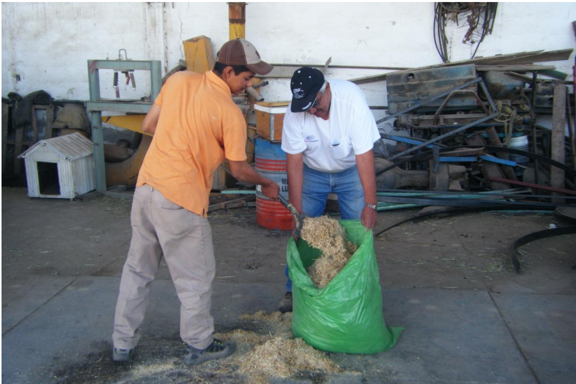
Figura: 5 empacado del heno en bolsas plásticas.