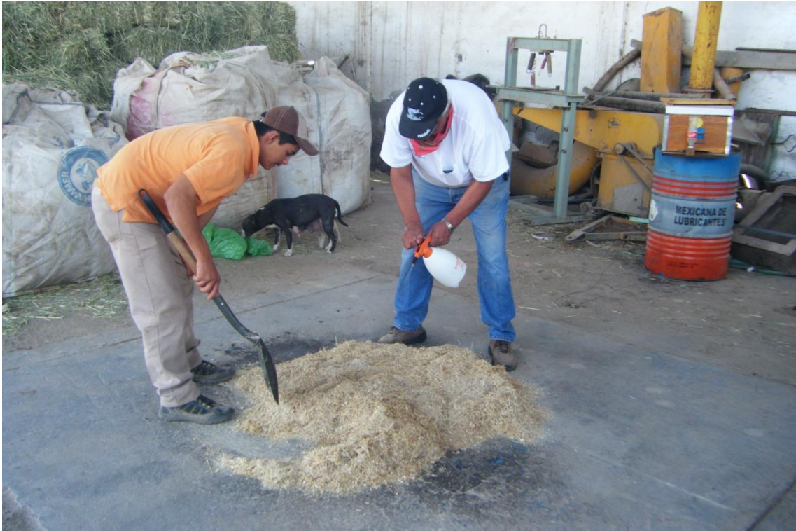
Figura: 4 asperjado de la urea hidrolizada al heno.