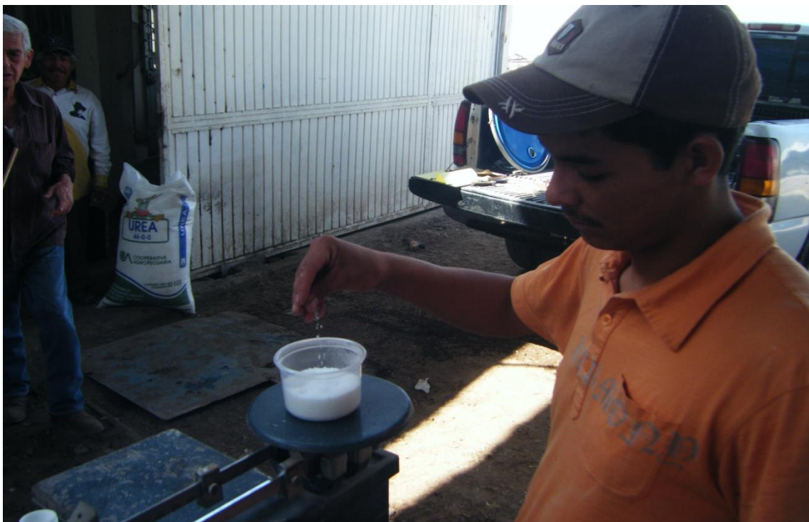
Figura: 1 pesaje de la urea.