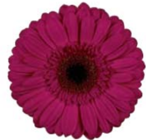
G. jamesonii 'Lieke' Photo: Preesman International B.V.