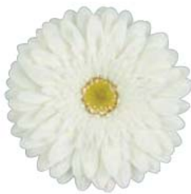
G. jamesonii 'Balance'