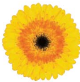
G. jamesonii 'Aventura'