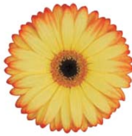
G. jamesonii 'Woodstock'