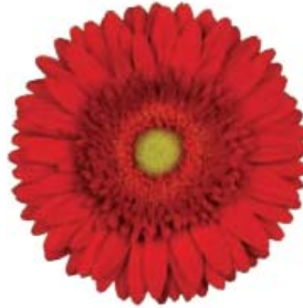
G. jamesonii 'Ceasario'