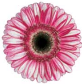
G. jamesonii 'Fiction'