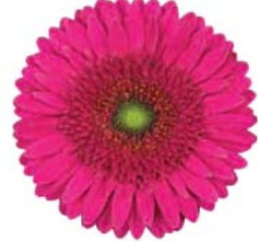
G. jamesonii 'Mermaid'