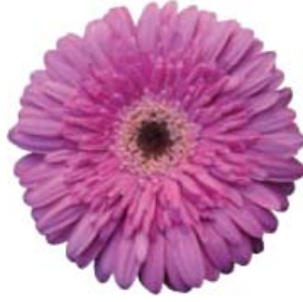
G. jamesonii 'Dinja'