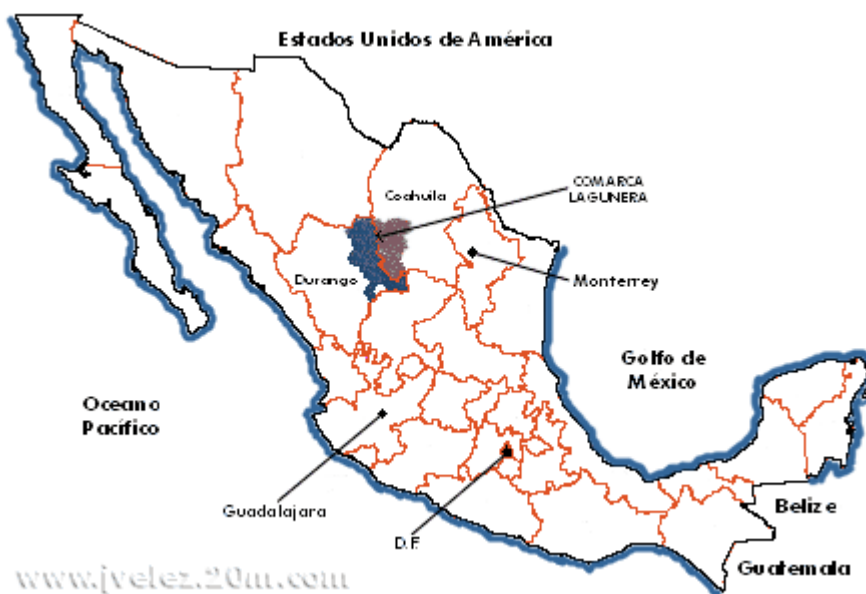
Figura 1. Ubicación de la Comarca Lagunera

El estudio se realizó en invernadero dentro de las instalaciones de la Universidad Autónoma Agraria Antonio Narro- Unidad Laguna, ubicada a 25° 33' 26" latitud norte, 103° 22' 20" longitud oeste, periférico Raúl López Sánchez km 2 y Carretera a Santa Fe S/N, Col. Valle Verde, C.P. 27059, Torreón, Coahuila. Ubicada en la región conocida como Comarca Lagunera dentro de la porción norte de México (Figura 3.1), entre las coordenadas geográficas 24° 30' y 27° latitud norte, y 102° y 104° 40" de longitud oeste, con una altitud de 1150 msnm.