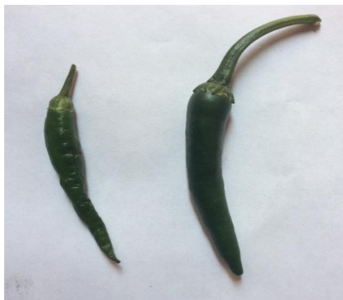
Figura 6. Diferencia chile de árbol y chile Soledad.

madurez y de color rojo brillante en su madurez con un picor similar al chile serrano. Mientras que el chile de árbol fresco es de forma alargada, nivel alto de picor, más que el chile Soledad, pericarpio delgado y estando fresco un color verde claro brillante (Figura 6).