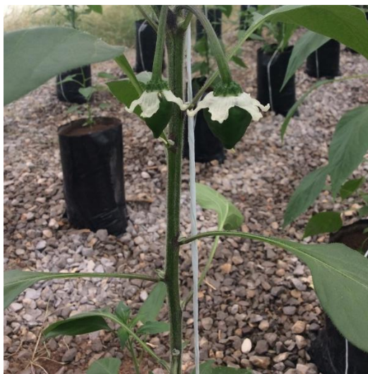
Figura 1. Tallo principal.

El tallo es delgado en donde la altura máxima del tallo principal es entre 30 cm y 60 cm (Figura 1).