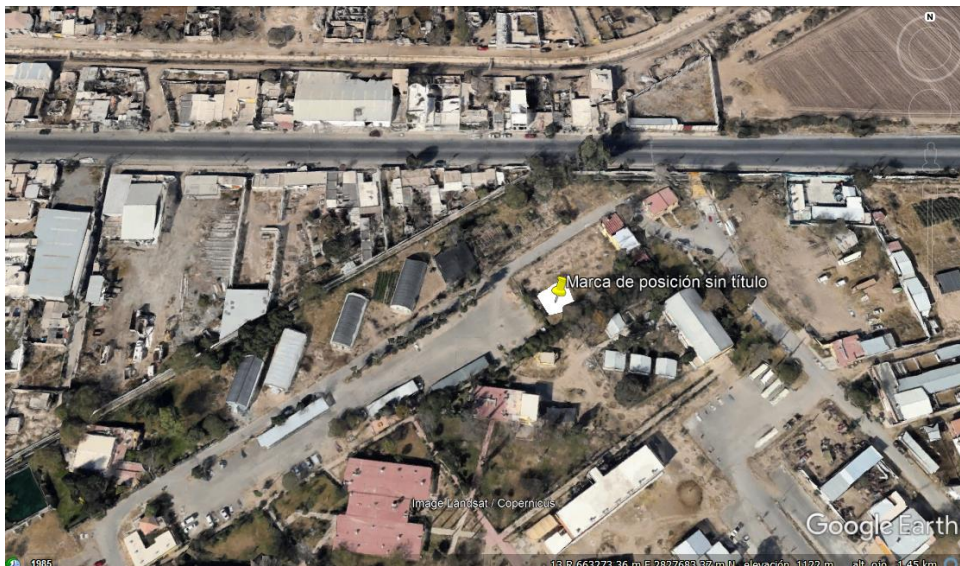
Figura 7. Ubicación del trabajo.

El estudio fue conducido en un invernadero del departamento de riego y drenaje ubicado dentro de las instalaciones de la Universidad Autónoma Agraria Antonio Narro Unidad Laguna localizada a un costado del Periférico Raúl López Sánchez s/n. Col. Valle Verde CP 27059, Torreón, Coahuila ubicada geográficamente a 25°55'52N latitud norte y 103°37'47'O longitud oeste del meridiano de Greenwich, (Figura7).