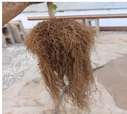
Figura 5. Raíz.