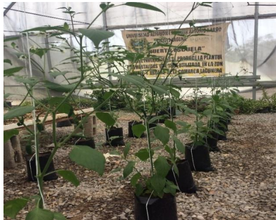
Figura 10. Medición altura de planta.

La altura de planta se determinó utilizando un flexómetro, se determinó a partir de la superficie hasta el punto de crecimiento de la planta. Los datos fueron tomados del 5 de julio al 11 de octubre del 2021.