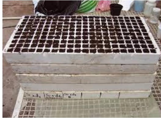
Figura 8. Preparación de charolas.