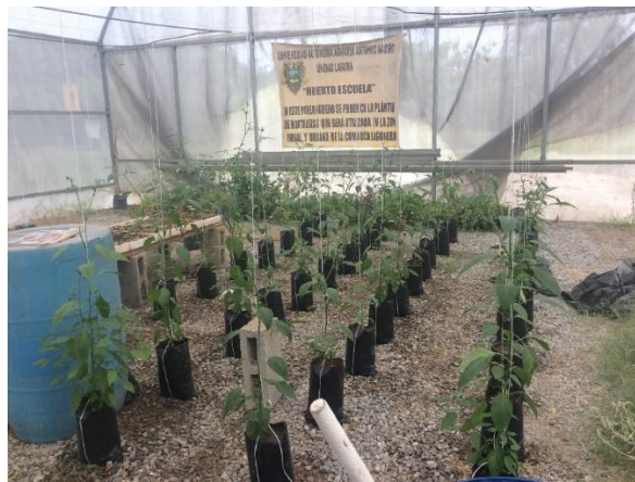
Figura 9. Tutorio a las plantas.

Durante el desarrollo vegetativo se realizó tutorio de plantas para evitar que el tallo se doblara y quebrara. Cuando las plantas alcanzaron una altura de 50 cm, se inició el tutorio colocando rafia de manera vertical desde la base de la bolsa hasta la parte alta del invernadero evitando su doblamiento o quiebre.