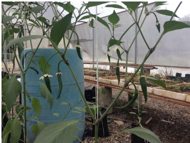
Figura 4. Fruto.