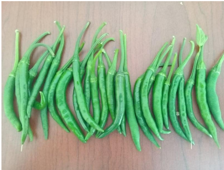
Figura 12. Frutos cosechados.

tercera, cuarta y quinta cosecha 5 frutos por planta, manteniéndose en ese promedio. Las cosechas se llevaron a cabo el día 13 de septiembre, 20 de septiembre, 4, 11 y 18 de octubre del 2021. Siendo inferior el número de frutos por planta con respecto al que produce en su lugar de origen, donde se cosechan entre 15 a 20 frutos por planta.