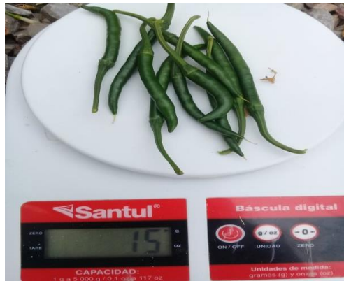
Figura 13. Peso de fruto.