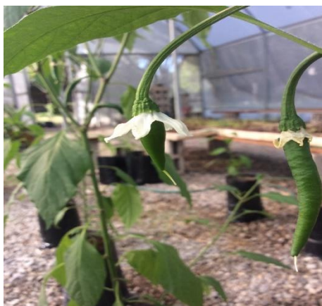
Figura 3. Flores.

Las flores son, con cáliz de 5 milímetros de largo, corola de color blanca, de 1.1 milímetros de largo (Figura 3).