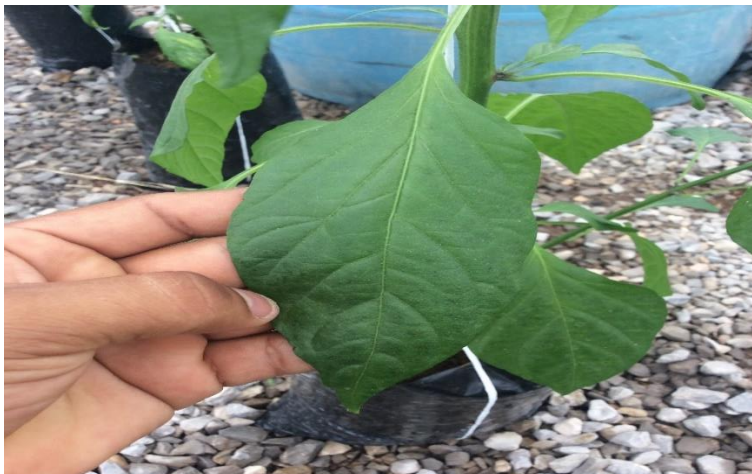
Figura 2. Hojas.