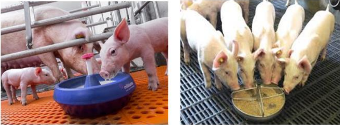
Figura. 3 manejo porcino

Tener cuidado con la higiene de los comederos, calcular el consumo del día para no desperdiciar alimento. La papilla no se puede guardar, según; universo porcino.