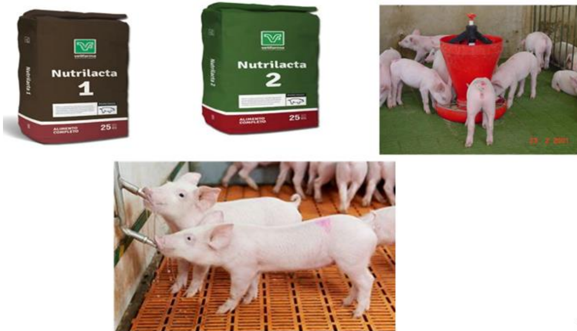
Figura. 2 manejo de alimento

El agua es un factor determinante de consumo, los lechones no tienen conocimiento del sistema de bebederos, se recomienda en los primeros 2 días recibirlos con alguna fuente de agua (comederos) hasta que se adecúen al sistema.