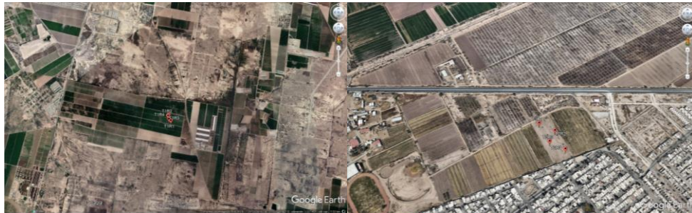
Figura 1. Ubicación geográfica de los puntos de muestreo de la alfalfa.

El presente trabajo se realizó en la Comarca Lagunera, Torreón Coahuila, México. Donde se recolectaron las muestras de alfalfa en diferentes predios. En los alrededores de la planta tratadora de aguas residuales (Rancho Alegre) y en la UAAAN-UL. Se tomó la ubicación con la ayuda de un GPS (Sistema de Posicionamiento Global) para tener localizado cada punto de muestreo que se llevó a cabo. Se presenta una imagen satelital donde se localizan la ubicación de cada muestreo.