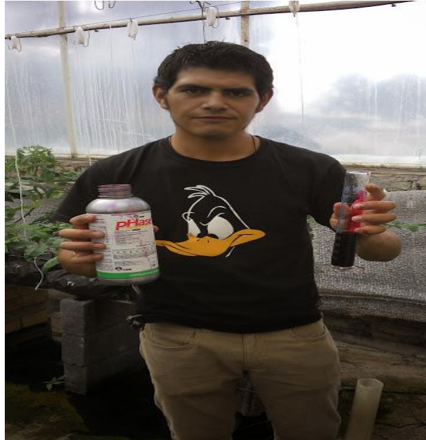
Figura 3. Empleo del buffer PHase 1 ® ■

bajar el pH y la CE, con la intención de que ayude a la asimilación de nutrientes de una forma más efectiva. Se emplearon 70 ml para 130 litros de solución nutritiva para obtener un pH de 6.6 y una CE de 3.