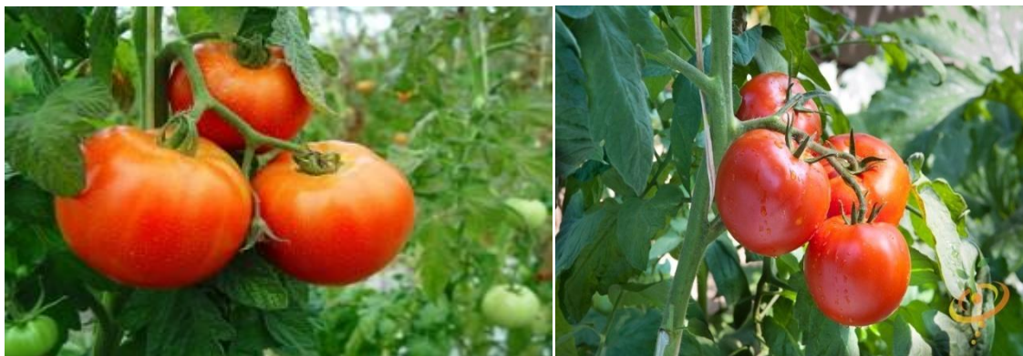
Figura 6. Madurez del tomate al momento de la cosecha.

Para el día 22 de marzo del 2014 se realizó el último corte a la planta, ya que con lo cosechado era suficiente para evaluar y lograr el objetivo planteado al inicio de la investigación. El día 28 de marzo se hizo el corte de plantas totales para la toma de variables y su posterior análisis estadístico.