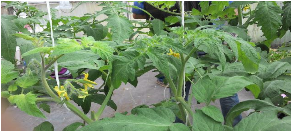
Figura 2. Situación nutricional visual del cultivo de tomate

aplicación de la solución nutritiva se notó que la planta empezaba a manifestar síntomas en la parte apical (tonalidades moradas). Para ello se adicionó un miliequivalente de H_2PO_4 por litro de agua. Se empleó fosfato monoamónico a razón de 0.13 gramos por litro de agua. Con la corrección del fósforo se notó una notable mejoría en las plantas en cuanto al color, las puntas de las hojas se tornaron de un color verde-limón indicador de una mejor nutrición. (Figura 2).