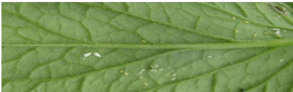
Figura 4. Presencia de mosquita blanca en las hojas del tomate

A mediados de noviembre apareció en forma moderada la plaga llamada mosquita blanca, la que se controló con aplicaciones de jabón marca Foca. Se puede apreciar en la Figura 4 la incidencia de la plaga. Un mes después se volvió a presentar dicho insecto. Se utilizó CONFIDOR a razón de 1 \text{ mL}^{-1} sobre el área foliar lo que resultó eficaz para su control.