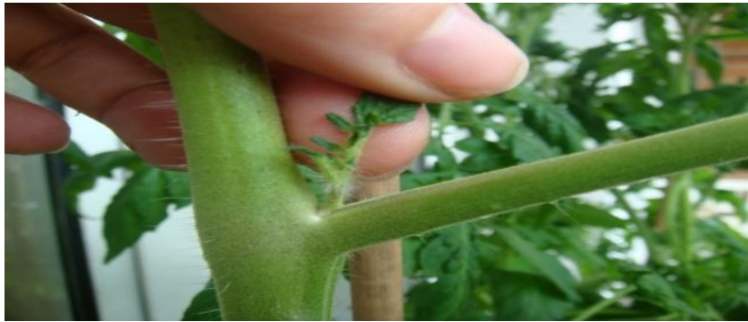
Figura 5. Poda de hojas y brotes axilares al cultivo de tomate.

Se condujo la planta a un tallo. Se manejó una densidad de 2.8 plantas por metro cuadrado. Para evitar que las plantas desarrollaran demasiada área foliar y aprovechar la entrada de luz solar se dejó una hoja abajo del racimo floral. Se eliminaron brotes axilares desde tamaño pequeño para evitar la competencia por agua, nutrientes y luz como se aprecia en la Figura 5.