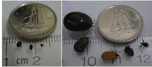
FIGURA 1 Comparación del tamaño de garrapatas con una moneda de 10 centavos. Tomada de (Ogden, et al. , 2009).

Los venados de cola blanca, Odocoileus virginianus Zimmerman , sirven como hospederos de la garrapata de pata negra Ixodes scapularis en su estado primario reproductivo, en la región oriente y norte central de Estados Unidos (Rand, et al. , 2003).