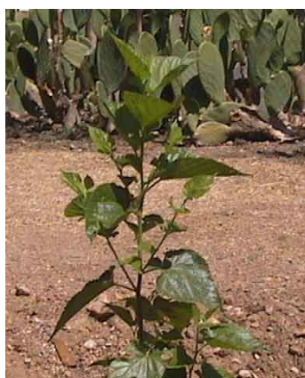
Figura 8. Siembra por semilla. (Benavides, 1995).

El método más común de propagación es por medio de estacas plantadas en forma directa (Figura 9). La longitud de las mismas no debe pasar de 25 a 40 cm. de largo y con no menos de tres yemas tomadas de ramas lignificadas. Deben enterrarse a 3 o 4 cm. de profundidad y, si el suelo no es muy compacto, no es preciso preparar el terreno antes de la siembra, siendo sólo necesario eliminar la vegetación. Las estacas no rebrotan al mismo tiempo, variando entre 4 y 35 días la aparición de las primeras hojas. En buenas condiciones de manejo las estacas pueden alcanzar más del 90% de rebrote. (Benavides, 1995).