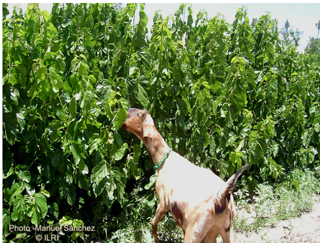
Figura 12. Parar rumiantes menores como cabras, la morera se puede suministrar en ramas, sólo las hojas o en trozos grandes. (Benavides, 1995).