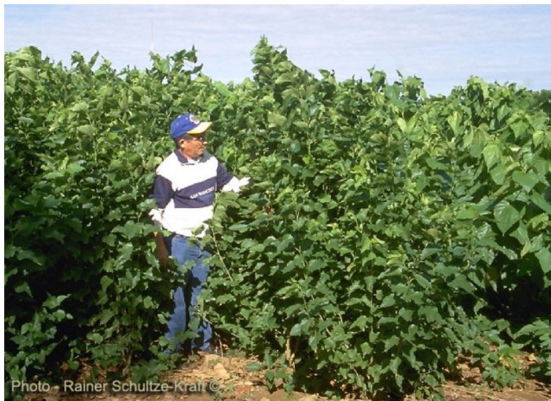
Figura 7. Producción intensiva de forraje. (Benavides, 1995).