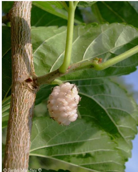
Figura 2. Morus alba . (Pizarro et al. , 1998).