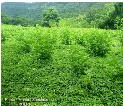
Figura 10. Asociación de Morera con leguminosas. (Benavides, 1995).

Por su gran alta capacidad de producción y por la elevada concentración de minerales en la biomasa, la Morera extrae gran cantidad de nutrimentos del suelo. (Benavides, 2002). Todos los nutrientes extraídos por la morera para su crecimiento tienen que venir del suelo o del subsuelo, pues la morera no fija nitrógeno. En cultivos puros, los fertilizantes químicos u orgánicos (abonos animales o vegetales) deben ser usados para reponer los nutrientes extraídos en el follaje para poder mantener una producción sostenible (Espinosa y Benavides, 1998). La asociación con leguminosas (Figura 10) con efectiva fijación de N por medio del rizobium puede reducir los insumos de fertilizantes y puede que sea la mejor combinación en muchas situaciones, pero aún reciclando los nutrientes contenidos en las excretas animales, fertilizantes adicionales pueden ser requeridos para obtener rendimientos máximos (Benavides et. al., 1994). Las respuestas a los fertilizantes nitrogenados han sido claramente demostradas, tanto en forma inorgánica como orgánica, con mejores respuestas a la primera (Tabla 5). Según Kamimura et al. , (1977) el nivel de nitrógeno del suelo es el factor principal para el crecimiento de la morera.