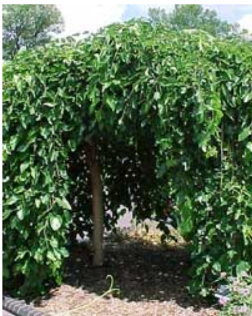
Figura 3. Morus alba 'Pendula' (Pizarro et al. , 1998).