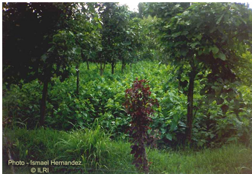
Figura 5. Morera establecida y asociada con otros árboles. (Benavides, 1995). Se puede establecer como plantación compacta, asociada con árboles leguminosos y como cerca y barrera viva. (Figura 5) (Benavides, 1995).