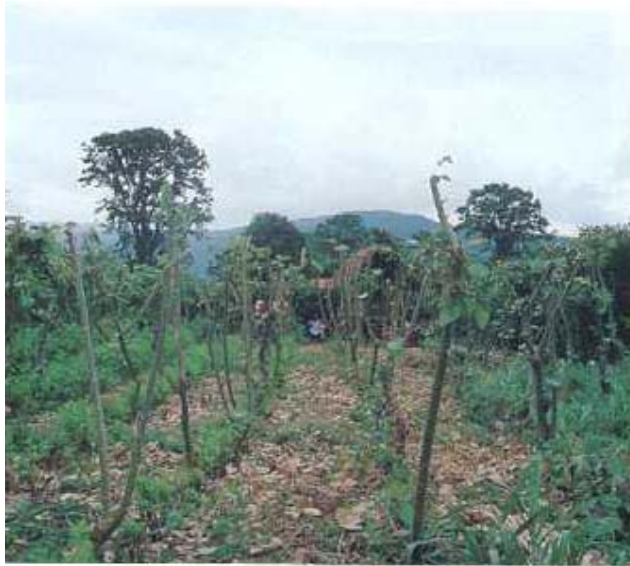
Figura 9. Siembra por estacas. (Benavides, 1995).