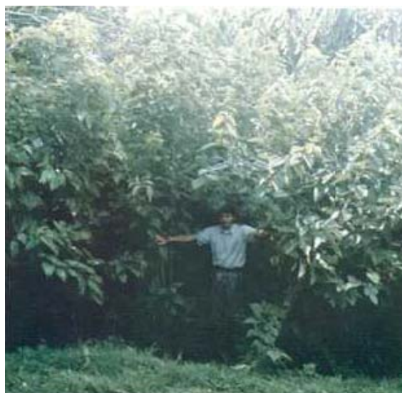
Figura 11. El uso de follaje de morera como suplemento al pasto, permite obtener altas ganancias de peso en bovinos. (González et al. , 1996).

Con bovinos se han obtenido ganancias de peso biológicamente atractivas al utilizar el follaje Morera como suplemento (Figura 11). En el trópico húmedo con vaquillas de reemplazo Jersey x Criollo en pastoreo y suplementadas con Morera, la ganancia de peso fue superior (610 g/an/día) a la observada al suplementar con concentrado (410 g/an/día) (Benavides, 2002).