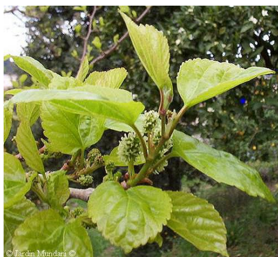
Figura 1. Hojas de Morera. (Benavides, 1995)

- Hojas simples, alternas, polimorfas, ovales, apuntadas o acuminadas, dentadas, peciolo largo. De color verde claro, brillante. (Figura 1).