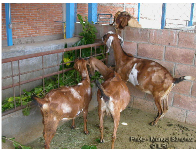
Figura 13. Parar rumiantes menores como cabras, la morera se puede suministrar en ramas, sólo las hojas o en trozos grandes. (Benavides, 1995).

En cabras lecheras, se encontraron incrementos de leche de 2,0 a 2,5 kg/an/día cuando la suplementación con Morera pasó del 1,0 al 2,6% del PV en base seca, con ligeros incrementos en los contenidos de grasa, proteína y sólidos totales de la leche. Con corderos alimentados con una dieta base de King-grass, se reportan ganancias de peso de 60, 75, 85 y 101 g/an/día cuando se