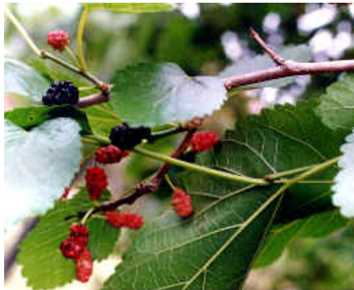
Figura 4. Morus nigra (Pizarro et al. , 1998).