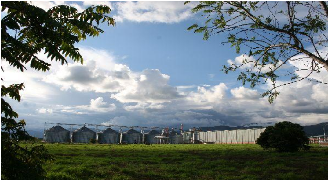
Figura 7. Almacenes de arroz

Plantas beneficiadoras de arroz palay.- Conocidas con el nombre de molinos de arroz, eran las plantas encargadas de la recepción almacenamiento y descascarillado del arroz para su posterior comercialización, teniendo estas plantas toda la infraestructura necesaria para realizar sus labores y recibir toda la producción de arroz que se cosechaba en la región de influencia de la planta. Como se puede ver en las Figuras 7, 8, 9 y 10