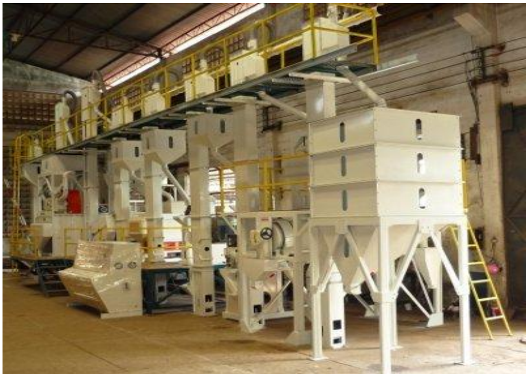
Figura 10. Equipo para descascarillar y seleccionar arroz