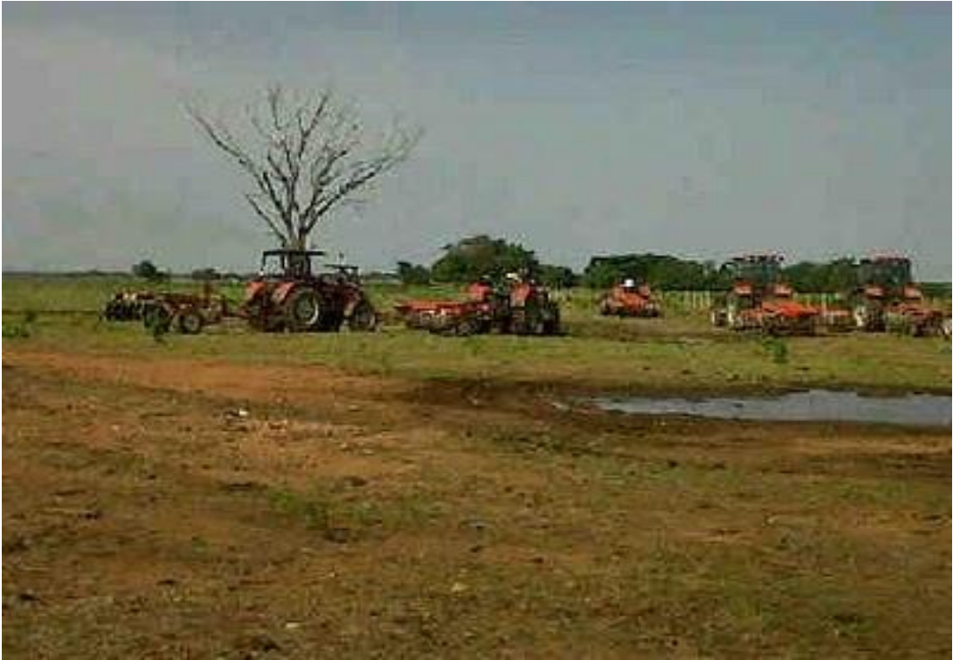
Figura 3. Maquinaria agrícola utilizada en la preparación de suelos