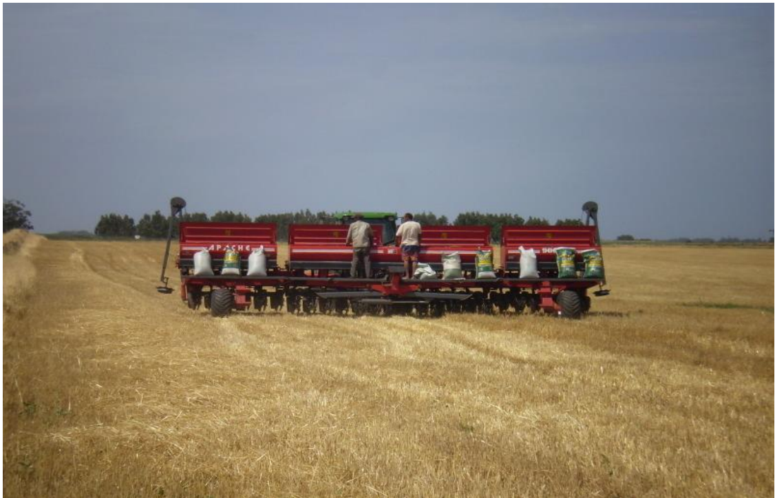
Figura 16. Tractor agrícola sembrando arroz