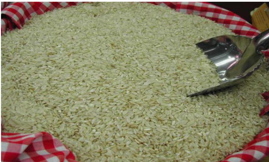
Figura 19. Arroz procesado