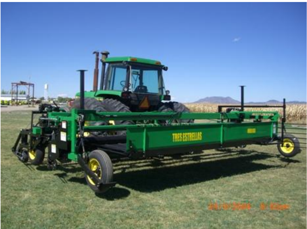
Figura 4. Tractores agrícolas utilizado en el cultivo de arroz