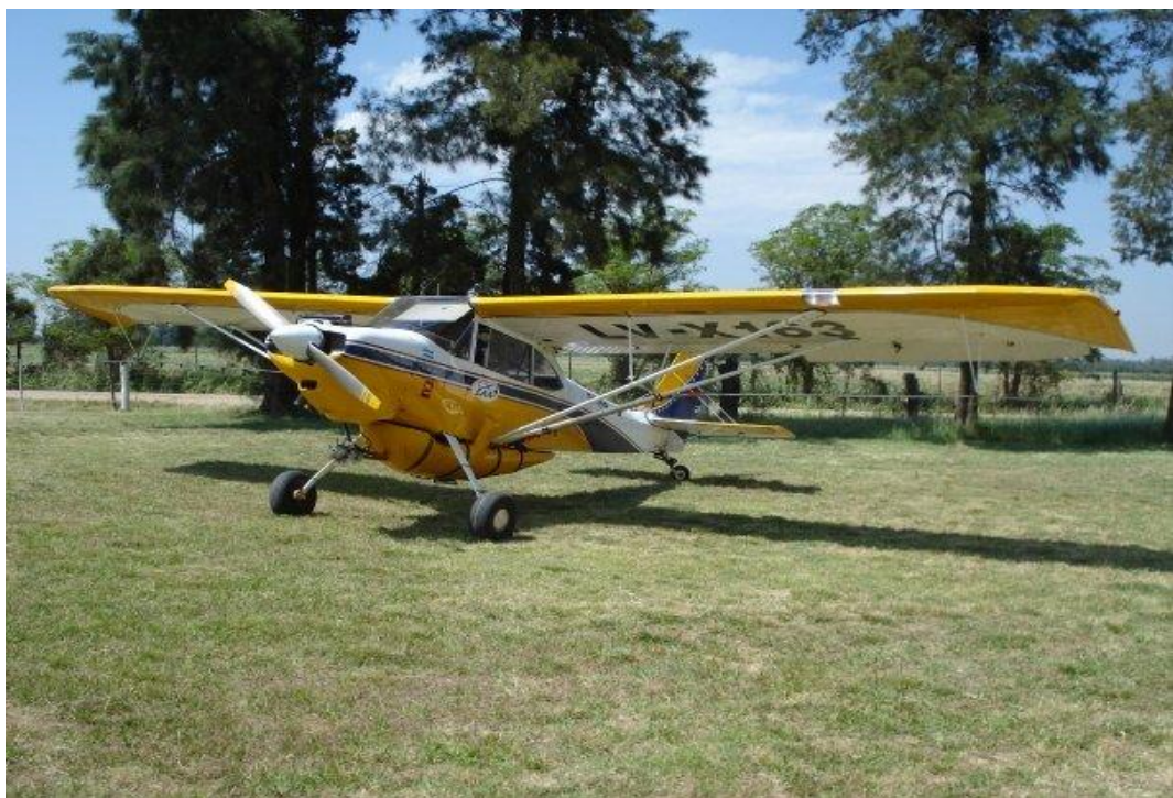
Figura 13. Avión fumigador