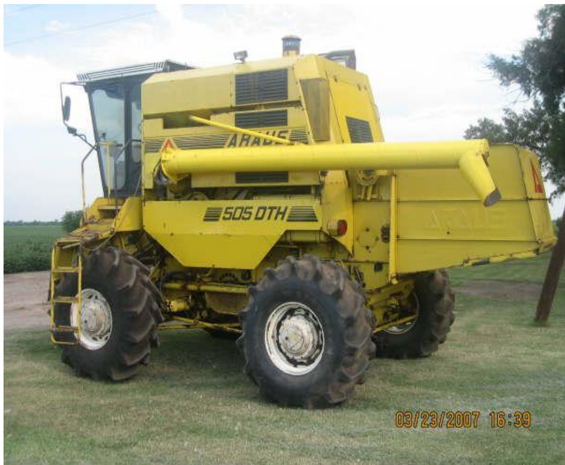
Figura 20. Trilladora en condiciones de operación

Tener las trilladoras en buenas condiciones mecánicas para el inicio de la cosecha, requería todo un proceso de planeación y ejecución, que prácticamente abarcaba todo el año, tanto para la reparación de las maquinas como para la planeación de la trilla de arroz. Como se puede ver en la Figura 20.