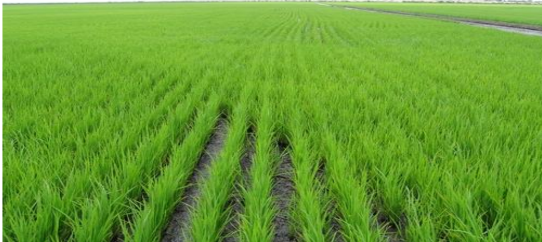
Figura 18. Areas productoras de arroz

La actividad principal de Servicios Ejidales S.A. de C.V. en el estado de Campeche fue la trilla de arroz, ya que esta empresa cosechaba casi el total del arroz que se producía en el estado. Como se puede ver en las Figura 18 y 19