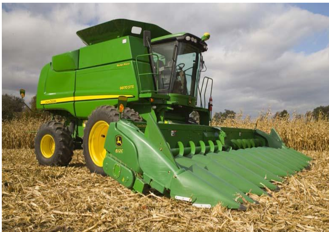
Figura 23. Cosechadora en el campo

Esta etapa debe de estar concluida por lo menos una semana antes de que el arroz este en condiciones de ser cosechado. Como se puede ver en la Figura 23