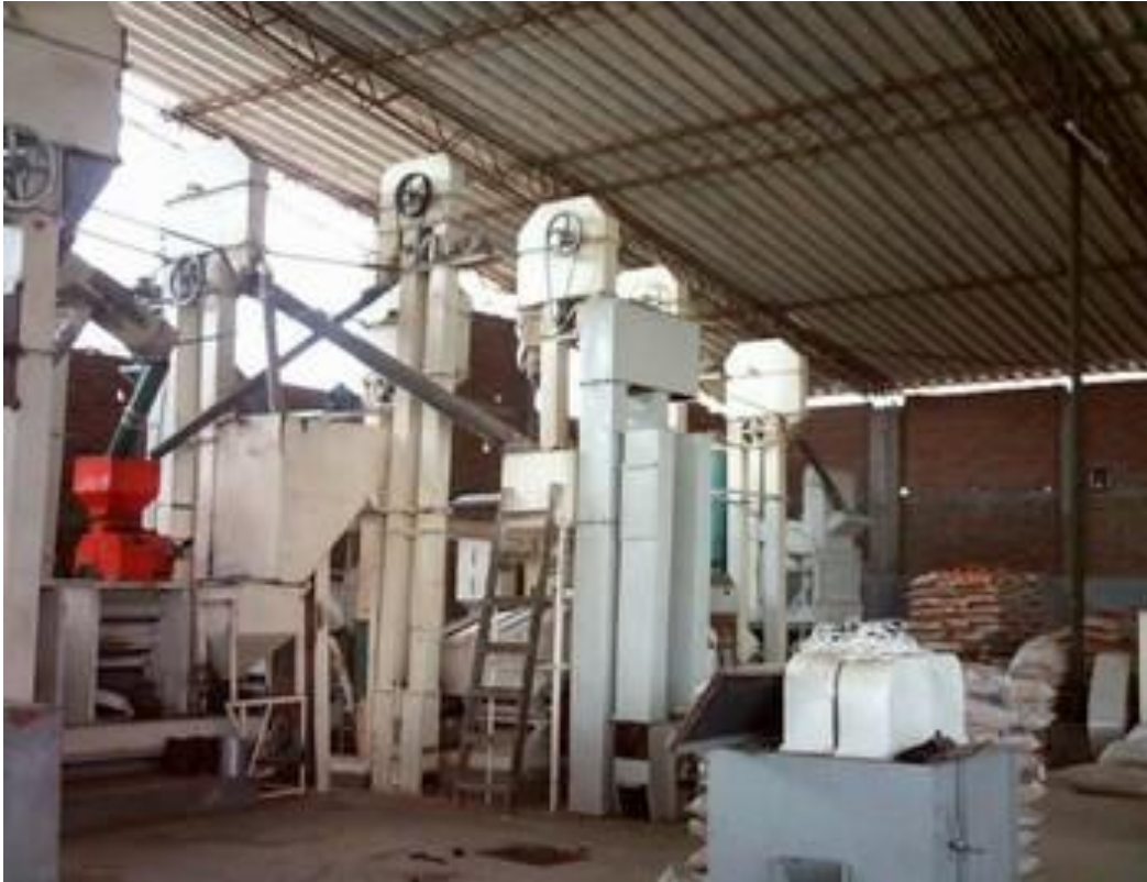
Figura 9. Equipo transportador de arroz