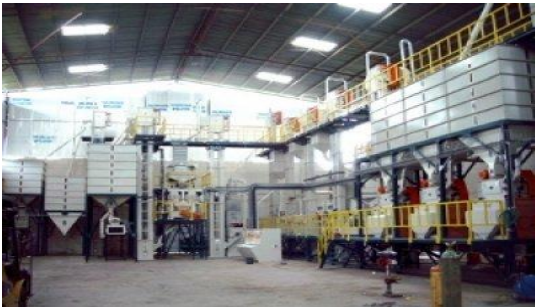
Figura 8. Plantas beneficiadoras de arroz