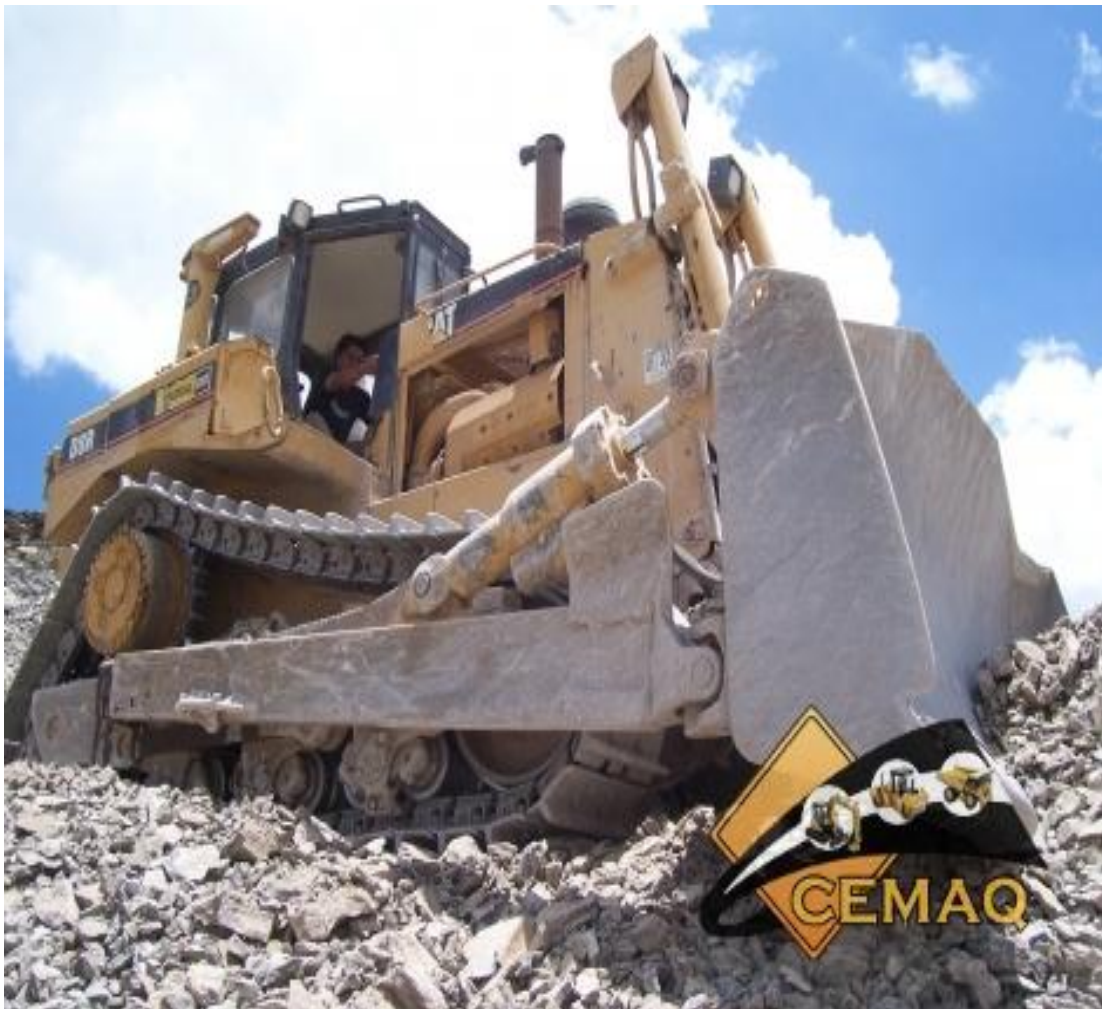
Figura 1. Tractor de orugas

Originalmente Servicios Ejidales S.A. de C.V. se conformo con una gran variedad de divisiones agroindustriales entre las que podemos destacar: