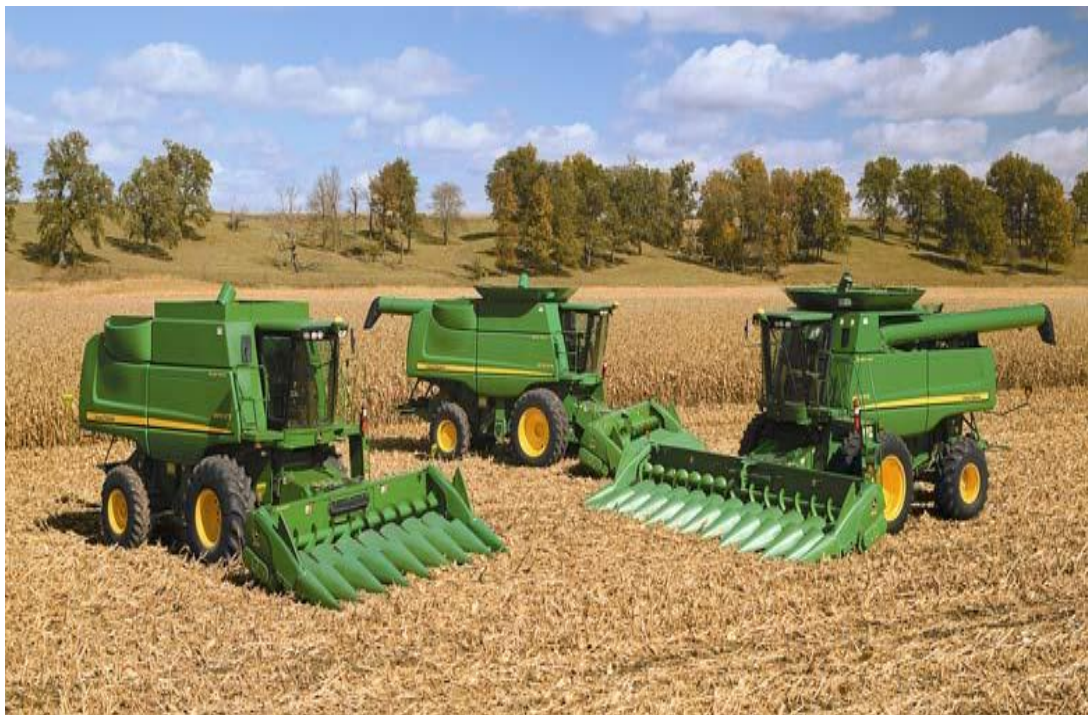
Figura 22. Combinada con diferentes cabezales de trilla