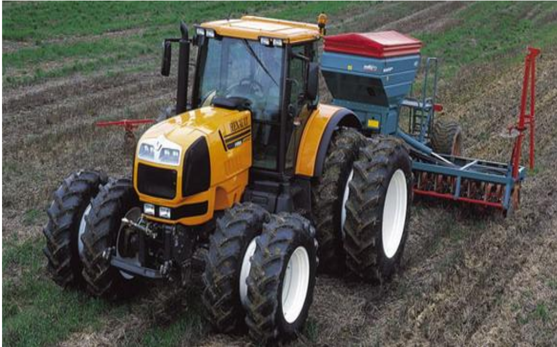
Figura 17. Tractor agrícola con sembradora boleadora

Otra forma de sembrar la semilla de arroz, es a través de avionetas, las cuales se utilizan para sembrar extensiones grandes de terreno; la ventaja de los aviones es la rapidez de la siembra y la posible desventaja es que son más costosos y se tiene que contar con una pista para el despegue y aterrizaje cerca.