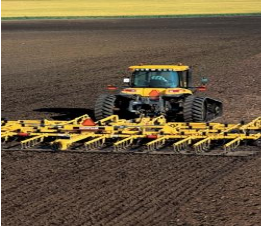
Figura 14. Tractor agrícola de orugas preparando el suelo

Rastreo cruza.- Se realiza exactamente igual que la labor anterior (rastreo) la única variante es que se debe trabajar en forma perpendicular a como se realice la labor de rastreo, así se le dará mas eficiencia a la labor de segundo rastreo o cruza.