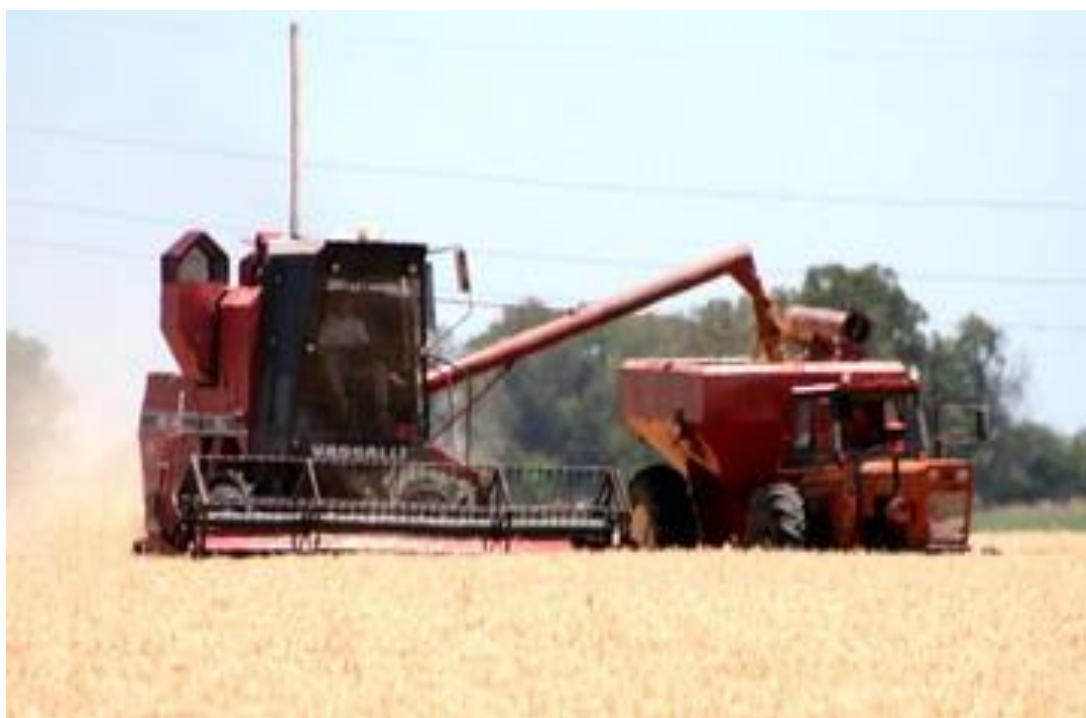
Figura 26. Trilla y descarga de grano a transportador simultáneamente