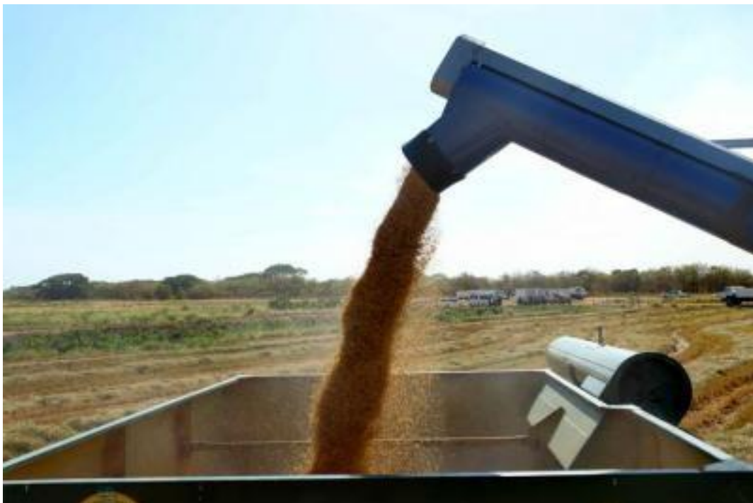
Figura 24. Descarga de arroz de la cosechadora al camión

Una vez que la trilladora completa el llenado de su tanque de grano, regresa a donde esta el camión de carga y mediante una palanca despliega el tubo de descarga, el cual lo ubica por arriba del camión de carga, para iniciar el proceso de vaciado de grano. Posteriormente la trilladora repliega el tubo de descarga (Figura 24) y se dirige nuevamente al predio a continuar con su labor de corte, este proceso se da de igual forma para todas las trilladoras. Cuando el área de corte, se va alejando paulatinamente de las áreas de descarga, es cuando se requiere el transportador de granos o “boogie”, ya que este se acerca a donde la trilladora ya tiene llena su tolva de granos y le vacía al transportador su carga, con lo cual se evitan los traslados de las trilladoras de largas distancias para venir a descargar el grano (Figura 24, 25 y 26).