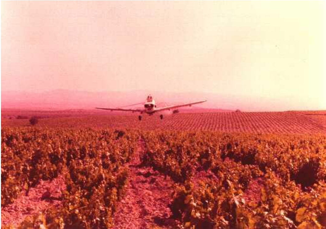
Figura 12. Avión aplicando producto químico al cultivo