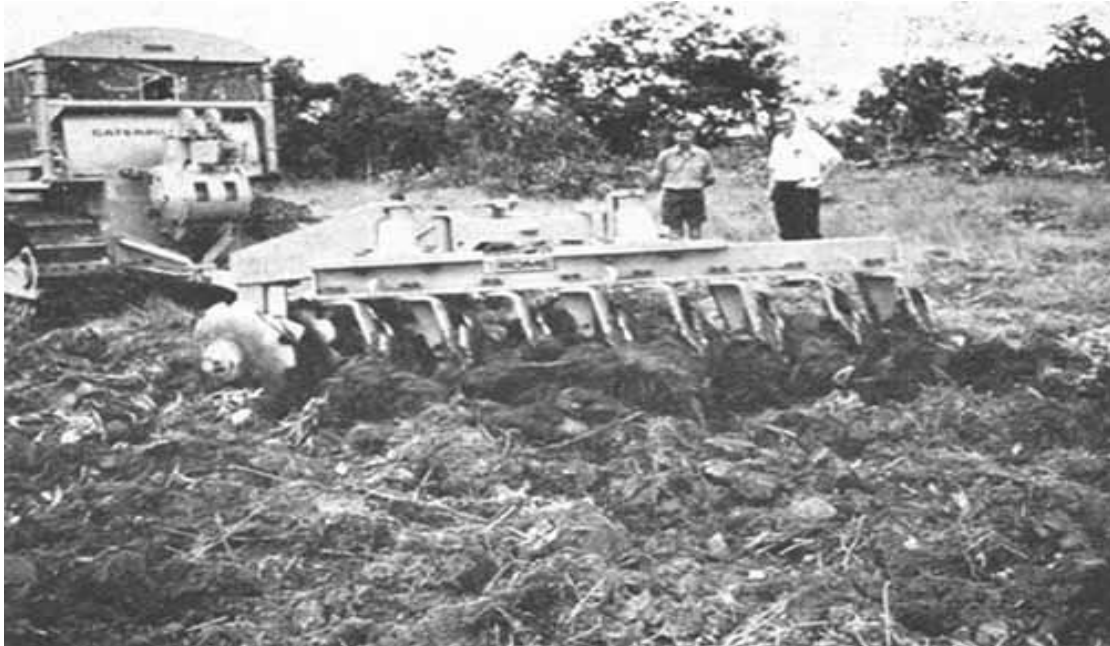
Figura 5. Tractor de orugas con rastra pesada para desmonte

Desmontes.- División de Servicios Ejidales que en su momento se encargaba exclusivamente de los diversos programas de desmontes en la república mexicana, siendo una de las empresas que mas desmontes realizó en territorio mexicano. Esta división estaba conformada principalmente por: tractores de oruga de gran capacidad, peines para tractores, cadenas de desmontes y ripper para los tractores. Como se puede ver en las Figuras 5 Y 6