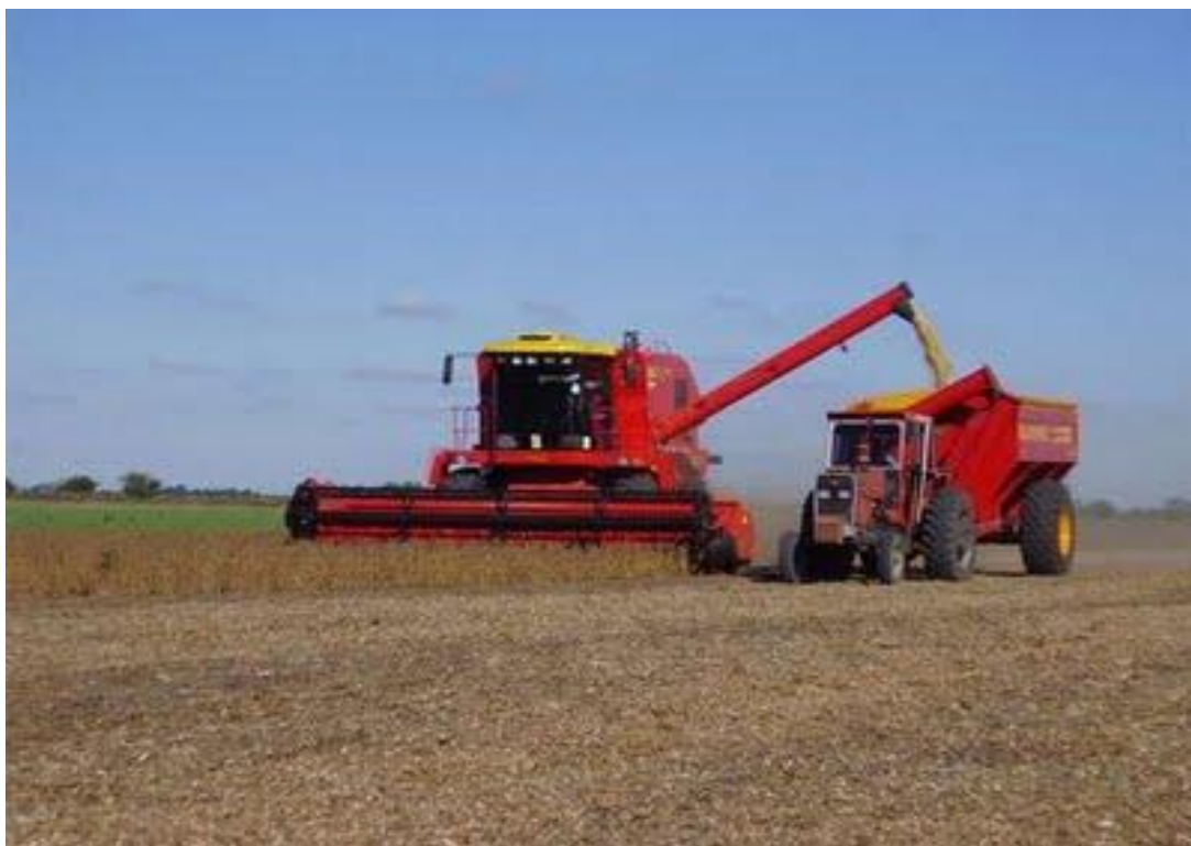
Figura 25. Descarga de grano a remolque o transportador