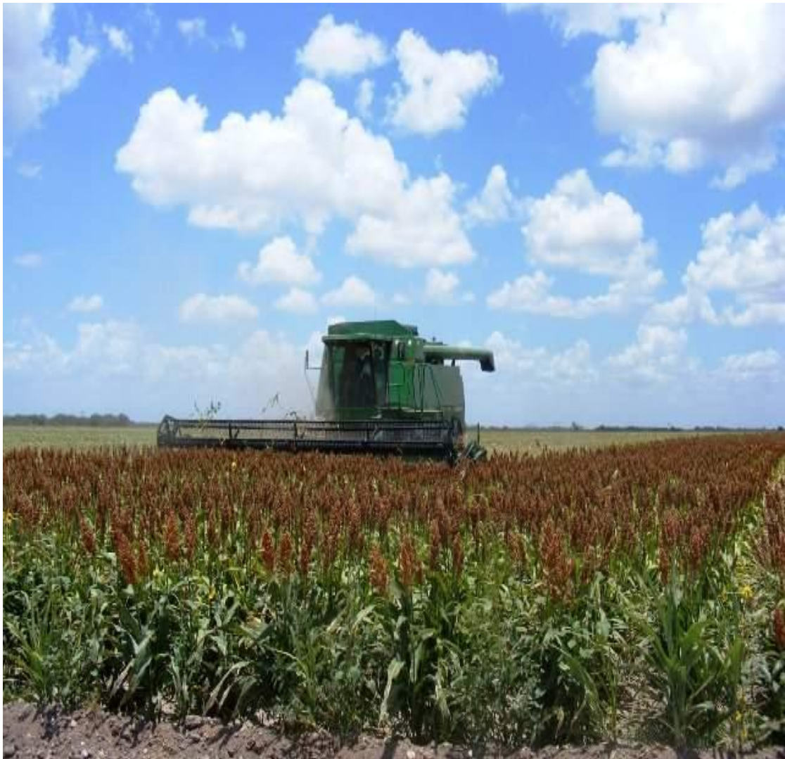
Figura 2. Cosechadora de granos

Maquinaria agrícola.- División de Servicios Ejidales S.A. de C.V. encargada de la preparación de tierras, siembra, labores culturales y cosecha de los diferentes cultivos existentes de la república mexicana. Esta división contaba con: tractores agrícolas, tractores de orugas, transportadores de granos (propulsados y de tirón) trilladoras estacionarias y combinadas, para el corte de granos y casi toda la gama de implementos agrícolas utilizados en diferentes labores de preparación de suelos. Como se puede ver en las Figuras 2, 3 Y 4.