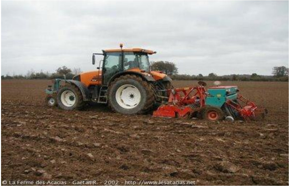
Figura 15. Tractor agrícola preparando el suelo y sembrando