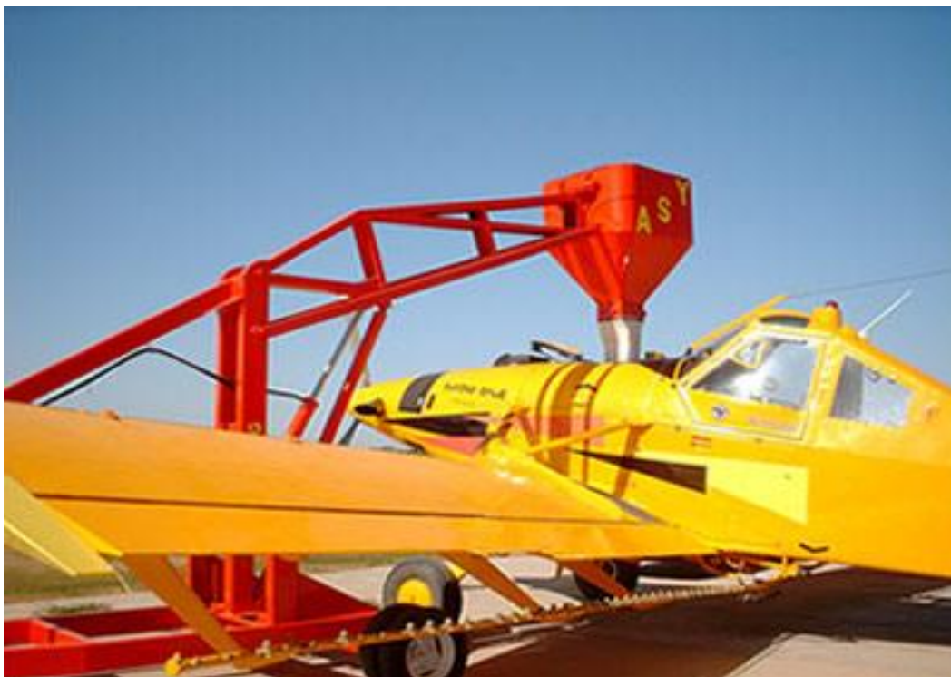
Figura 11. Avión utilizado para la siembra de arroz

Aviones.- Servicios Ejidales S.A. de C.V. llegó a contar con importantes flotillas de aviones, para dar el servicio de siembra, fumigación y aplicación de fertilizantes a los ejidos y a los pequeños propietarios. Esta división tuvo mayor presencia en los estados del norte de la república mexicana. Con el paso del tiempo, la mayoría de las divisiones se fueron desincorporando y entregándose a ejidos, unión de ejidos, gobiernos estatales, quedándose solamente con la división de maquinaria agrícola, desmontes y en muy pequeña parte con plantas beneficiadoras de arroz palay. Como se puede ver en las Figuras 11, 12 y 13.