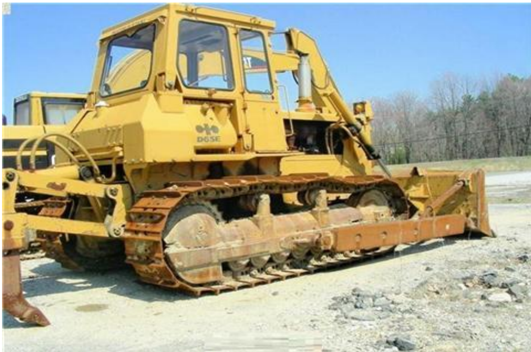
Figura 6. Tractor de orugas utilizada para desmontar