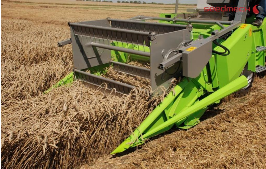
Figura 21. Combinada o trilladora de arroz trabajando