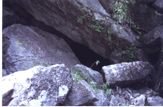
Foto 15.- Cueva La Florida.