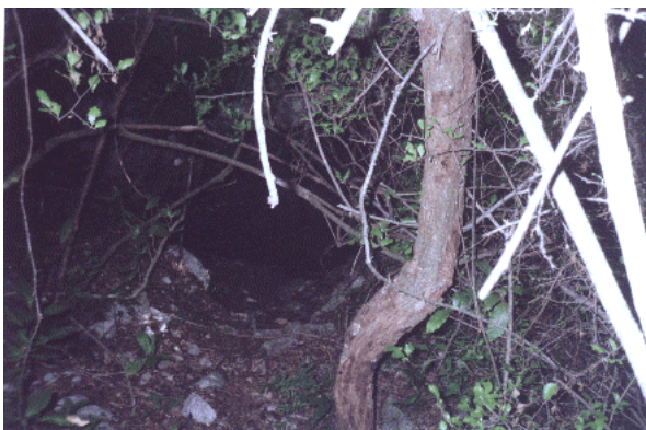
Foto 10.- Cueva del Pachón.