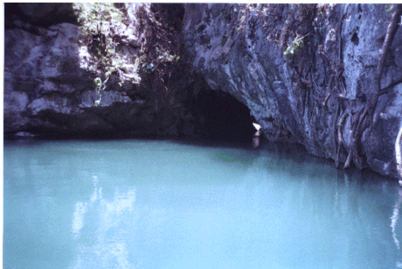
Foto 6.- Cueva del Nacimiento.

Se encuentra al Oeste de Ciudad Mante, Tamaulipas, muy cerca de La Aguja, en el ejido El Nacimiento.