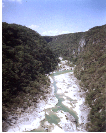
Foto 3.- Cañón de la Servilleta.