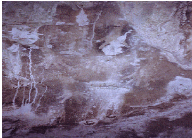
Foto 4.-Pinturas rupestres.

Se encuentra localizado en el ejido el Riachuelo rumbo a Ocampo Tamaulipas. Al noroeste de ciudad Mante, Tamaulipas.