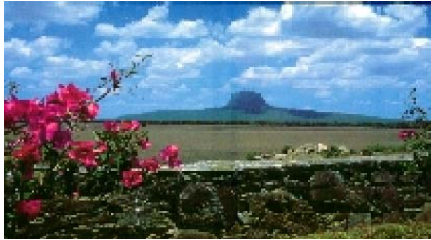
Foto 8.- Cerro del Bernal.