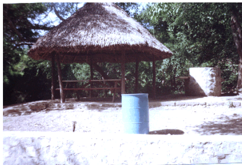
Foto 22.- Instalaciones de La Florida.

Se encuentra localizado al noreste de Ciudad Mante, Tamaulipas cerca del ejido Ojo de Agua por la carretera no. 85.