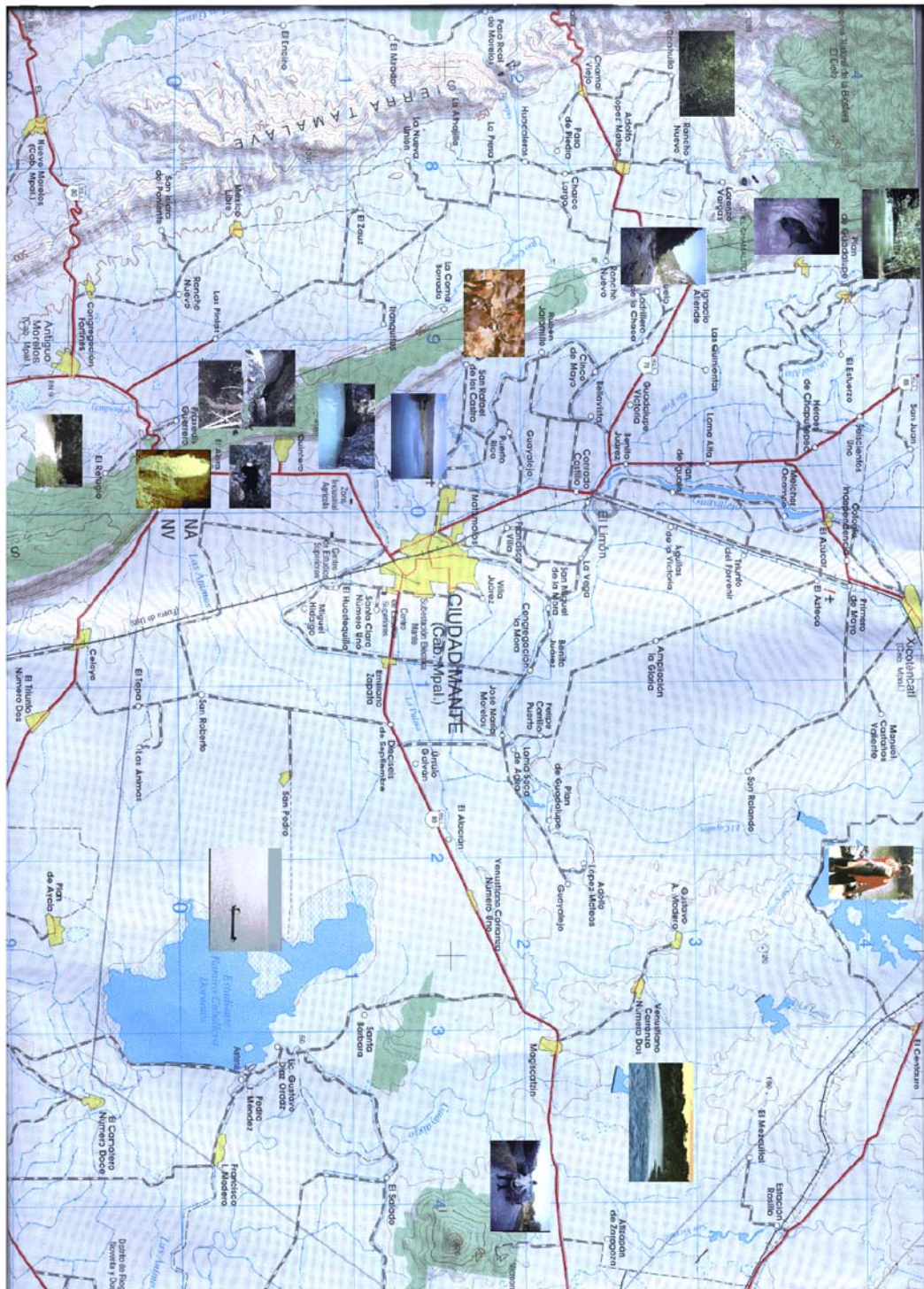
Mapa 2.- Localización de los sitios de estudios de región de Ciudad Mante, Tamaulipas.