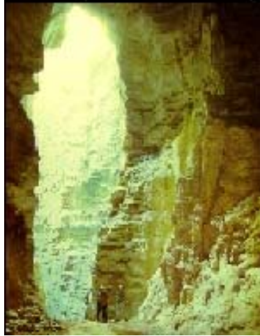
Foto 9.- Cueva del Abra.