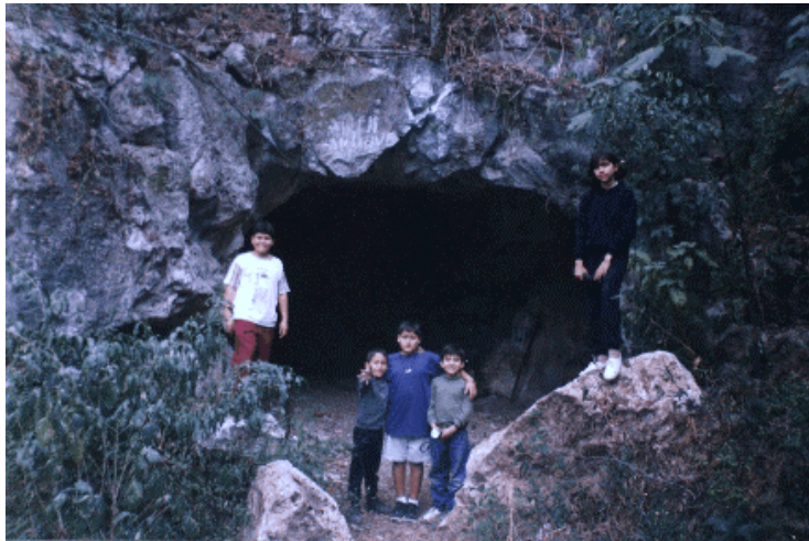
Foto 13.- Grutas de Quintero.