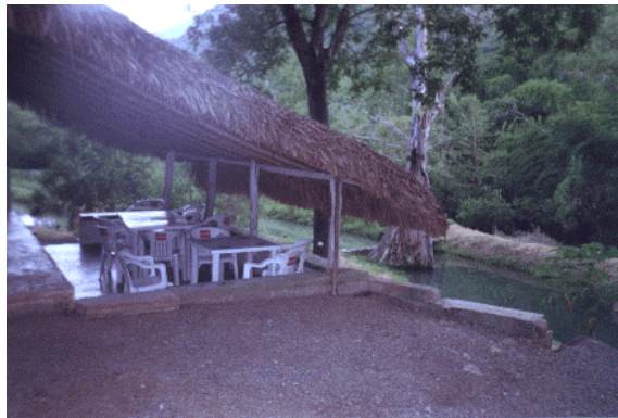
Foto 23.- Restaurante La Bocatoma.

La Florida cuenta con palapas, lugares para acampar, botes de basura, sanitarios de pozo , en este lugar se cobra una pequeña cuota de $10 por vehículo.