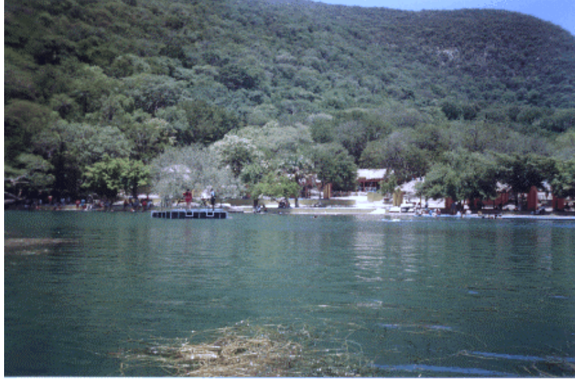
Foto 5.- El Nacimiento.