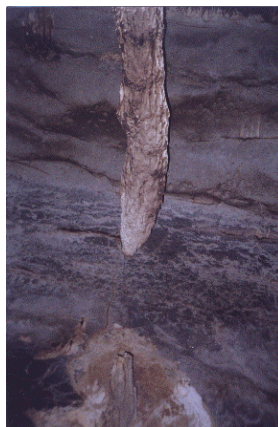
Foto 16.- Interior de la cueva La Florida.