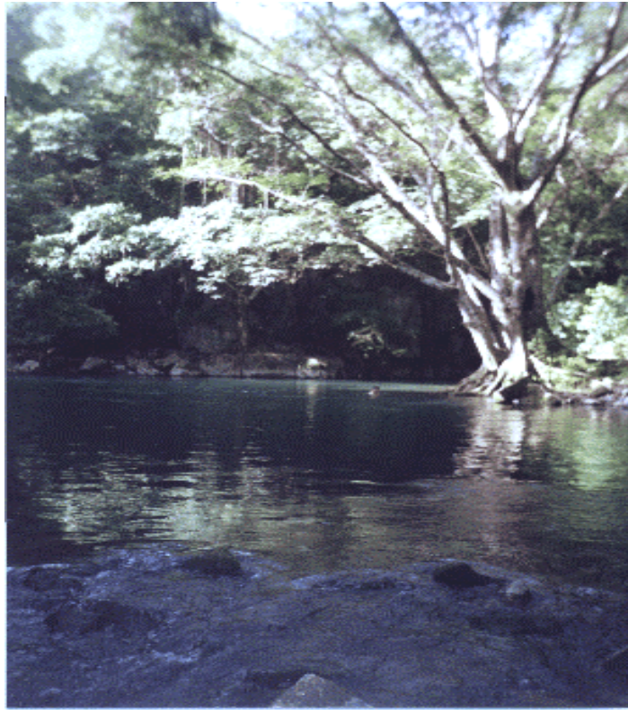
Foto 21.- La Poza Azul.