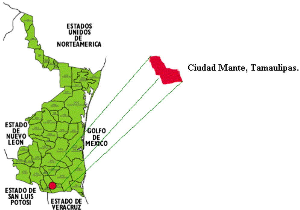
Mapa 1.- Localización del municipio de Ciudad Mante, Tamaulipas.