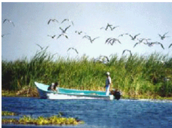
Foto 20.- Actividad recreativa de la presa Las Animas.