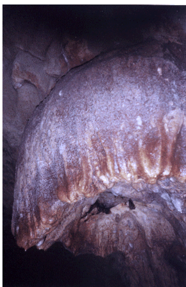
Foto 11.- Interior de la cueva del Pachón

Se encuentra en el ejido Praxedis Guerrero, municipio de Ciudad Mante, Tamaulipas, por la carretera no. 85