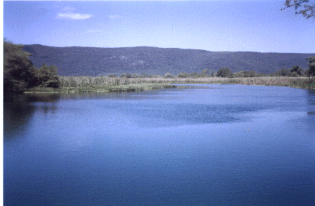
Foto 1.- Presa La Aguja.