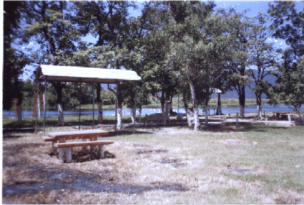
Foto 2.- Instalaciones de la presa.

No cuenta con servicios de sanitarios, hotel, agua potable, restaurante; sin embargo cuenta con lugares para acampar y dentro de su infraestructura cuenta con dos cuartos grandes, algunos techos, mesas para acampar y juegos infantiles de metal.