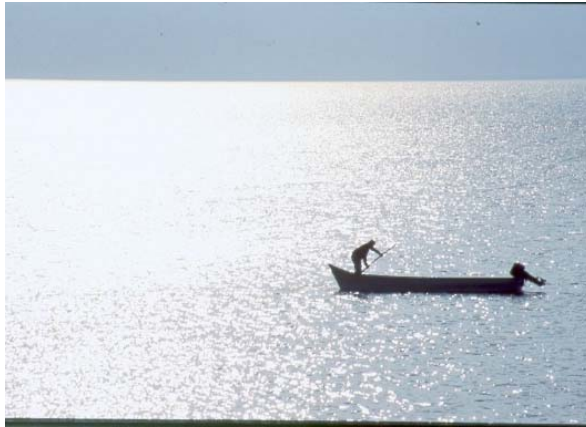
Foto 19.- Presa Ramiro Caballero.