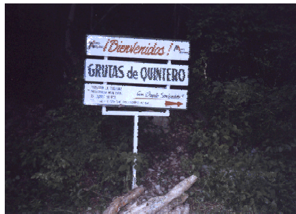
Foto 14.- Señalamiento de las Grutas de Quintero.

profunda se siente poco aire y una gran humedad, ya que cuenta con algunas entradas de agua. También para aquellas personas a quienes no les agraden las cavidades rocosas, en la atardecer se pueden observar como miles de murciélagos salen de la cueva para conseguir su alimento en las tierras cultivadas cerca de las grutas. En esta gruta también se pueden practicar el rapel, ya que cuenta con una claraboya a pocos metros de la entrada. Es un lugar en donde se han realizado muchos estudios científicos acerca de murciélagos. Cuenta con algunas estalactitas y estalagmitas.