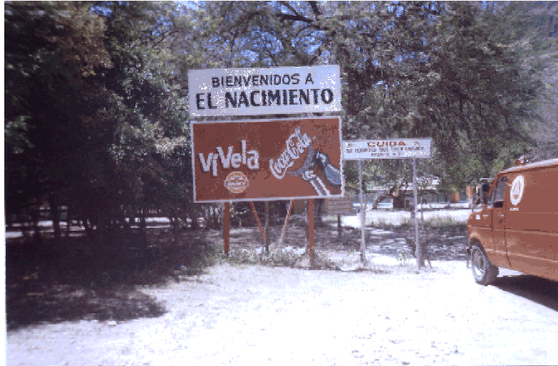
Foto 7.-Entrada a El Nacimiento.

Hay comercios, venta de cerveza, refrescos, hay sanitarios normales y de pozo, no hay venta de agua potable, ni comidas, hay algunas bancas y palapas grandes, también rentan llantas a un precio de $5.00 con un depósito de $15.00. Cuenta con un gran número de letreros para el cuidado del lugar, cuenta también con un chapoteadero en la orilla del río para los pequeños.