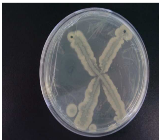
Fig. 1 Crecimiento bacteriano de la mezcla de Bacillus inoculada a la semilla de cebolla con el Biopolímero.

Mediante la metodología aplicada fue posible encapsular las diferentes cepas de Bacillus y las esporas de Trichoderma en la semilla de cebolla con el biopolímero; no se detectó ningún efecto detrimento en los microorganismos empleados. Lo anterior se comprobó mediante la siembra de la semilla inoculada con los diferentes microorganismos en placas con medio de cultivo PDA, en ellas se pudo observar en un tiempo de 24 a 48 h el crecimiento de la masa bacteriana de Bacillus (Figura 1) y el crecimiento micelial para el caso de Trichoderma (Figura 2). De esta forma se pudo constatar que los microorganismos se encontraban adheridos a la semilla que sería sembrada posteriormente en charolas de germinación.