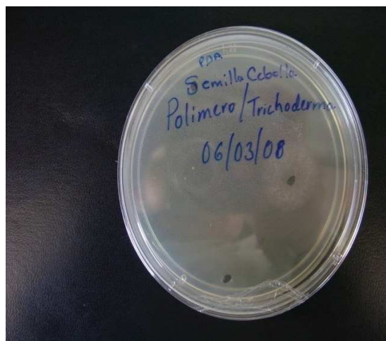
Fig. 2 Crecimiento micelial de Trichoderma spp. inoculado a la semilla de cebolla con el Biopolímero.