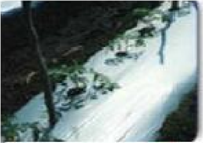
(Cuadro No. 5)