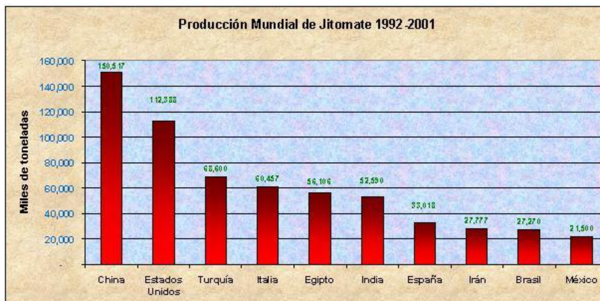
Figura 3.7 Producción mundial de jitomate

Turquía produce anualmente cerca de 7 millones de toneladas (8% del total mundial), Italia y Egipto participan en promedio cada uno con 6 millones de toneladas anuales (7% del total mundial), y finalmente la India quien posee la mayor superficie destinada al cultivo del jitomate, debido a sus bajos rendimientos, apenas produce 5 millones de toneladas (6% del total mundial). (Internet 6 siea.sagarpa.gov).