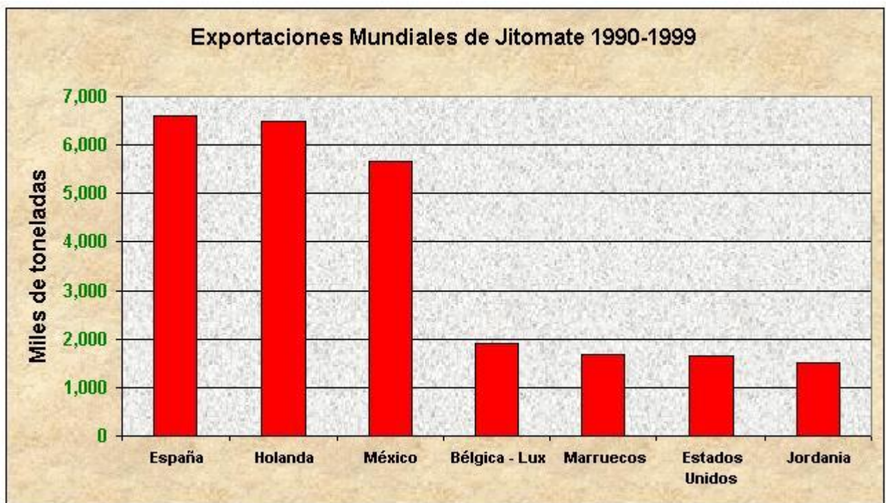
Figura 3.8. Exportaciones mundiales de jitomate

México ocupa el tercer lugar a nivel mundial como país exportador de jitomate, con volúmenes cercanos a las 600 mil toneladas anuales, la mayoría con destino a nuestro mercado natural: los Estados Unidos de América.