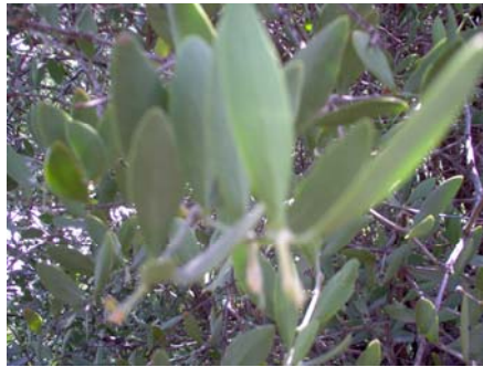
Figura 1. Observamos las hojas de la planta de jojoba

En muchos arbustos aparece una concreción pubescente que le da un aspecto azul grisáceo al follaje. Algunos observadores le han dado un significado varietal, aunque no parece tener una asociación regular con otros caracteres y parece principalmente un carácter fisiológico; podría tratarse de una respuesta edáfica y tiene las funciones de una cera en la hoja. La epidermis de estas hojas están cubiertas de vellosidades, con numerosos estomas en ambos lados; el mesofilo esta cubierto completamente de células de empalizada con abundantes cristales de oxalatos de calcio en la periferia de la hoja.