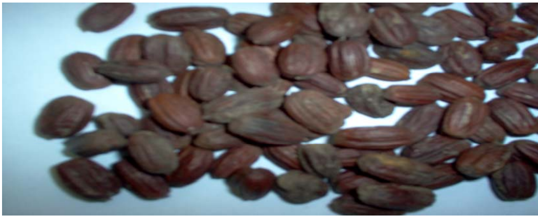
Figura 5. Se muestra la semilla de jojoba

Sherbrooke, W.C. y Haase, E.F. (1974), la extracción que se efectúa por estos disolventes dio casi la misma cantidad de cera líquida, sin embargo con el alcohol izó propílico se extrajo una cantidad mayor y con el tetracloruro etilénico se extrajo una cantidad menor.