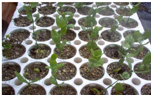
Figura 8. Plántulas de jojoba en charola