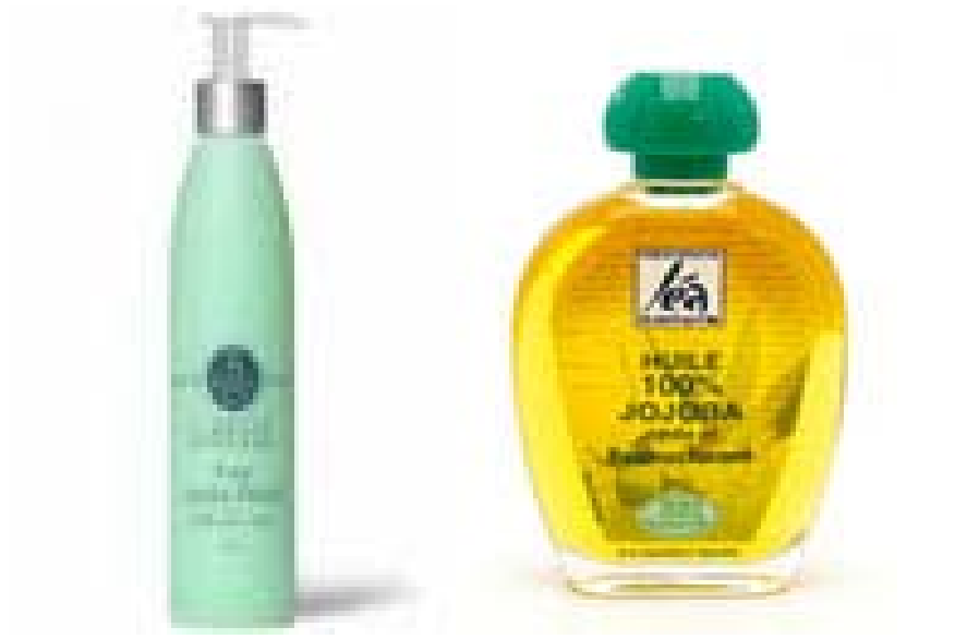
Figura 11. Productos diversos para el cuidado del cabello