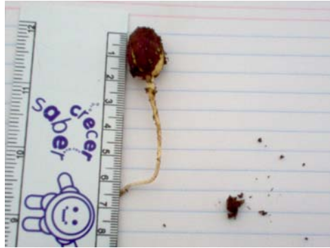
Figura 6. Una semilla de jojoba germinada