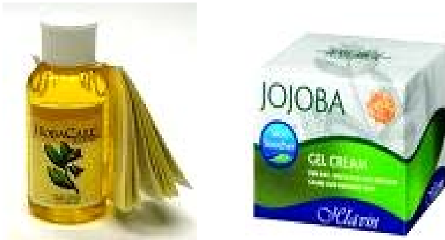
Figura 13. Otros artículos para el cuidado personal

Cerca del 90% del aceite de jojoba es destinada a la industria cosmética, especialmente para productos para el cuidado de la piel y del cabello. La estabilidad ante la oxidación, la sensación placentera que causa su aceite, su fácil absorción por parte de la piel sin causar irritación ni dejar olor y el hecho de que sea un recurso natural y biodegradable que no está basado en el petróleo, son razones para su uso dentro de esta industria.