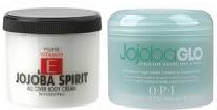
Figura 12. Amplia gama de cremas protectoras de la piel