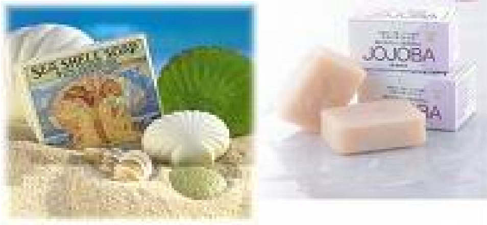
Figura 9. Jabones muy estéticos hechos a base de jojoba

tinta; la semilla quemada sirve para pintarse las cejas y como base para la fabricación de una pomada para las pestañas.