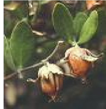
Figura 3. Fruto en proceso de maduración Figura 4. Fruto maduro de jojoba

La semilla tiene cerca de 1.5 cm de largo, la estructura de la semilla es excepcional; éstas semillas desarrolladas dentro de la cápsula contienen poco o ningún endosperma, formados por un embrión y cotiledones encerrados dentro de un forro delgado y duro, de acuerdo con Gree y colaboradores (1936), la semilla tiene un pedúnculo corto esta dentro una cápsula de 3 valvas, el óvulo fecundado crece de la flor hacia arriba hasta llenar la cápsula, la forma es desde redonda hasta alargada terminando en el extremo del pedúnculo en pico, se encuentran redondas, lisas y estriadas, cuando madura la semilla la cápsula se abre en 3 partes y la semilla queda colgada de la cápsula por medio de un cordón en forma de placenta, hasta que es arrancada por el viento, en algunos arbustos las cápsulas se adhieren fuertemente a la semilla teniendo que utilizar el proceso de descápsulado manual, la semilla varía de color rojizo a café oscuro tiene pubescencia aterciopelada de color blanquecino en la base y el ápice agudo, los cotiledones son blancos amarillentos, la vellosidad blanquecina o plateada se encuentra en el extremo redondeado, las semillas redondas pesan más que las alargadas y las lisas más que las estriadas.