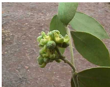
Figura 2. Planta de jojoba en etapa de floración.

La planta de la jojoba es generalmente dioica, presenta los sexos en diferente planta, el macho y la hembra son aproximadamente de igual naturaleza, las flores machos son pequeñas, apareciendo en ambos redondeados y en un tallo, son flores apétalas y tienen de 10 a 12 estambres, los sépalos son un tanto parecidos a pétalos, son oblongos suaves y con vello, tienen un color amarillo y se producen en racimos, se producen en las axilas de las hojas normalmente sólo una de las axilas de los nudos produce flores, quedando latente el brote opuesto, las flores femeninas se producen de una sola inconspicuas, de color verde pálido, apétalas. Las flores femeninas no resaltan a la vista, son del mismo color que las hojas y los tallos tiernos, se producen en las axilas de las hojas. Los sépalos de las flores pistiladas coalescentes en la base formando un receptáculo de 1.5 a 3 mm de profundidad ampliamente lanceoladas, suaves y pubescentes, apétaladas tienen 5 sépalos con ovario, bi o trilobulado, Shreve y Wiggins (1964), Wiggins (1980).