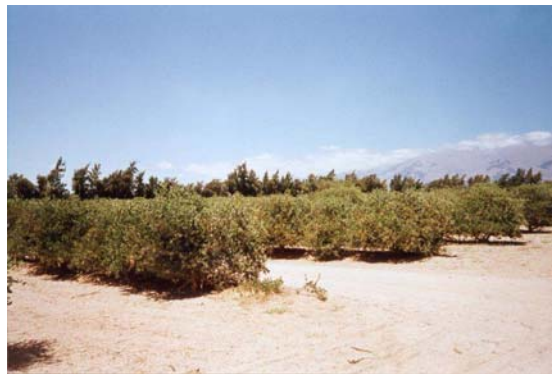
Figura 7. Plantación de jojoba