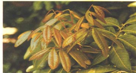
Tacámbaro, Mich. Brotación vegetativa de longan.