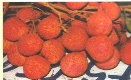
Martínez de la Torre, Ver. Frutos maduros de litchi.