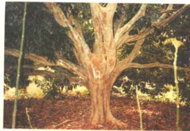
San José del Valle, Nay. Ramificación de árbol de litchi de 20 años de edad, variedad Brewster.