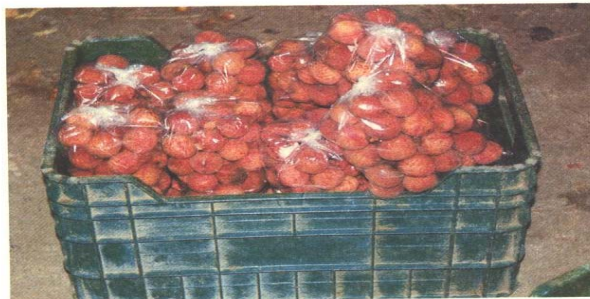
Empaque para el mercado local.