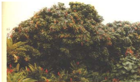
San José del Valle, Nay. Árboles de litchi de 24 años de edad.