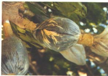
El Dorado, Sin. Acodos aéreos de litchi en ramas gruesas para iniciar la cosecha de fruta a sólo 2 años del trasplante.