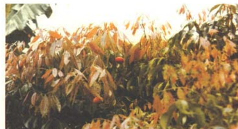
Tacámbaro, Mich. Brotación vegetativa y fructificación de litchi a fines de julio.