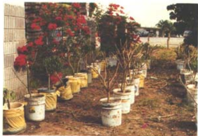
El Dorado, Sin. Vivero de litchi. Plantas listas para el trasplante.