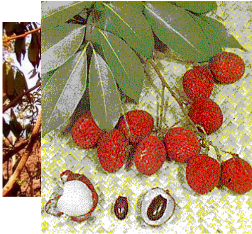
Variedad Haak Yip