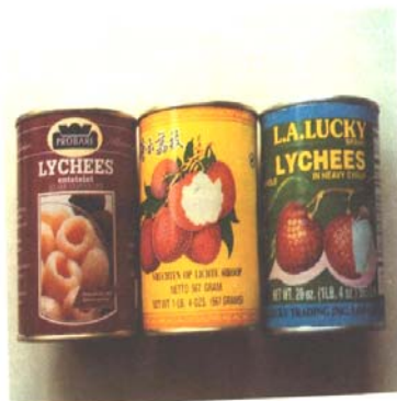
Litchi enlatado de Alemania, China y EUA para el mercado mundial.