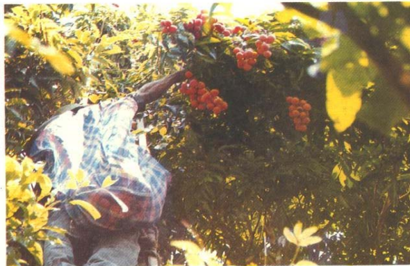
INIFAP, Ixtacuaco, Ver. Corte de litchi en junio.