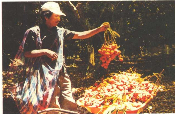
INIFAP. Ixtacuaco. Ver. Transporte del fruto en huerta.