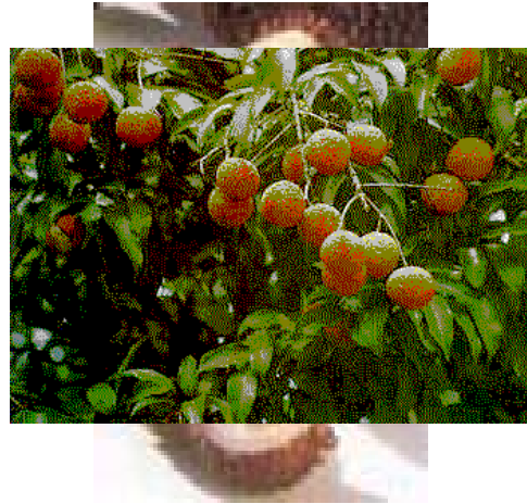
Variedad Tai So