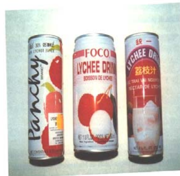
Jugos de litchi para el mercado mundial.