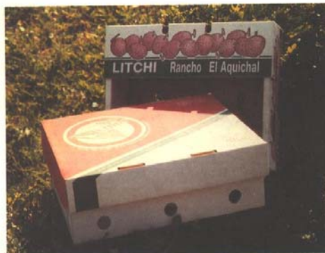
Empaque para la exportación.