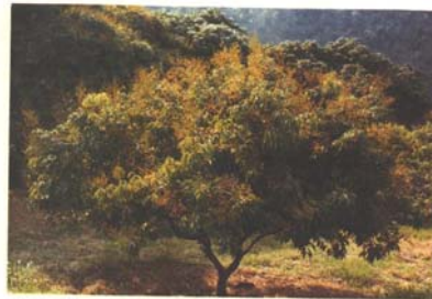
Huichihuayán, SLP. Árbol de litchi en floración, mes de febrero.