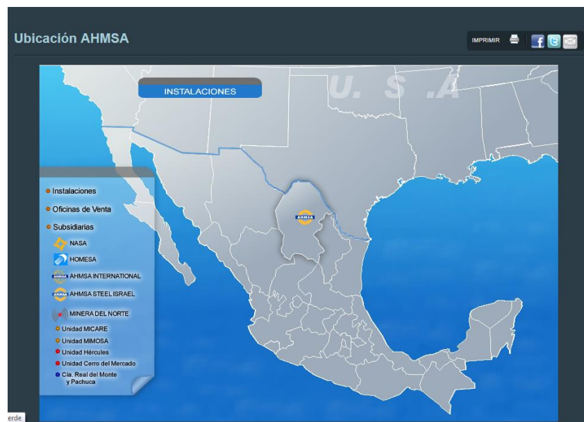
Figura 1.- Ubicación de la Plantas a Auditar.

AHMSA es líder nacional en producción y comercialización de productos planos: lámina rolada en caliente, placa, lámina rolada en frío, hojalata y lámina cromada. Cuenta además con facilidades para perfiles estructurales.