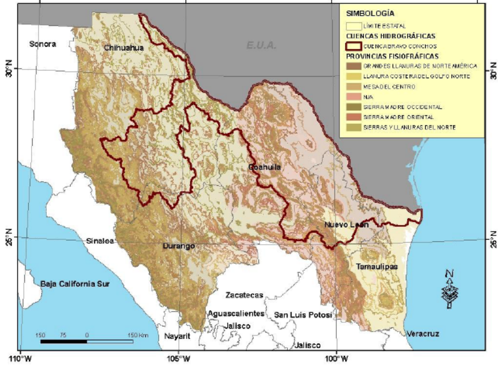
Plan Regional del Agua de la Mesorregión Noreste, 2008