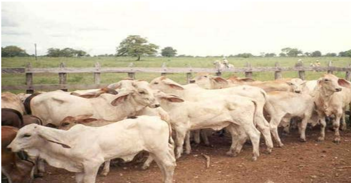
Figura 8. Hato bovino financiado con microcréditos para repoblación bovina.

En la figura anterior se muestra como la zona “A” el territorio des Estado que se encuentra libre de tuberculosis y con la letra “B” los lugares en los, cuales a pesar de los esfuerzos realizados para erradicar a esta enfermedad, aún se tienen registros de su existencia.