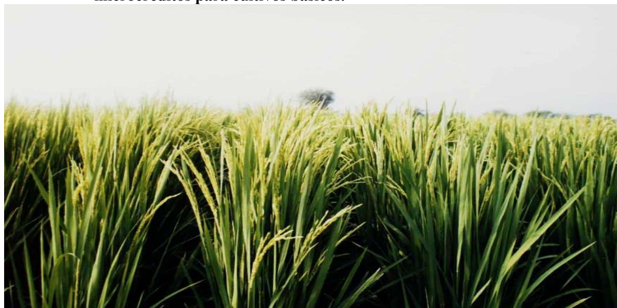
Figura No 3 Establecimiento de arroz palay en Tabasco, financiado a través de microcréditos para cultivos básicos.

En este sentido, el programa está diseñado para aportar apoyos que deriven de la adquisición de insumos con un valor de $1,000.00/ha al inicio de la actividad, con lo que el productor deberá ser capaz de integrarse como socio en una cuenta de ahorro y demostrar una recuperación de su capital inicial de cuando menos el 30%; esto le permitirá acceder de nueva cuenta al programa para ser apoyado de acuerdo a su monto de recuperación, sin que éste rebase los $10,000.00/ productor.