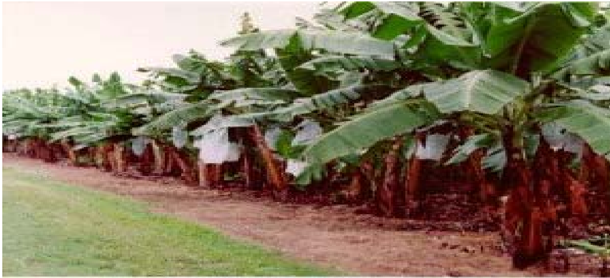
Figura No 5 Establecimiento de cultivo de plátano, en Tabasco financiado con microcréditos para cultivos frutales.

El financiamiento será de $3,500.00 a $7,000.00 por hectárea, dependiendo de las condiciones en que se encuentren los productores en cuanto a recursos disponibles, y bajo el entendido de que cada productor puede acceder a un monto máximo de $10,000.00 dentro del programa.