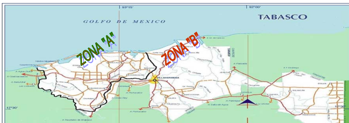
Figura 7. Campaña de Tuberculosis en el Estado de Tabasco (2004).

La adquisición del ganado al interior del estado de Tabasco sólo podrá realizarse en aquellas áreas que se encuentran clasificadas como libres de tuberculosis y que los proveedores cuenten con certificado de sanidad que corrobore la buena salud de los animales (Figura 7).