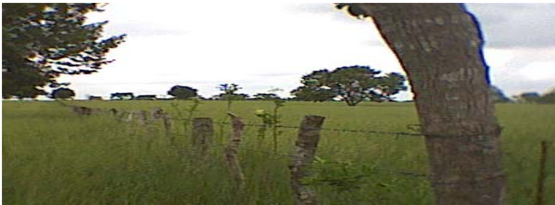
Figura 10. Cultivo de pastos inducidos financiado con microcréditos para establecimiento de pastos mejorados.