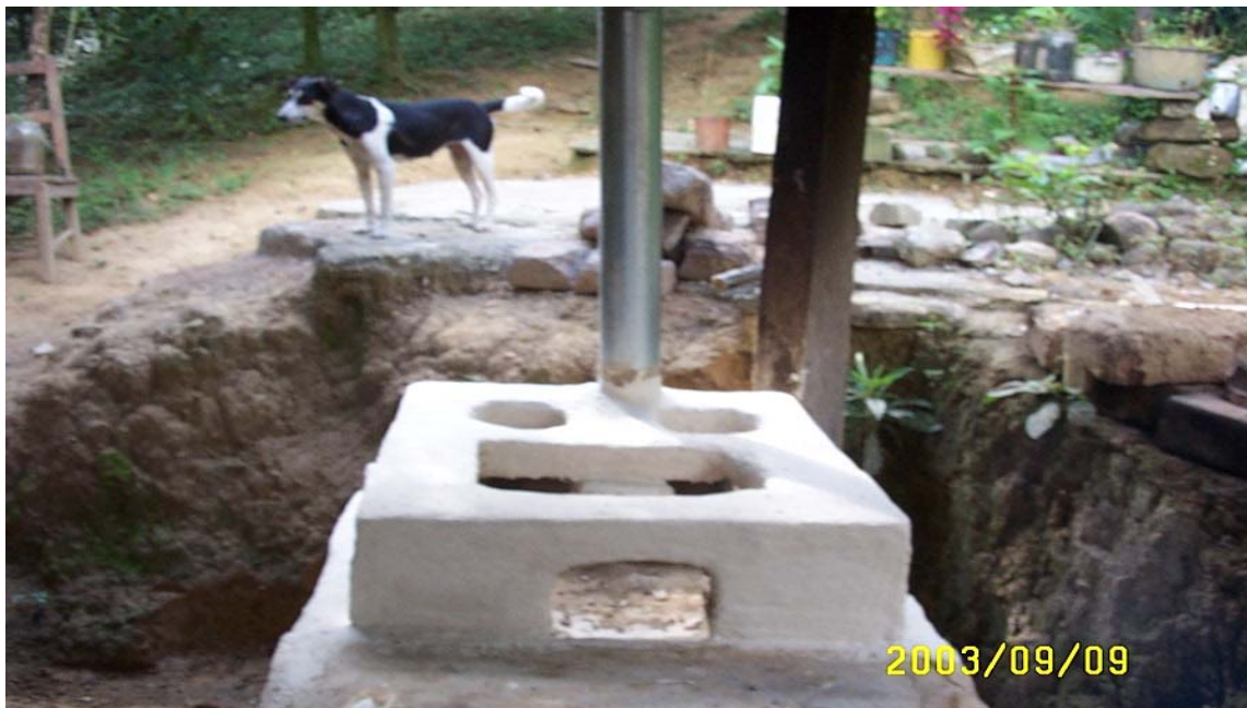
Figura 11 Estufa ahorradora de leña financiada con microcréditos dendroenergéticos.

La estufa deberá ser construida por el beneficiario, al cual se capacitará previamente para que aprenda el proceso de construcción de la misma.