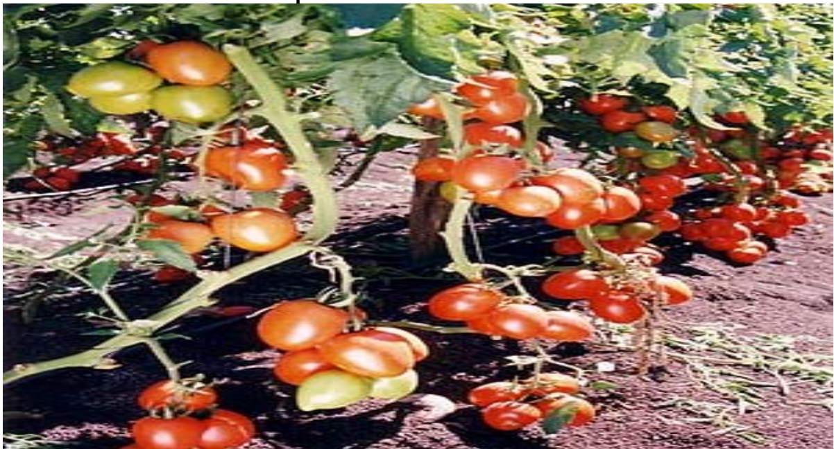
Figura No 4 Establecimiento de cultivo de tomate, en Tabasco financiado con microcréditos para cultivos hortícolas.

conseguirlo, se otorga a cada productor la suma de $5,000.00/ha para la adquisición de insumos. Si el beneficiado demuestra en una cuenta de ahorro una recuperación mínima del 30% de su capital inicial, podrá ser nuevamente subsidiado con una cantidad de no más de $10,000.00 equivalente al monto máximo de apoyo asignado para cada productor dentro del programa.