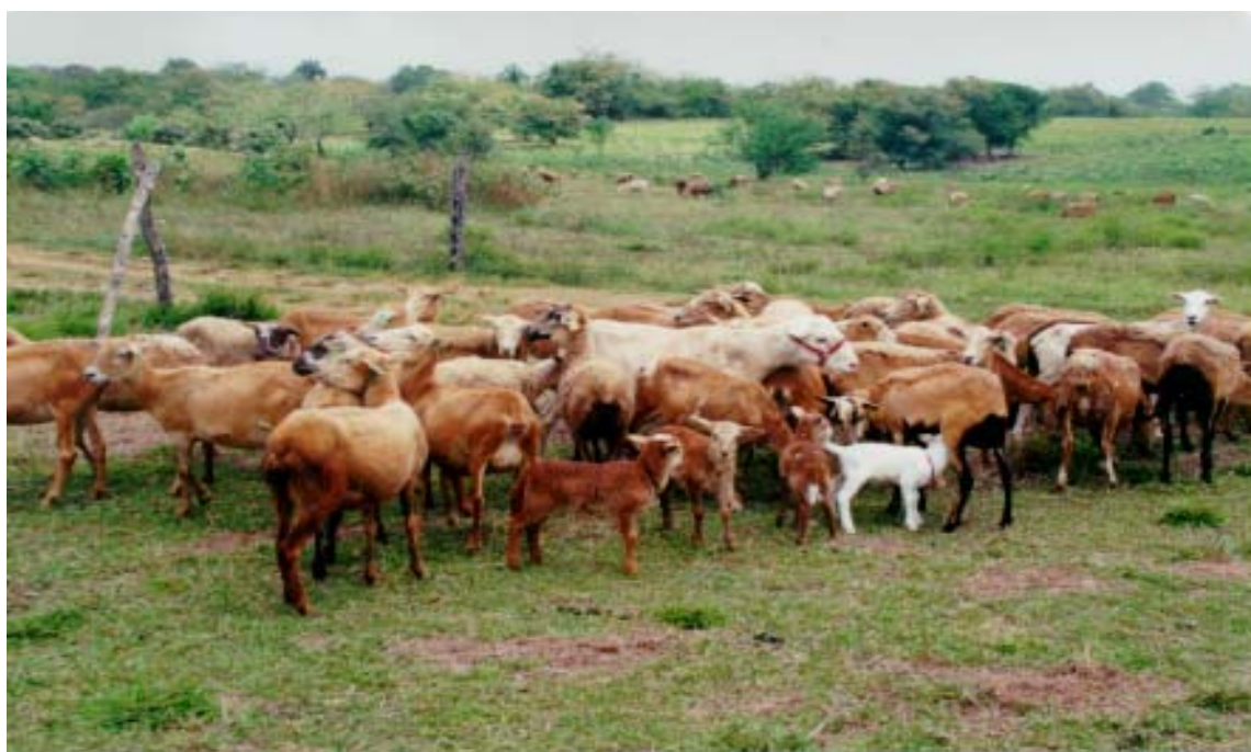
Figura 9. Ganado ovino financiado con microcrédito para repoblación ovina.