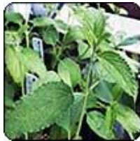
Orégano verde ( Lippia graveolens )

En México el término orégano se aplica a varias plantas aromáticas agrupadas en la familia de las labiadas, pero especialmente al grupo denominado científicamente como Lippia graveolens , común en toda la república. Es una planta perenne de origen europeo, dicotiledónea*, con una altura que varía entre los 30 y 160 cm. Rizoma rastrero*. Tiene corola* en forma de labio, hojas ovales y rugosas con envés pálido y generalmente vellosas y terminadas en punta. Sus tallos son vellosos, de color café rojizo y sus flores pequeñas pueden ser de color púrpura, rojizo, rosado o blanco y están agrupadas en densos glomérulos dispuestos en paniculas* terminales tienen cáliz acampanado con cinco dientes y corola con tubo erguido, cuyo labio superior está erecto y plano, y el inferior es trilobulado*. Su fruto es un tetraquenio* liso con los segmentos ovoides