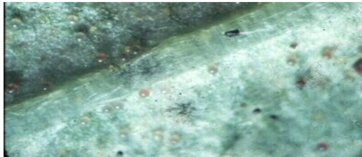
Fig 6. Huevecillos de Tetranychus cinnabarinus

La hembra deposita huevos color cristalino a perla, los cuales presentan forma globosa. Cuando la hembra oviposita, los cubre con una fina telaraña para fijarlos al sustrato, cuando esta fijando coloca su telaraña girando alrededor del huevecillo para fijarlo totalmente y prefiere ovopositar en la nervadura central de la hoja (Fig 6). Con el transcurso del tiempo se toman color pardo, para tomar una tonalidad cafésuzca antes de que ocurra la eclosión del huevecillo.