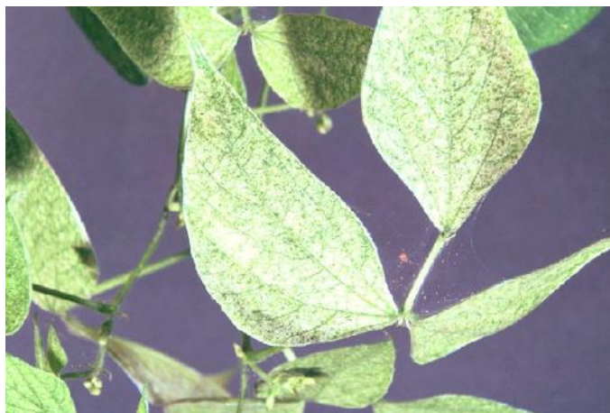
Fig 1. Daño de T. cinnabarinus en el cultivo de frijol

En relación a la disminución de los rendimientos producidos por ácaros fitófagos tenemos que Roussel et al. (1951), encontraron una reducción de 45% de semillas producidas en algodón ( Gossypium hirsutum L.), cuando éste fue atacado por Tetranychus ( Septanychus ) tumidus Banks). Hussey y Parr (1963), observaron que los rendimientos en pepino ( Cucumis sativus L.) descendieron cuando las hojas presentaron 30% del área afectada por el ataque de T. urticae . Wyman et al. (1979), trabajando con fresa ( Fragaria x Ananassa Dutch), encontraron reducción, de los rendimientos donde no se había controlado T. urticae . Oatman et al. (1981), señalaron que la disminución de los rendimientos en fresa fue menor a densidades de 6,37 ácaros/día/hoja.