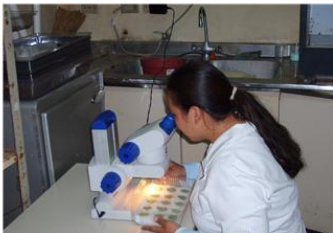
Fig. 5. Observación y separación de las hembras adultas a las 24 horas

Posteriormente se procedió a tomar 100 hembras en un día de edad recién apareada y se colocaron en forma individual en los discos de hojas de rosal; de tal forma que cada unidad experimental consistió de una hembra por disco.