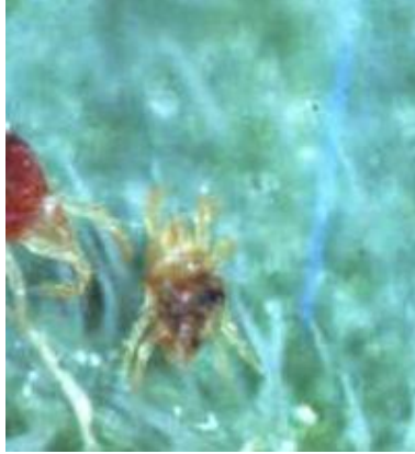
Fig 10. Macho de Tetranychus cinnabarinus

El macho es de forma triangular con patas más largas que su cuerpo, de color igual pero más largas que las hembras (Fig 10). Cabe mencionar que a partir del estadio de deutoninfa se puede diferenciar en machos y hembras.