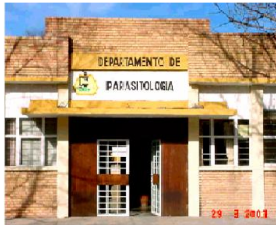
Fig. 3.- Departamento de Parasitología de la U.A.A.A.N

El presente trabajo de investigación fue realizado en el laboratorio de Acarología del Departamento de Parasitología Agrícola (Fig 3), de la Universidad Autónoma Agraria Antonio Narro, en Buenavista, Saltillo, Coahuila. Durante el periodo de Febrero - Abril del 2007 La especie utilizada para el estudio fue Tetranychus cinnabarinus y las variedades de rosal Vendela y Gran gala como sustrato. Con el propósito de conocer los parámetros poblacionales y tiempos de desarrollo por estadio específico, para lo cual se realizaron observaciones de comportamiento, cambios morfológicos y cuantificación de descendencia para estimar algunos parámetros de vida.