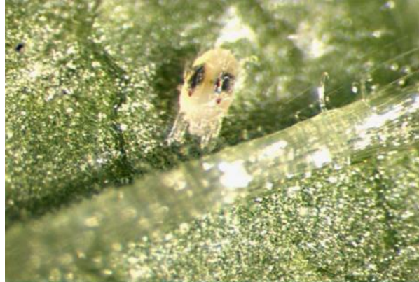
Fig. 8. Quiescencia de una protoninfa de Tetranychus cinnabarinus

Cuando los ácaros se encuentran en el periodo de quiescencia todos los estadios presentan la misma posición: los dos primeros pares de patas están dirigidos hacia enfrente (a excepción de la larva que dirige hacia enfrente solo el primer par de patas), formando una especie de “v” invertida, los siguientes pares de patas 3 y 4, se encuentran dirigidos atrás pegados al cuerpo (Fig. 8).