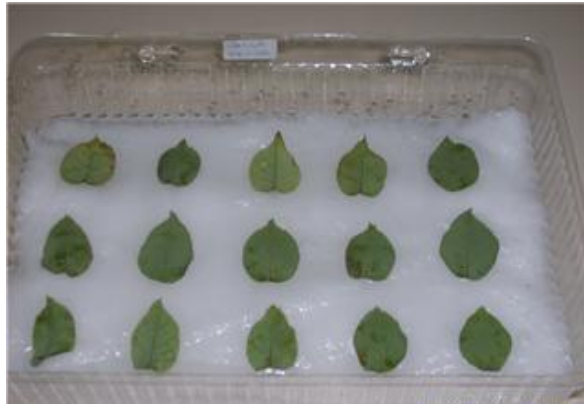
Fig. 4. Charola con la técnica de Ahmadi para la colocación de Tetranychus cinnabarinus

La técnica utilizada para el manejo del material biológico es la desarrollada por Ahmadi (1983). Los ácaros hembras utilizadas en el estudio, se transferían mediante un pincel de pelo de camello 000 a círculos de hoja de rosal variedad Vendela y Gran gala de 25 mm de diámetro hechas con sacabocados. Estos discos se mantenían sobre su envés en charolas de plástico provistas de una almohadilla de algodón saturada de agua. Este sistema permite que las hojas se adhieran firmemente a la esponja logrando que la misma humedad de saturación sirva como barrera para evitar el escape de los ácaros ( Fig. 4).