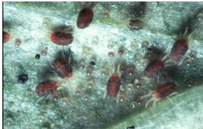
Fig 9. Hembra de Tetranychus cinnabarinus

Cuando los ácaros llegan al estado adulto es fácil distinguirlos, ya que la hembra presenta el abdomen más redondeado u ovalado que el del macho además de un color rojo carmín (Fig 9).