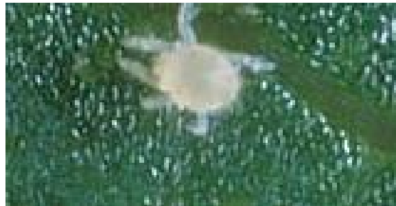
Fig. 7. Larva de Tetranychus cinnabarinus

La larva hexápoda, es de color blanca y únicamente se les notan las manchas oculares de color carmín (Fig 7). Conforme pasa el tiempo se torna de color rojo carmín, con patas amarillas mayores o iguales al tamaño de su cuerpo; al pasar al estadio de ninfa presenta cuatro pares de patas. En estado de adulto es de coloración rojo carmín mas intenso, pasando por los estadios de proto y deutoninfa, previo al periodo de quiescencia entre cada estadio activo.