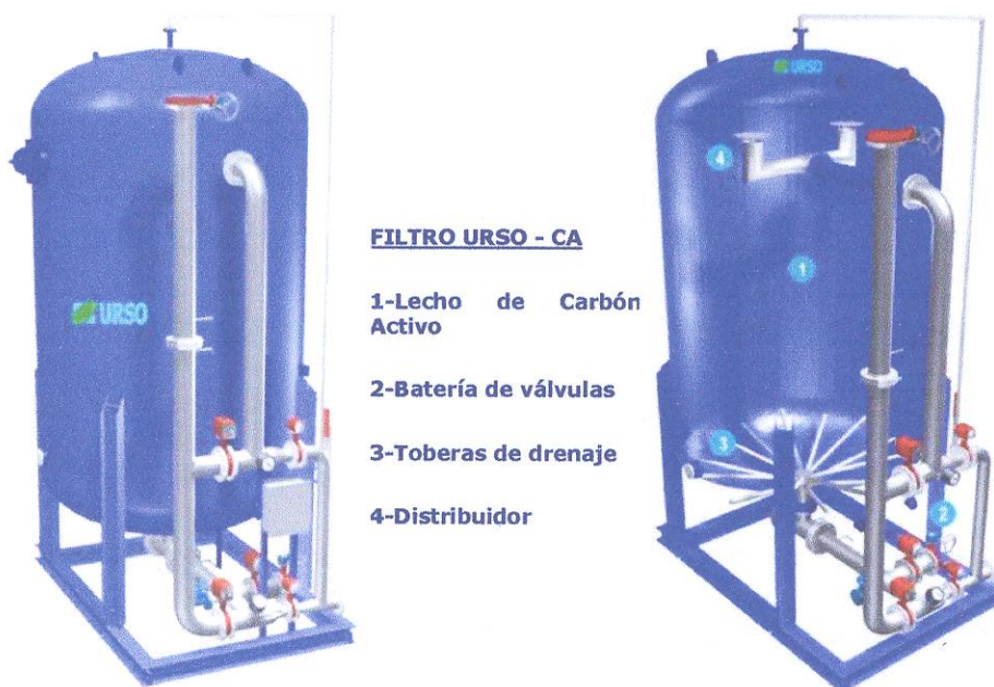
Figura 3. Filtros de carbón activado.

Una de las funciones del carbón activo en el tratamiento de aguas es la eliminación de concentraciones residuales de agentes oxidantes como cloro y ozono, y de los derivados cancerígenos, trihalometanos, originados en estos tratamientos. El carbón activo actúa adsorbiendo estos productos o catalizando a su paso a formas reducidas inofensivas. El diseño de los filtros de carbón activo granular depende de la calidad del agua y de la disponibilidad de espacio, así como de las etapas de tratamiento necesarias. Esto pudiera corresponder por Urso servicios ambientales (2000) que la capacidad de adsorción de diversas sustancias, junto con la gran facilidad y rapidez de eliminación del medio tratado y la posibilidad de, una vez agotado, ser regenerado para su reutilización, permite un tratamiento eficaz y barato en múltiples aplicaciones, en muchas de las cuales es un producto insustituible.