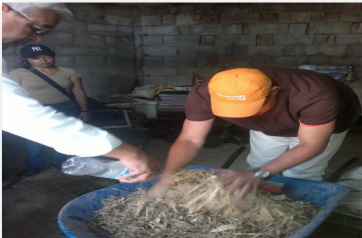
Figura 2. Agregando la dilución de urea