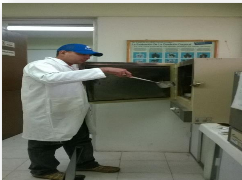
Figura 6. Determinación de materia seca