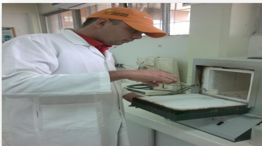
Figura 8. Determinación de cenizas