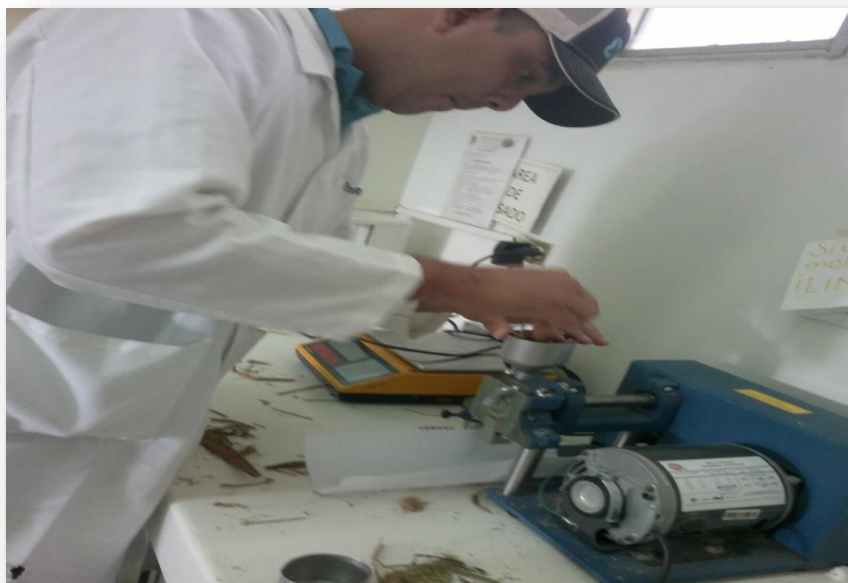
Figura 7. Molido de muestra

Para los análisis materia seca, cenizas, fibra detergente ácida, fibra detergente neutra y extracto etéreo, se molieron aproximadamente 100 gramos de rastrojo de maíz y se siguió la técnica de AOAC (2011).