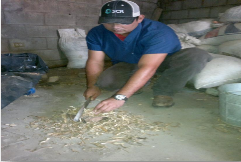
Figura 1. Picado del rastrojo