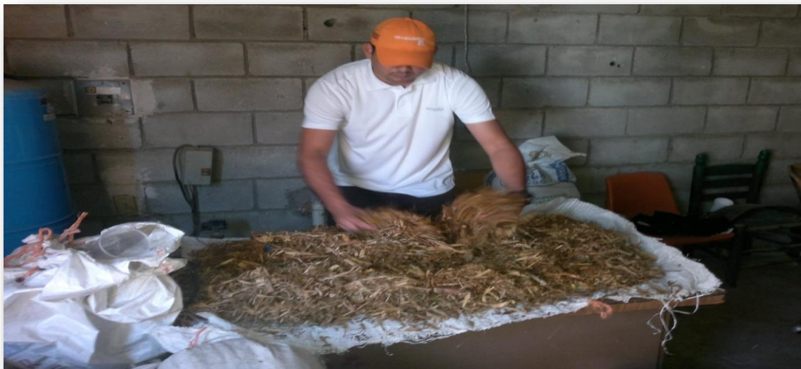
Figura 5. Aereación de la muestra