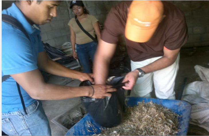
Figura 3. Embolsado de muestras