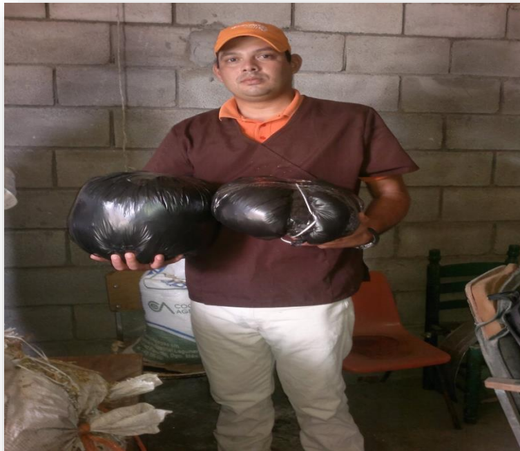
Figura 4. Sellado de bolsa