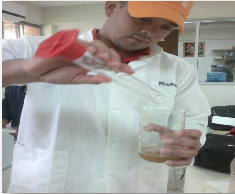
Figura 9. Determinación de fibra detergente ácida