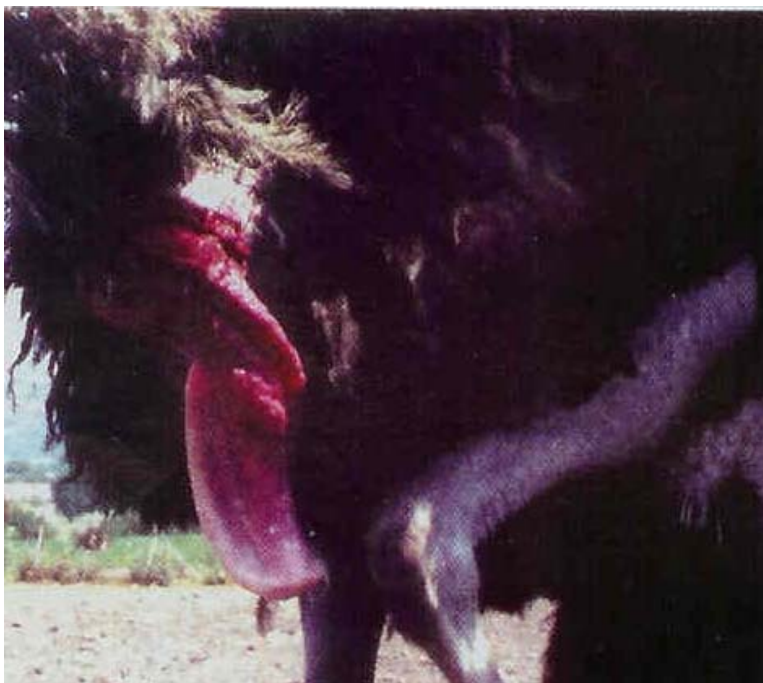
Figura 2: Aparato reproductor del macho (García, 2001).

El color del plumaje es la clave más visible en avestruces a partir de los 14 meses de edad. El macho es de color negro y la hembra de color gris. No obstante, es importante sexar por examen de órganos a todas las avestruces ver figura 2, especialmente a aquellos que no han madurado sexualmente, ya que se dan casos de hembras cuya coloración es muy oscura, y a machos que tardan más en adquirir su color característico (Maza, 1996).