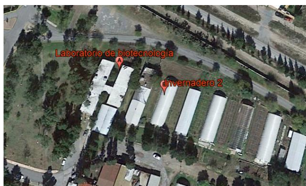
Figura 1. Ubicación geográfica de los lugares donde se desarrolló esta investigación.

El experimento se llevó a cabo dentro de las instalaciones de la Universidad Autónoma Agraria Antonio Narro. La siembra, riegos y crecimiento vegetativo del experimento, fueron llevadas a cabo en el invernadero número 2 de la Subdirección de Operación de Proyectos de esta universidad, el cual es de tipo túnel, con cubierta de plástico rígido, los análisis de los parámetros agronómicos se realizaron en el Laboratorio de Biotecnología, perteneciente al Departamento de Botánica (figura 1).