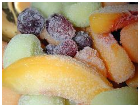
Figura 2 Congelación