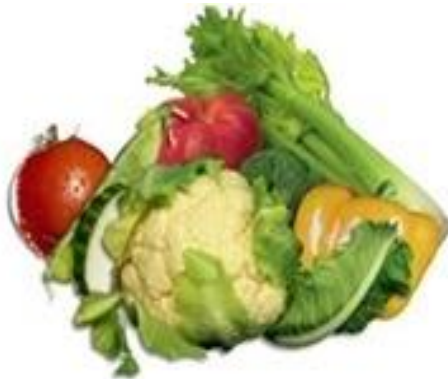
Figura 5 Descongelar verduras

Las verduras cortadas en rodajas o tiras pueden guisarse directamente en la cazuela con un poco de aceite o mantequilla, o bien coserse, como las demás verduras, en agua hirviendo.