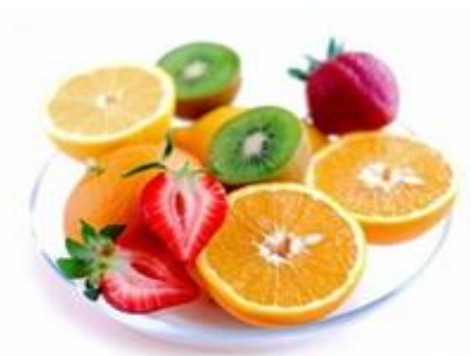
Figura 4 Descongelar fruta

Si se desea consumir este tipo de frutas solas, hay que dejarlas descongelar en el frigorífico, en el caso de que la fruta congelada vaya a ser utilizada para hacer una compota, puede ponerse directamente en la cacerola, sobre fuego suave.