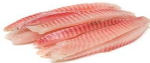
Figura 3 Descongelar carnes y pescado

Nunca se debe descongelar la carne bajo el grifo del agua caliente, los alimentos de dimensiones pequeñas, como los filetes, si pueden descongelarse a temperatura ambiente, ya que el tiempo que requieren es breve y el riesgo de que se estropeen es muy bajo, la carne y el pescado cortados en rodajas o filetes, que estén completa o parcialmente congelados, pueden ser puestos directamente en la sartén.