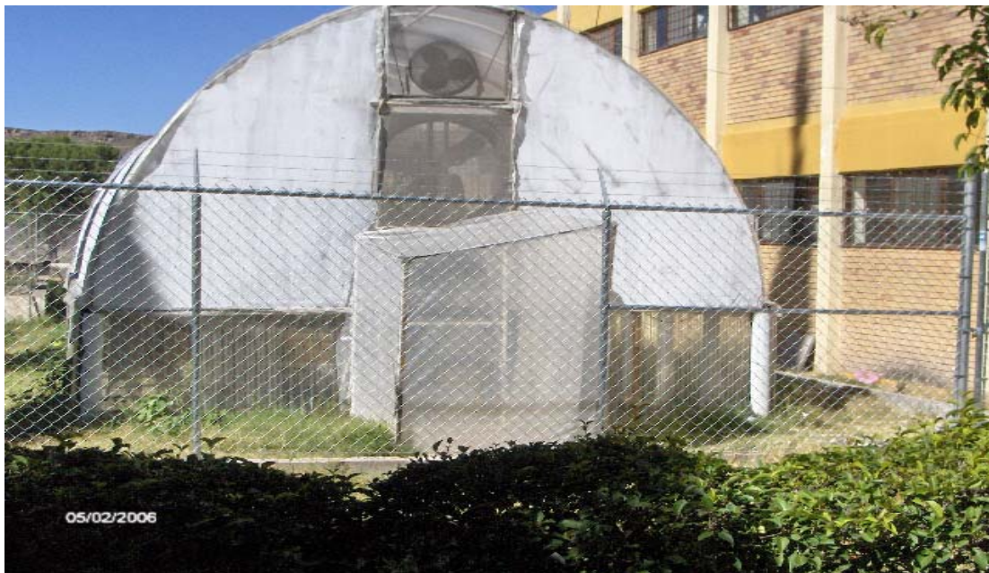
Figura 1. Estructura del invernadero.

El experimento se estableció en un invernadero de 50 metros cuadrados, tipo túnel modificado, el cual consta de una cubierta de polietileno de larga duración, las paredes son de policarbonato, un cabezal de riego, un sistema de riego por goteo, un extractor de aire, una pared húmeda y un higrómetro para estimar la humedad relativa