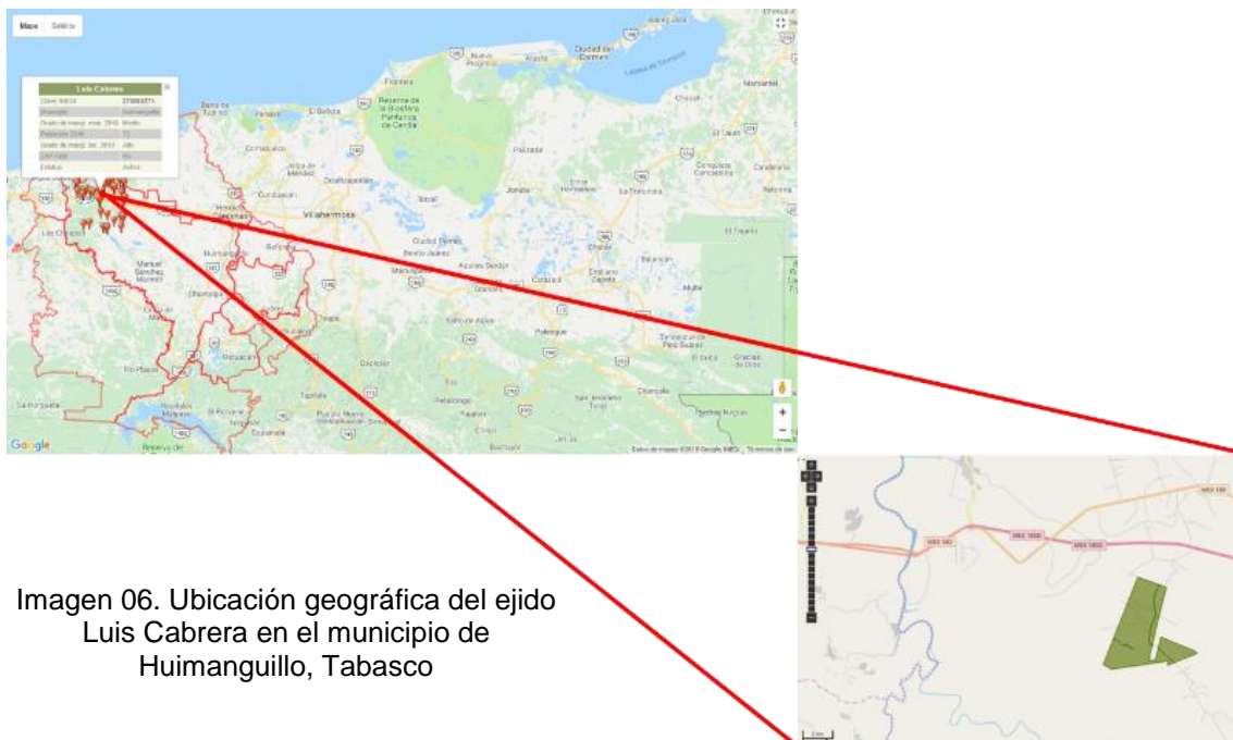
Imagen 06. Ubicación geográfica del ejido Luis Cabrera en el municipio de Huimanguillo, Tabasco

Lamentablemente, parte de esa cultura es la búsqueda de beneficios sociales por “permitir” actividades inherentes al sector de hidrocarburos. Durante la década de los noventa, la protesta social fue sofocada con acciones emergentes financiadas directamente por PEMEX o por el gobierno estatal para librar las operaciones del asedio de la población, toda vez que los bloqueos y cierres de accesos representaban riesgos de accidentes y pérdidas económicas (Fitz y Saury, 2018).