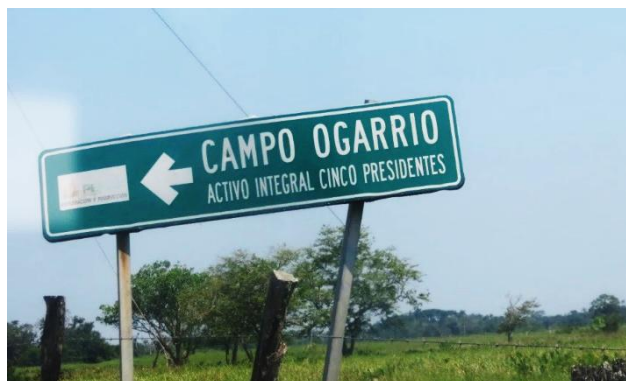
Imagen 01. Acceso al Campo Ogarrío

Ricardo Fitz Mendoza y José Raymundo Saury Arias (2018) exponen en su artículo Impactos socioambientales en el nuevo modelo energético: antecedentes, actualidad y perspectivas del sector hidrocarburos en Tabasco , que “la historia petrolera de Tabasco, que suma ya siete décadas, ha documentado in extenso el carácter transformador de esta industria extractiva. Las transformaciones ocurren en el medio físico, natural, y en la estructura y funcionamiento de los ecosistemas hasta la modificación del paisaje. Estos cambios también se presentan en el plano psicosocial, comunitario, y en las relaciones e interfaces que se generan por el cambio cultural derivado de una