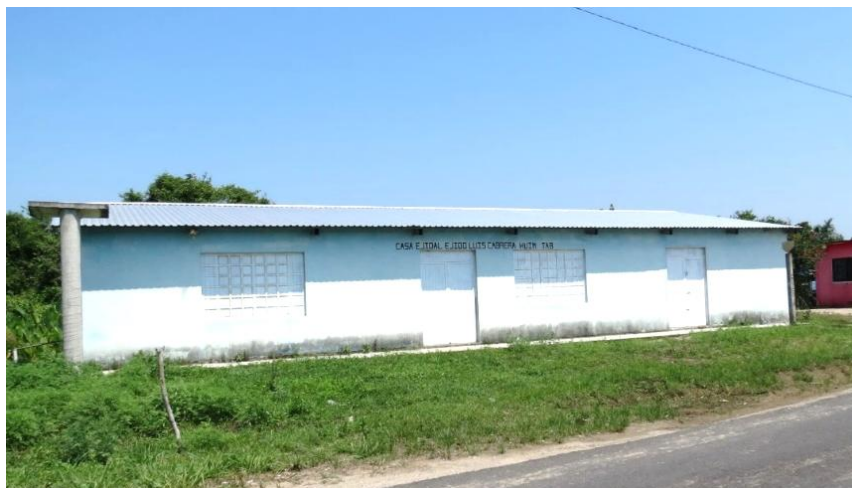
Imagen 06. Casa ejidal de Luis Cabrera

Dentro de la infraestructura del ejido se cuenta con una casa ejidal, un salón de usos múltiples, un aula que funcionó como escuela primaria con el nombre de Francisco Márquez, viviendas pequeñas y un comedor.