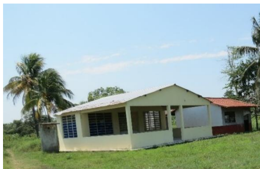
Imagen 07. Salón de usos múltiples