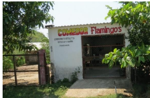
Imagen 08. Comedor

El acceso al ejido es por la carretera federal México 180. En el ejido existen caminos que fueron pavimentados por PEMEX, así como caminos de terracería que conectan con otras localidades. El tránsito vehicular es escaso, ya que no todos los habitantes cuentan con un vehículo. Además, la mayor circulación con poca luz del sol es de lo huachicoleros.