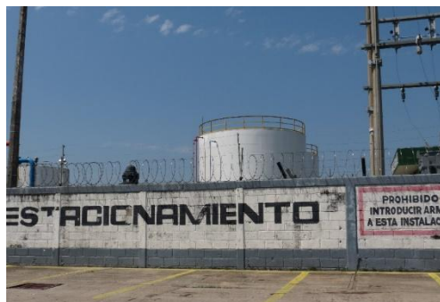
Imagen 02. Infraestructura petrolera