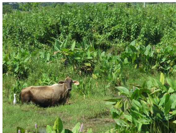
Imagen 05. Retención de agua en ganadería

En Tabasco, el gobierno a nivel estatal ha jugado el papel de mediador entre la Federación y la ciudadanía presuntamente afectada. La lucha constante entre afectados y afectados ha creado una ideología y cultura de rechazo hacia la industria petrolera.