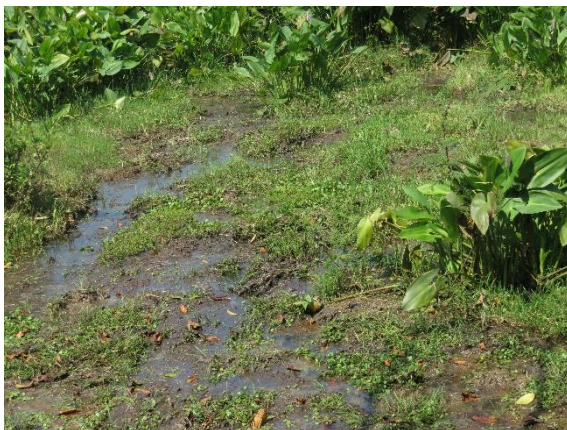
Imagen 04. Retención de agua

De acuerdo con los autores, el motivo principal de movilización social en Tabasco en contra de la antes paraestatal, realizado por habitantes de zonas de influencia petrolera, es la inconformidad siempre presente por las continuas afectaciones en viviendas e infraestructura pública. La protesta, cargada de un índice alto de irritación social, forma parte de la operación cotidiana de la industria en el territorio estatal.