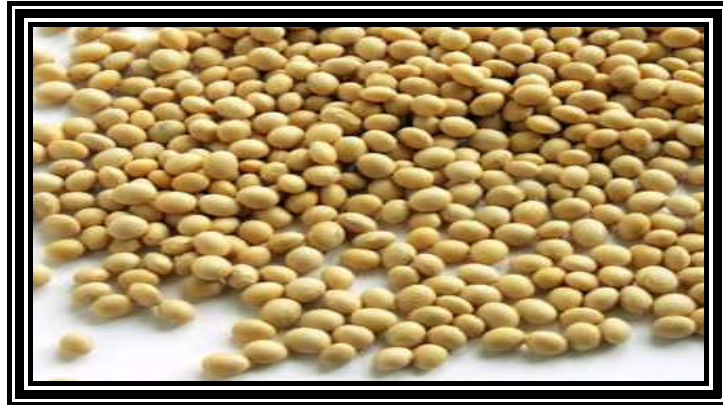
Figura 1. Soya (Glycine Max).

ó15 especies, de las cuales Glycine Max es la de mayor importancia económica, ya que es un cultivo anual cuya planta alcanza generalmente una altura de 80 cm, la semilla de soya se produce en vainas de 4 a 6 cm de longitud y cada vaina contiene de 2 a 3 granos de soya.