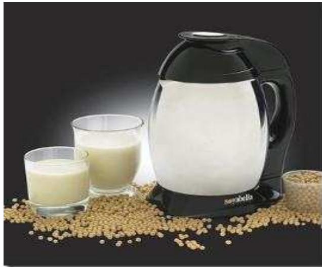
Figura 2. Leche de soya.