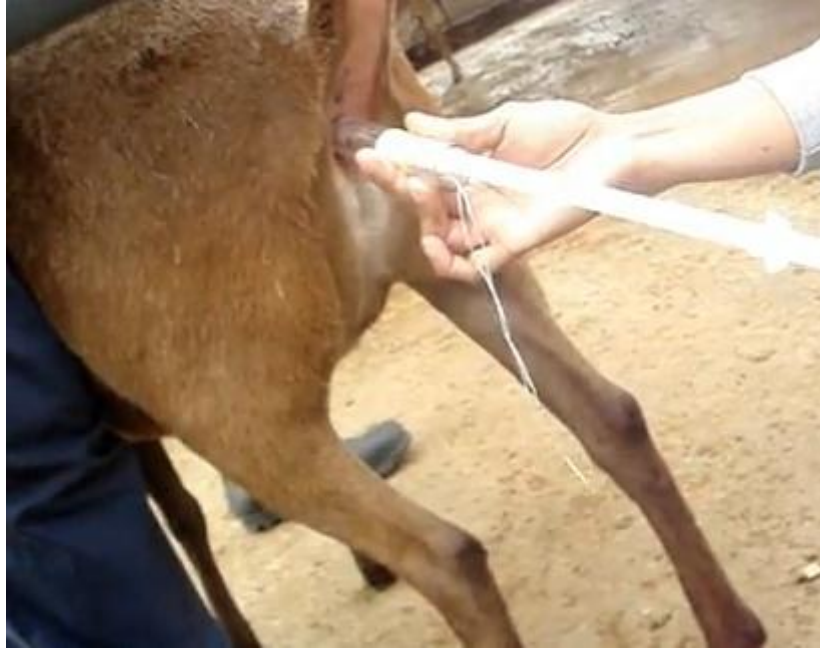
IMAGEN 7.- Forma de sincronización en las ovejas