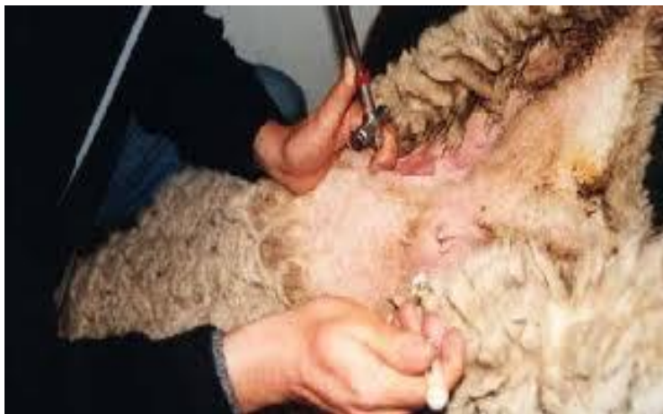
IMAGEN 5.- Técnicas de inseminación artificial por laparoscopia