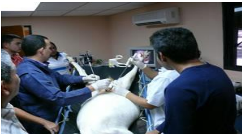
IMAGEN 6.- Vista de una práctica en la clínica de ovinos de la unam