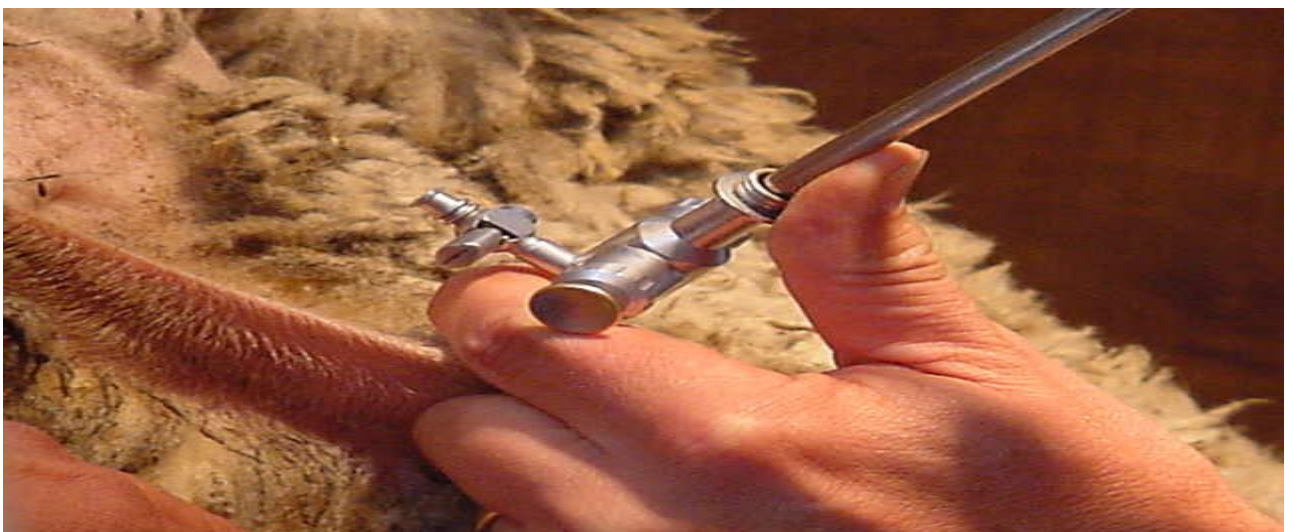
IMAGEN 9.- Inseminación intrauterina