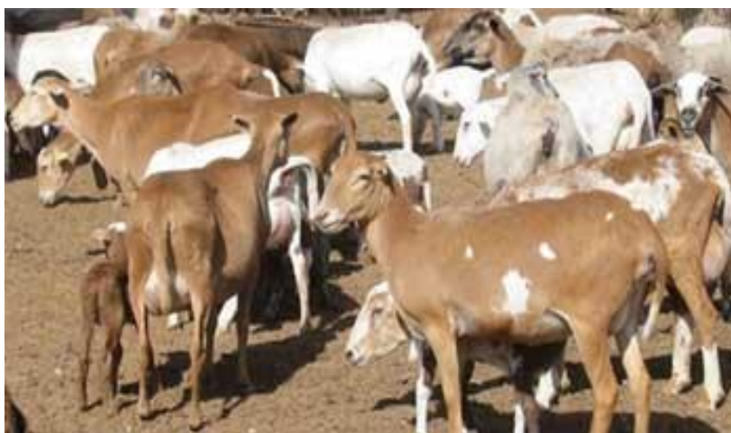
IMAGEN 1.- Hato iniciando con mejoramiento genético

Otro uso de la inseminación artificial es el cruzar nuevas estirpes o genotipos de animales. Un ejemplo de esto es el uso de sementales de Angora en rebaños de cabras salvajes. Esto se obtiene por cruce de cada generación de hembras con sementales de pura raza Angora. La utilización de sementales destacados tiene un campo de aplicación más amplio con la inseminación artificial permite un uso más amplio de sementales selectos con el propósito a los requisitos del mercado (Bearden y Fuquay, 1982; Salamón, 1990; Hafez y Hafez, 2000; Foote, 2002).