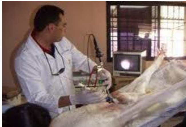
IMAGEN 8.- Muestra la forma de inseminación intrauterina

Las hembras superovuladas y tratadas relativamente altas de gonadotropina, ovulan más temprano que las normales. Estas hembras se deben inseminar con dosis altas de espermatozoides frescos (por lo menos 100 millones de espermatozoides móviles). En este caso la inseminación intrauterina puede realizarse 36-48 horas, después de retirados los pesarios. Cuando se utiliza semen congelado-descongelado en hembras superovuladas, la inseminación intrauterina se debe hacer 44-48 horas después de haber quitado los pesarios (Tabla 2) (Amoha y Gelaye, 1989; Amoha y Gelaye, 1990).