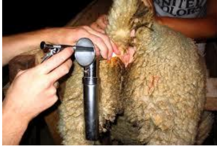
IMAGEN 3.- Depósito del semen con ayuda de un espéculo con luz