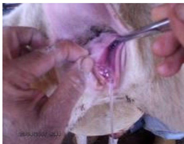
IMAGEN 2.- Se muestra el momento del depósito de semen por vía vaginal

Es muy importante que el éxito de la inseminación no se vea empañado por prisas indebidas (Bearden y Fuquay, 1982; Salamón, 1990; Mejia y Hernández, 1996; del Pino, 2000; Hafez y Hafez, 2000).