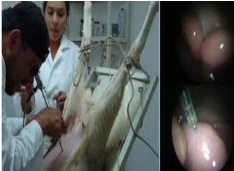
IMAGEN 4.- Depósito del semen mediante una pequeña incisión y vista al interior