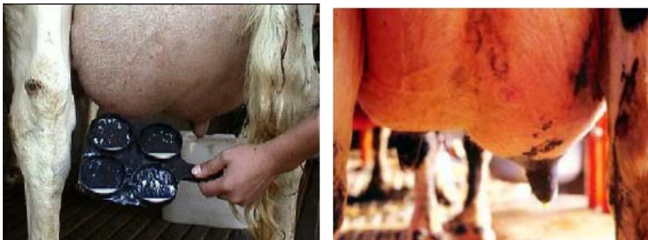
Figuras 1 y 2

En la forma clínica se presentan evidentes signos de inflamación como tumefacción, rubor, dolor, cambios notables en la secreción y eventualmente, signos sistémicos como fiebre, pérdida del apetito y depresión. Watts J.et al., 1988.