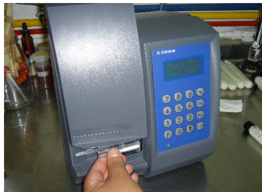
Fig.5 DeLaval Cell Counter