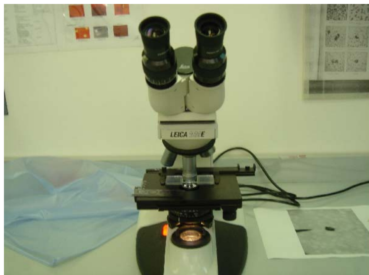
Cuenta Microscopica de Células Somáticas