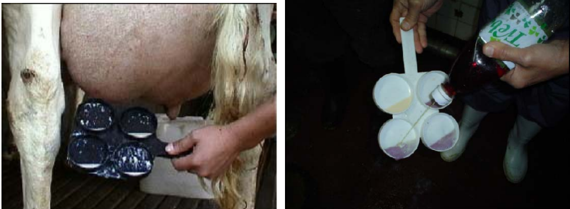
Fig 3 Prueba de California para mastitis