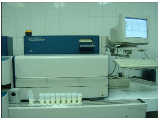
Fig.4 Fossomatic 5000