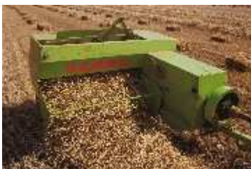
Figura 9. Empacadora convencional

En las empacadoras convencionales se mantiene el diseño que tan buenos resultados ha dado durante tantos años para elaborar pacas de este tamaño. Las pacas que producen suelen tener una anchura entre 40 y 60 cm, una altura entre 30 ó 40 cm y una longitud entre 30 y 140 cm (figura 9).