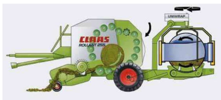
Figura 24. Funcionamiento.

Acerca de cada uno de los sistemas o cámaras donde pasa la paca se describen a continuación.