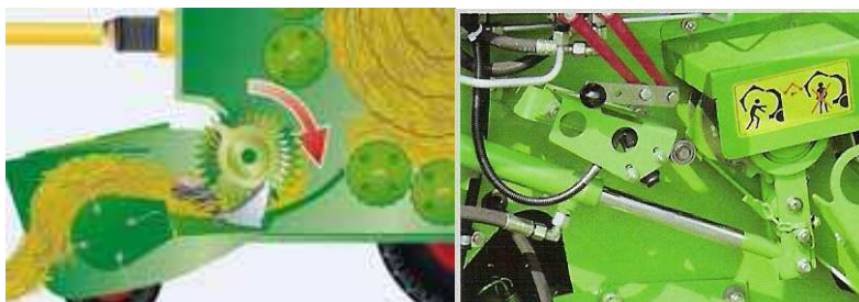
Figura 18. Roto reverse

garantizando con ello la mayor seguridad de trabajo en todas las condiciones de hierba.