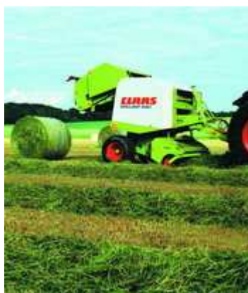
Figura 11. Rotoempacadora

En las de cámara variable, el volumen varía a medida que se introduce el forraje manteniendo la presión constante, produciendo pacas de diámetro variable y compresión muy uniforme.