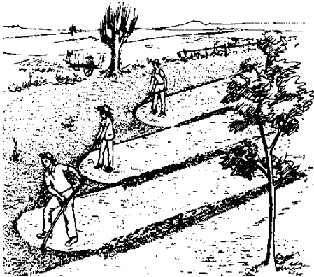
Figura 1. Corte de forraje con guadaña

Hacia el año de 1850 el equipo de henificación aun consistía en: guadañas (figura 1), hoz y rastrillos manuales.