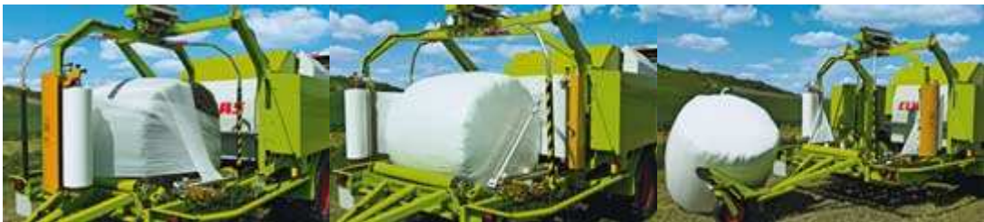
Figura 23. Dispositivo de embalaje

La UNIWRAP está equipada con dos encintadores de 750 mm. Así se puede envolver con seguridad una paca con un solapamiento del 52 % y seis capas de cinta plástica en tan sólo 35 segundos (figura 23). Con esto queda garantizado que la envolvedora siempre haya terminado antes que la empacadora. De manera que la ROLLANT puede utilizar todo su rendimiento aunque trabaje con la envolvedora.