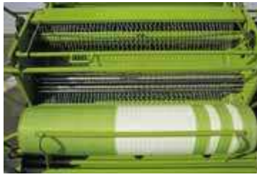
Figura 21. Sistema de atado