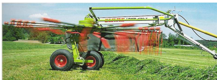
Figura 8. Hileradora de peines

Son rastrillos diseñados para la labor de hilerado. Están constituidos por uno o dos rotores con brazos horizontales dispuestos radialmente que llevan en su extremidad un pequeño peine con cuatro o seis púas flexibles. Estos peines giran alrededor del eje del rotor, manteniéndose verticales cuando entran en contacto con el forraje, girando posteriormente alrededor de cada brazo hasta colocarse horizontales debido a un leva que les obliga, una vez que ha depositado el forraje cerca del deflector para formar el cordón (figura 8).