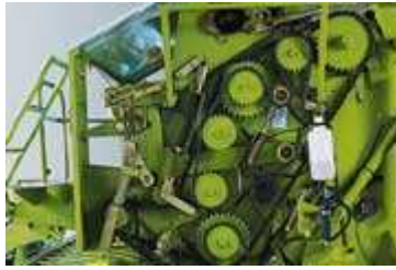
Figura14. Accionamientos de la empacadora

En la ROLLANT se accionan todos los rodillos. Así no se produce una parada de paca ni en las condiciones de cosecha más secas. Las fuertes cadenas de rodillos de la más alta calidad garantizan una absoluta seguridad de funcionamiento (figura 14). La tensión óptima de las cadenas queda garantizada por tensores de cadena autorregulables y bajo carga de resorte.