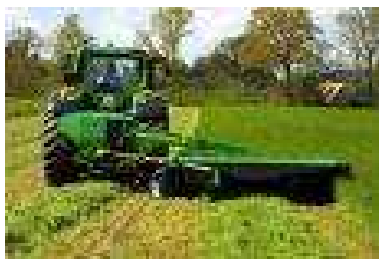
Figura 6. Segadora acondicionadora

maquinas que elevan el producto a una cámara donde se le puede comprimir a mayor presión que en el sistema anterior.