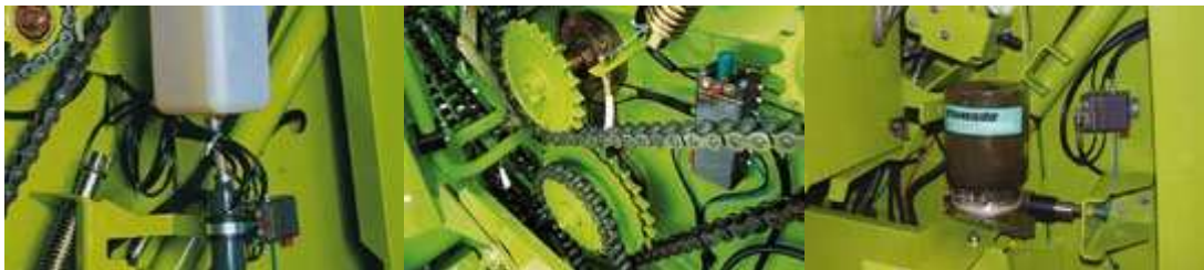
Figura 15. Engrase automático de los accionamientos

Las cadenas de accionamiento son engrasadas por el sistema automático de engrase de cadenas, este cumple un papel importante a la hora de minimizar al máximo el desgaste. A través de tres distribuidores centrales de engrase, se abastecen continuamente los soportes del rodillo de prensado con grasa. Opcionalmente se encarga de esta tarea el nuevo sistema de engrase central (figura 15).