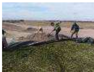
Figura 27. Silo tradicional

Éstos incluyen el corte y la recolección, la elaboración del producto (henaje, producción del ensilado), fungibles (energía, insumos), depreciación del equipo, depreciación de los edificios (depósito de grano, silo) y mano de obra, la cual es a menudo intensa para estas operaciones. El forraje preservado es entonces costoso.