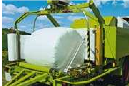
Figura 25. Silo en pacas redondas

En la selección de la empacadora es muy importante la presión y homogénea envoltura y que cuente con dispositivo picador para cuando se trabaja con materiales con alto contenido de humedad