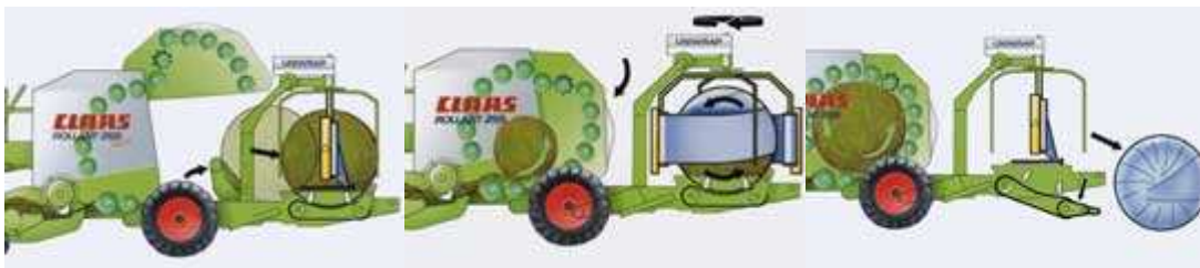
Figura 22. Traspaso de la paca

La construcción compacta de la combinación de empacadora con envolvedora UNIWRAP es la base para un traspaso rápido y seguro de la paca. El traspaso de la paca se realiza sin que esta toque el suelo, con la denominada plataforma basculante. Aquí se encargan unas chapas de centraje laterales de garantizar un perfecto movimiento de la paca, incluso cuando se trabaja en pendiente. La plataforma basculante levanta la paca con seguridad hasta depositarla sobre la mesa de embalaje, donde la paca es guiada por cuatro grandes rodillos de apoyo (figura 22).