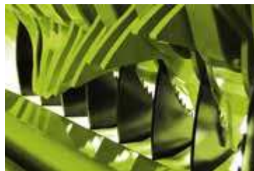
Figura 17. Roto Cut (rotor de corte)

El concepto de ensilado de calidad está muy unido al sistema CLAAS ROTO CUT, porque el ensilado cortado se puede compactar mejor y ofrece mejores características para una fermentación óptima del ácido láctico.