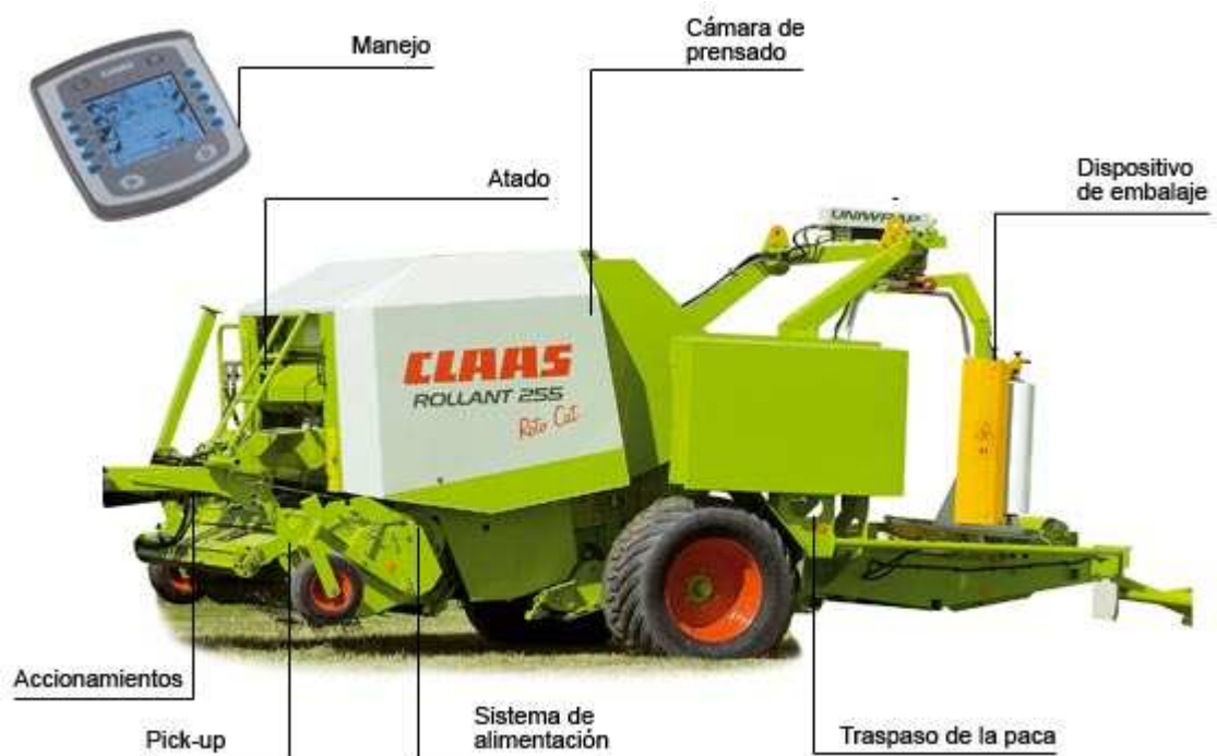
Figura 12. Empacadora encintadora y sus partes

Los componentes primarios de la empacadora son: