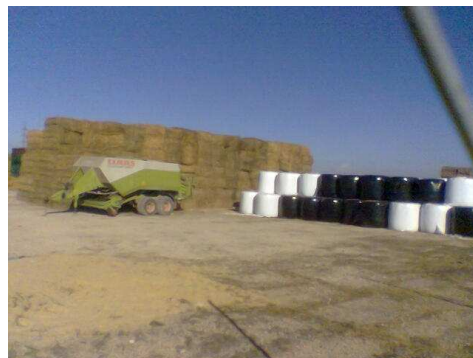
Figura 26. Comparación de almacenamiento