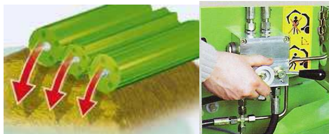
Figura 20. Sistema MPS

del forraje. La técnica ROLLANT ofrece con sus 16 rodillos de acero las condiciones ideales para ello. Cuando otros sistemas llegan a sus limitaciones, es cuando la ROLLANT realmente demuestra de lo que es capaz, ya que el principio de trabajo de los rodillos de acero de libre movimiento con superficie perfilada garantiza una perfecta formación de pacas sin problemas, incluso en condiciones de cosecha húmedas y sucias. La construcción de los rodillos de prensado con hasta ocho platos soporte interiores demuestra claramente la gran calidad de la fabricación CLAAS.