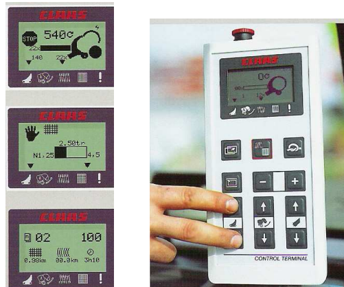
Figura 13. Control Terminal de la empacadora

La ROLLANT 255 RC UNIWRAP está equipada con el CLAAS COMMUNICATOR o también llamado control terminal. La terminal está bien ordenada y mediante su gran pantalla mantiene al conductor estar continuamente informado sobre el estado operativo de su máquina en todos los aspectos. Además puede acceder en todo momento a uno de los cinco menús y modificar rápidamente con una mano los parámetros de ajuste más importantes. El atado, abrir la compuerta trasera, expulsar la paca, cerrar la compuerta trasera, todos los procesos pueden ser dirigidos a través del COMMUNICATOR. El manejo y el control de la maquina se facilitan en gran medida gracias a funciones automáticas y a la representación grafica de los estados operativos de la pantalla del control terminal (figura 13).