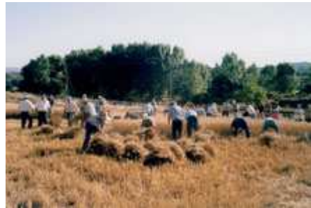
Figura 2. Corte de forraje con hoz

Durante miles de años se usaron la hoz (figura 2) y la guadaña para cortar cultivos y pastos para heno. Mientras en algunos lugares del mundo todavía se usan estas herramientas manuales, en 1800 mucho del equipo manual fue reemplazado por segadoras tiradas por caballos o bueyes (figura 3).