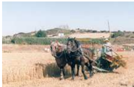
Figura 3. Corte de forraje con tracción animal

Durante miles de años se usaron la hoz (figura 2) y la guadaña para cortar cultivos y pastos para heno. Mientras en algunos lugares del mundo todavía se usan estas herramientas manuales, en 1800 mucho del equipo manual fue reemplazado por segadoras tiradas por caballos o bueyes (figura 3).