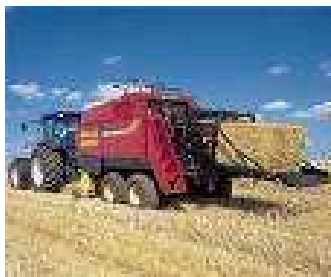
Figura 10. Macroempacadora

Permiten producir pacas de grandes dimensiones, con pesos entre los 100 y 500 kg, anchuras de 80 –120 cm, alturas de 45 – 130 cm y longitudes entre 2 y 3 m. Las grandes pacas rectangulares permiten un mejor aprovechamiento del espacio en transporte y almacenamiento en comparación con las pacas cilíndricas (figura 10).