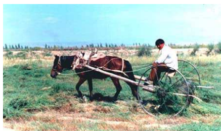
Figura 4. Rastrillo de tracción animal

El método más antiguo de rastrillado de heno, con herramientas manuales fue utilizado hasta principios de 1800, cuando se desarrolló el rastrillo tirado por caballos y bueyes (figura 4).