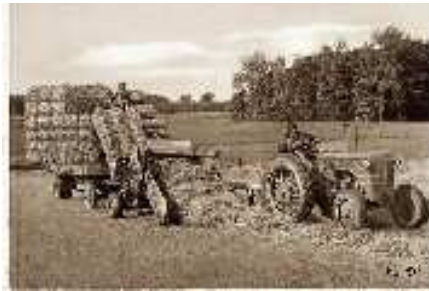
Figura 5. Primeras empacadoras mecánicas

En el siglo XIX empiezan a aparecer mecanismos que facilitan la compresión y multiplican la fuerza aplicada, y así, en 1813 la oficina de patentes de los Estados Unidos de América registra una empacadora manual estacionaria.