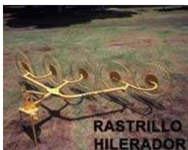
Figura 7. Rastrillo

Estos equipos usan unos rodillos aplastantes o rizadores para acondicionar el heno de manera que seque rápido. Los rodillos acondicionadores son movidos por el PTO. Estos halan el heno entre los rodillos y tiran el heno fuera por la parte de atrás de la máquina. Los rodillos pueden recoger una piedra o cualquier otro objeto que puede ser tirado también.