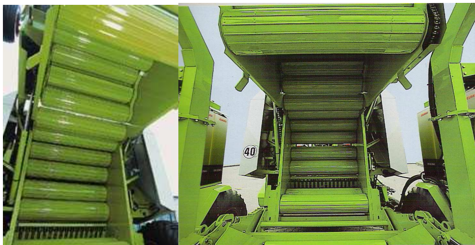
Figura 19. Cámara de rodillos

Las rotoempacadoras de cámara fija cuentan con una serie de robustos rodillos y la densidad de la paca se ajusta mediante la presión soportada por el portón de expulsión (figura 19). Las rotoempacadoras de cámara variable cuentan con una serie de correas que arrastran el material haciéndolo girar en el interior de la cámara, la presión de la paca es regulable durante su formación. La posibilidad de formar pacas de distintos tamaños para una mejor adecuación al sistema de transporte y almacenamiento es ofrecida por diversos modelos de empacadoras.