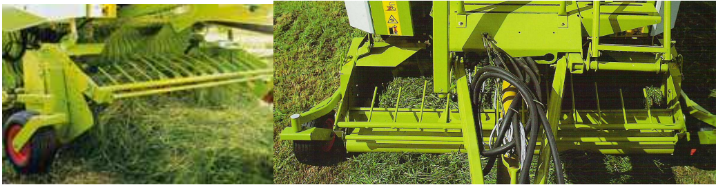
Figura 16. Recogedor de la empacadora

Va situado en la parte delantera de la máquina, centrado con ella, y ésta a su vez va alineada con el tractor, por lo que el cordón de heno debe pasar por debajo de éste. Para conseguir una alimentación homogénea en la cámara de empacado, es necesario que los cordones tengan una anchura acorde con la del recogedor, que oscila normalmente entre 1,20 y 2 m (figura 16).